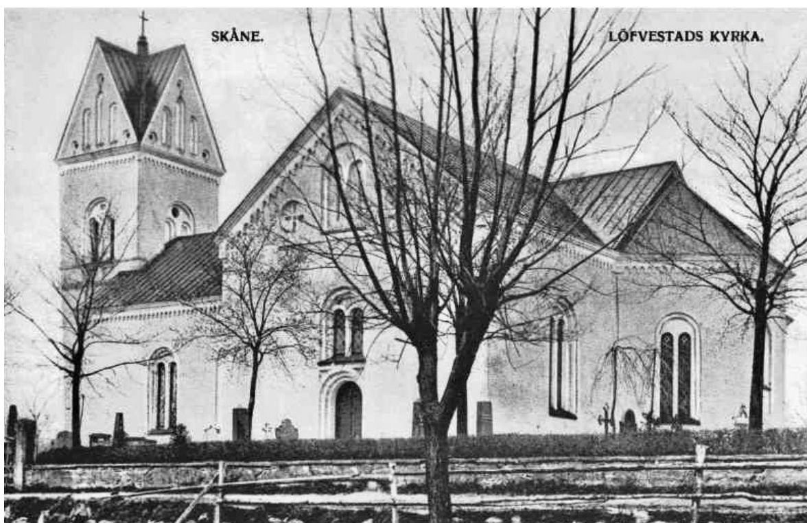
Lövestads kyrka fotograferad vid okänd tidpunkt, troligen sent 1800-tal eller tidigt 1900-tal. Exteriören är i stort sett oförändrad.

och får liksom predikstol och altarparti ny färgsättning i grå nyanser med detaljer i rött, blått och förgyllning. Samtliga furudörrar ersätts med ekdörrar. Året därpå tillkommer ny orgel och 1961 elektrifieras klockringningen.