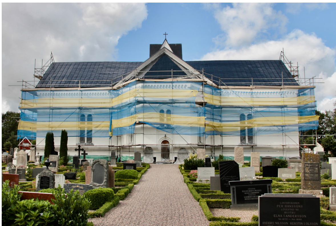
Kyrkan från öster med koravslutningen och de bägge korsarmarna under pågående fasadrestaurering.

Kyrkans huvudentré i väster utgörs av en pardörr i en rundbågig perspektivportal i fyra språng. De rakt avslutade dörrbladen är klädda med lackad ekpanel som fästs med kopparnitar och har sparkplåtar i koppar. Ovan pardörren sitter ett lunettformat blyspröjsat överljus. Entrén nås via en två steg hög trappa av krysshämrad granit. Tornets enda fönster utgörs av ett rundfönster i järn med tvåsprängig omfattning, placerad i tornvåningen ovanför västentrén. Under fönstret sitter en mindre minnes-