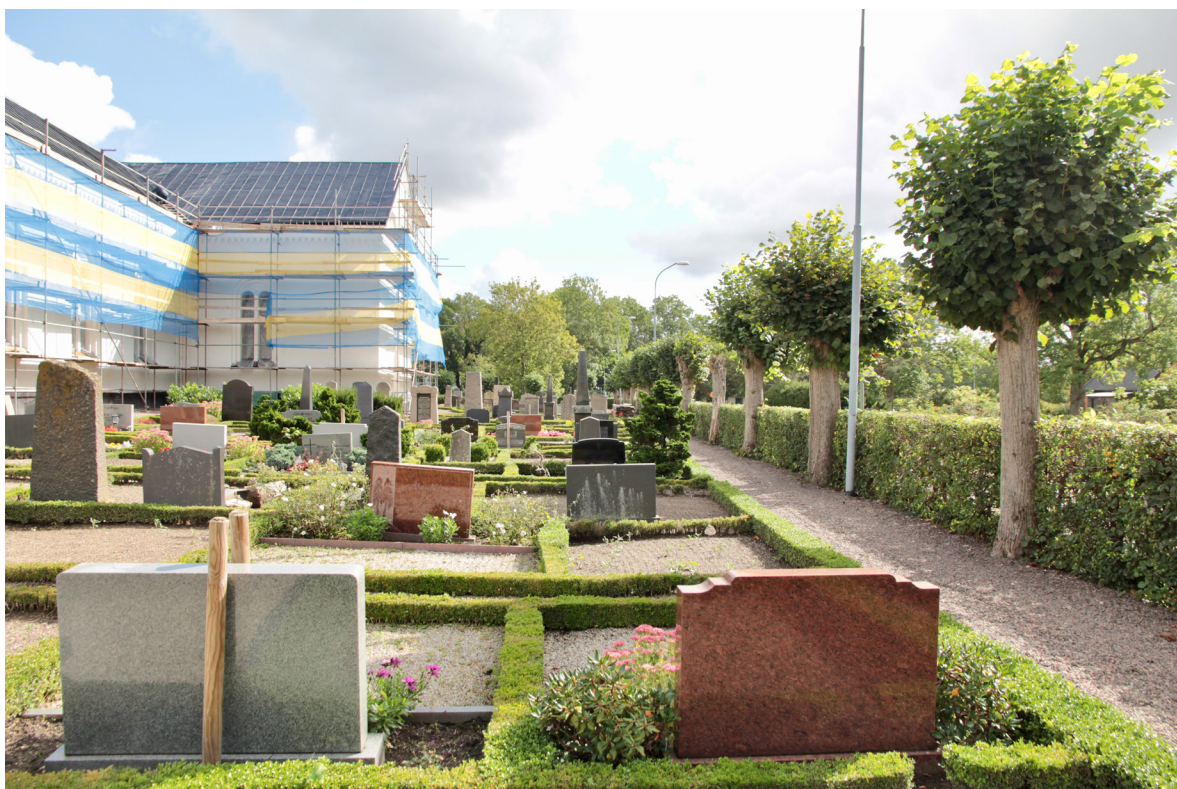
Lövestads kyrkogård med trädkrans av hamlade lindar, infattningshäckar och en blandning av äldre högresta och yngre lägre gravstenar.

Den gamla kyrkogården fortsatte emellertid att brukas och 1942 uppfördes ett bårhus i det nordvästra hörnet efter ritningar av domkyrkoarkitekt Eiler Græbe, som 1970 kompletterades med en byggnad med snarlik utformning för förråd och wc. Dessförinnan hade ytterligare en ekonomibyggnad i form av en redskapsbod tillkommit norr om kyrkan. Byggnaderna uppfördes på den lilla landremsa som återstod mellan kyrkogårdens tidigare norra gräns och ån.