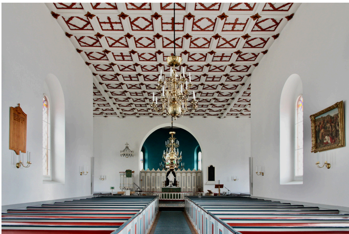
Kyrkorummet mot öster.

Kyrkorummet utgörs av långhuset och de båda korsarmarna. Korsmitten upptas till större del av det senare utbyggda koret med två steg högre golvnivå. Koravslutningen, som avskiljs från kyrkorummet med ett altarskrank, fungerar som sakristia. Golven är i gångarna och under läktaren belagda med rektangulär klinker i varierande brunröda kulörer. De slutna bänkkvarteren i långhus och korsarmar står på upphöjda lackad brädgolv medan koret i korsmitten är belagt med kalksten. Väggarna är slätputsade och vitkalkade och taket utgörs av samma typ av kassetak som i vapenhuset. De lövsågade listverken har här en tredje variant av utformning i form av en snedställd kvadrat. Fönstrens innerbågar i trä målade med vit oljefärg. Korsarmarnas entréer är sedan 1950-talet förbyggda med utrymmen för bland annat bårum och textiltförråd. Dessa upptar hela korsarmarnas bredd och når upp till gavlarnas fönster. Utrymmena nås från kyrkorummet genom pardörrar i ramverkskonstruktion som är gråmålade med röda och blå detaljer i fyllningarna.