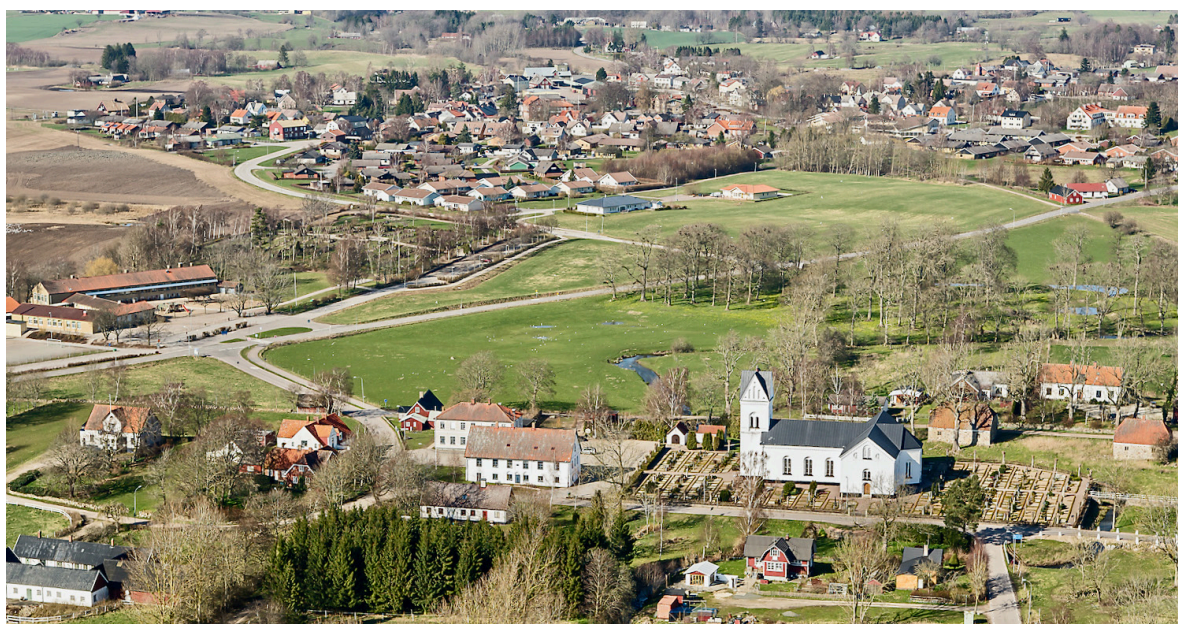
Flygbild över Lövestad 2014, tagen från söder. Väster om kyrkan ligger skolhuset och i nordväst Lövestads kungsgård. I bakgrunden syns Lövestads stationssamhälle.

Kyrkbyn skiftades 1832, då 48 av de 55 gårdarna flyttades ut och gatehus sedermera uppfördes på de gamla gårdstomterna. I samband med att järnvägen Tomelilla–Eslöv anlades på 1860-talet byggdes en station norr om kyrkbyn på mark från två utskiftade gårdar. Kring stationen växte snart ett stationssamhälle fram, vilket bidragit till att kyrkbyn i stor utsträckning bevarat sin ålderdomliga karaktär av sockencentra, med prästgård från sent 1800-tal öster om kyrkan och kombinerad skolbyggnad och rådhus från 1848 efter ritningar av C.G. Brunius i väster. Byn bevarar även flera gatehus