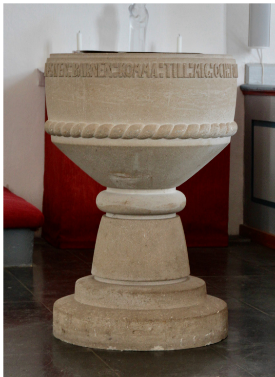
Dopfunten i sandsten från 1938.

Den slutna bänkinredningen flankerar mittgångarna i långhus och korsarmar. De läsbara dörrarna och ryggstöden är uppbyggda som ramverk med fyllningar medan gavlarna är släta. Bänkarna