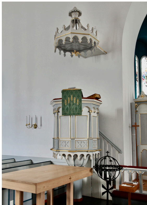
Predikstolen med baldakin.