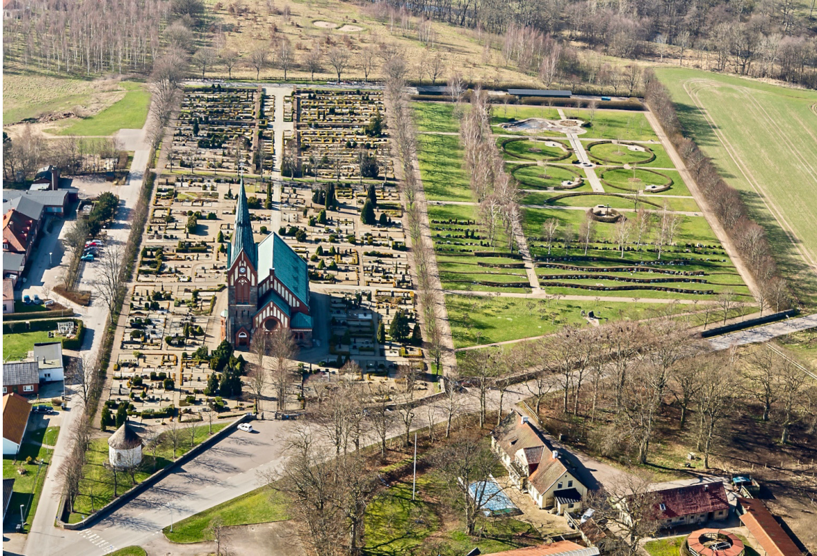
Södra Åsums nya kyrkogård 2014, fotograferad från öster. Den äldsta delen i söder och utvidgningen i norr har tydligt olika karaktärer.