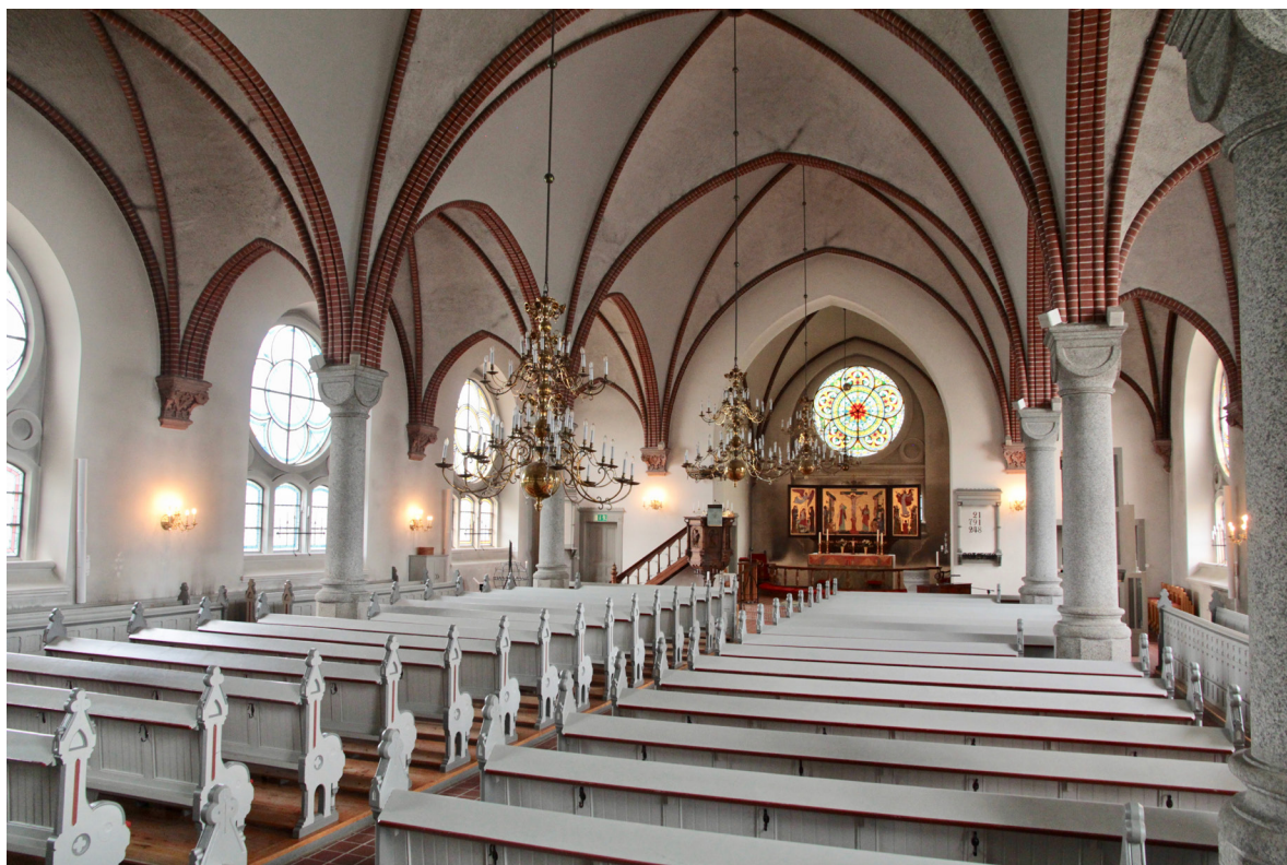
Kyrkorummet mot koret i öster.

Långhuset är gestaltat som en hallkyrka med tre skepp. De fyra travéerna är slagna med vitputsade kryssvalv och har valvribbor av rött formtegel. I mittskeppet vilar valven på sex granitkolonner med tärningskapitäl och i yttermurarna på profilerade kragstenar i Övedssandsten med bladornamentik i relief. Fönstrens innerbågar har