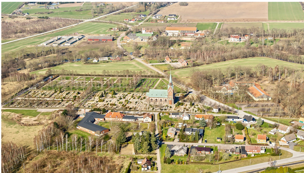
Flygbild över Södra Åsum 2014, tagen från söder. I bakgrunden skymtar den medeltida kyrkan.

Kyrkbyn finns belagd i skrift sedan 1300-talet, då som Asum (Södra lades till 1885 för att skilja socknen från Norra Åsum), och kraftkällan som ån utgör har varit central för byn där en kvarn var i drift fram till 1960-talet. Den senaste kvarnanläggningen från 1860 med tillhörande inlopp, rännor, dammar och ekonomibyggnader finns ännu bevarad, liksom huvudbyggnaden Villa Åsum uppförd 1902–03 efter engelskt villaideal. Södra Åsum utgör riksintresse för kulturmiljövården, där utöver de båda kyrkorna, Åsumsgården och kvarnanläggningen även skolbyggnad, en av länets bäst bevarade stenvalvsbroar från 1700-talet samt en av länets äldsta friluftsbad nämns som uttryck för riksintresset.