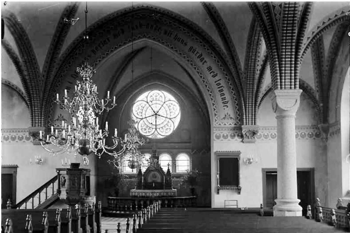
Interiören fotograferad 1929. Den ursprungliga altaruppsatsen finns ännu kvar , liksom valvens och väggarnas nygotiska dekorationsmålerier.

1961 uppförs en ny kyrkogårdsmur i öster, återigen efter ritningar av Græbe. Tio år senare utförs en replik av den romanska dopfunten från den medeltida kyrkan av stenmästare Hans Olofsson, Sjöbo. 1976 inrättas RWC i nedre tornrummet. 1982 förses samtliga yttertrappor med handledare och två år senare förses västentrén med handikappramp i samband med en större exteriör och interiör restaurering 1984–85. Kyrkans putsade partier förses vid detta tillfälle troligen med ny puts, avfärgad i grårosa kulör, medan fönstren målas med oljefärg. Valven isoleras med 150 mm mineralull. Invändigt installeras vattenburen golvvärme i sidogångarna medan korets radiatorer ersätts av mindre konvektorer. Golvens ursprungliga viktoriaiplattor byts ut mot kvadratiskt hårdbränt rött tegel och bänkraderna glesas ut för bättre komfort. Församlingen ansöker även om att avlägsna kyrkans ursprungliga orgel av Salomon Molander från 1902, vilket avslås. Istället avyttras en kororgel från 1977 till Björka kyrka som 1991 ersätts av en kororgel byggd av Smedmans orgelbyggeri i Lidköping. Samma firma renoverar 1992 Molander-orgeln. Detta år avlägsnas även akustikputsen