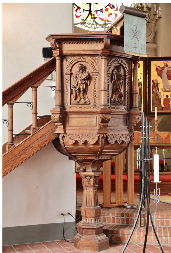
Predikstolen tillverkades troligen 1736.

Predikstolen i ek är troligen tillverkad 1736 av bildhuggaren Alexander Råå i Blentarps och härstammar ursprungligen från Skartofta kyrka som lämnades som ödekyrka när församlingen uppgick i Öveds församling 1809. Predikstolen kom till Södra Åsums kyrka 1825 genom försorg av friherre Charles Émile Ramel på Övedskloster. När den nya kyrkan byggdes överfördes predikstolen hit, samtidigt som dess polykroma bemålning, som enligt en beskrivning från 1830 var utförd i pärlgrått, brunt, svart samt förgyllning, avlägsnades. Korgen har sexsidig planform med öppning mot trappan och en sida mot väggen. De övriga sidorna har skulpturer av de fyra evangelisterna med respektive attribut ståendes i ornamenterade rundbågar. Korgens hörn markeras av kolonnetter som vilar på volutformade konsoler. Understycket är skålformat och