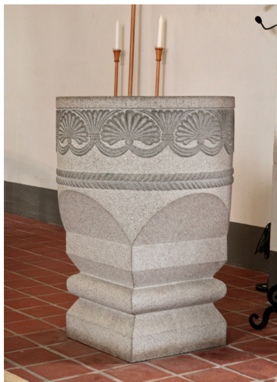
Dopfunten är en replik av den medeltida kyrkans romanska dopfont.