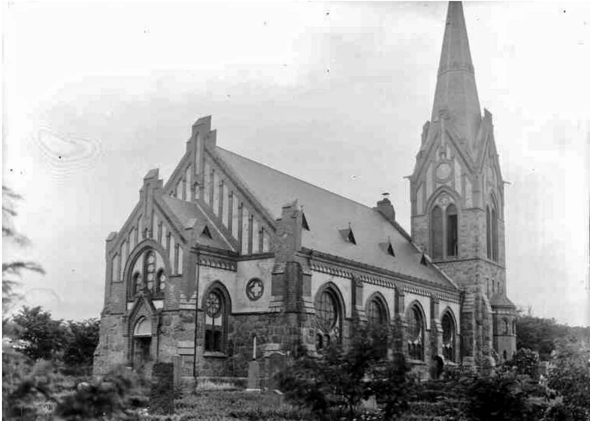
Kyrkan fotograferad 1929, året innan gavelkrön och tinnar demonterades vid den första restaureringen.

och gavelkrön demonterades varpå gavelmurarna plockades ner till under de dåvarande stående sågskiften som inte återskapades vid uppmurandet. Skiffertakets anslutningar mot murverken avtäcktes med kopparplåt medan strävpelarnas och flera av fönsterbänkarnas täckning av glaserat tegel ersattes av kopparplåtsklädd betong respektive Grythytteskiffer. Fasadernas befintliga kvastade gula putsytor ersatte Blanck med slätputs i rödgrå ton då han ansåg att den ursprungliga materialblandningen gav ett rött intryck.