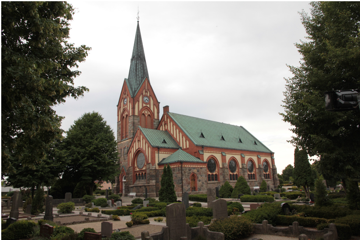
Kyrkan från sydost.

Kyrkan har tre entréer, av vilka den västra fungerar som huvudentré. Västportalen utgörs av ett framskjutande gavelparti murat i rött tegel med en rakt avslutad pardörr i lackad stående ekpanel och ett svagt spetsbågigt tympanonfält där den förgyllda texten "UPPFÖRD UNDER OSCAR DEN II 25 REGERINGSÅR ÅR 1901" framställs på en kalkstensplatta. Dörrbladen pryds av dekorativa svartmålade smidesbeslag och har liksom tympanonfältet vitputsad omfattning. Ett vilplan utanför ingången nås via trappsteg i granit samt en ramp av betongplattor från söder. Portalen i tornets östfasad följer samma princip men har överljus med fyrpassformad järnspröjsning