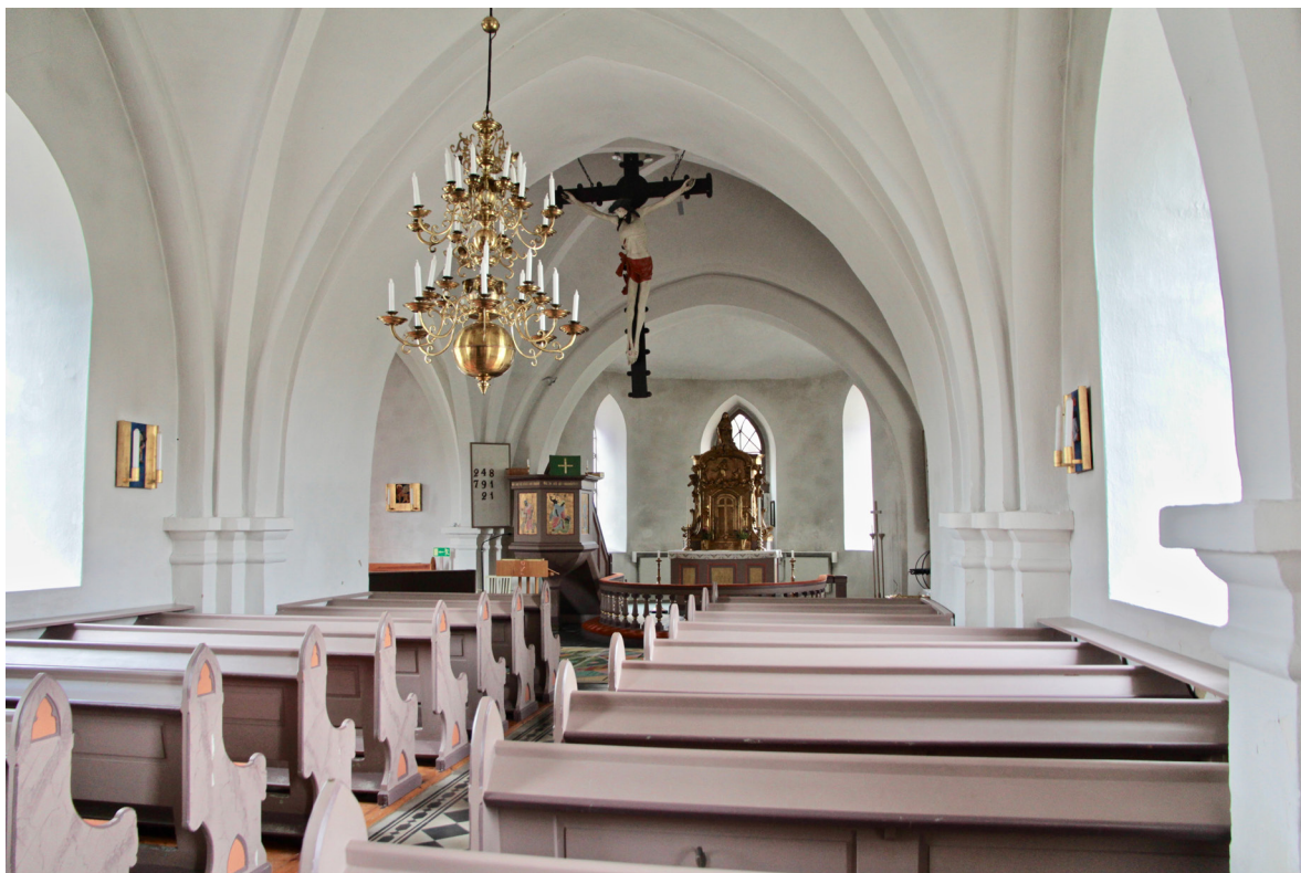
Långhuset fotograferat mot absiden i öster. I korsmitten hänger triumfskrucifixet från 1400-talet.

Kyrkvinden nås via en mindre lucka från tornvåningen, som återfinns en våning över orgelläktaren. Samtliga valv är oisolerade. Takstolskonstruktionen i furu med inslag av äldre återanvänt ekvirke härrör från ombyggnaden på 1860-talet.