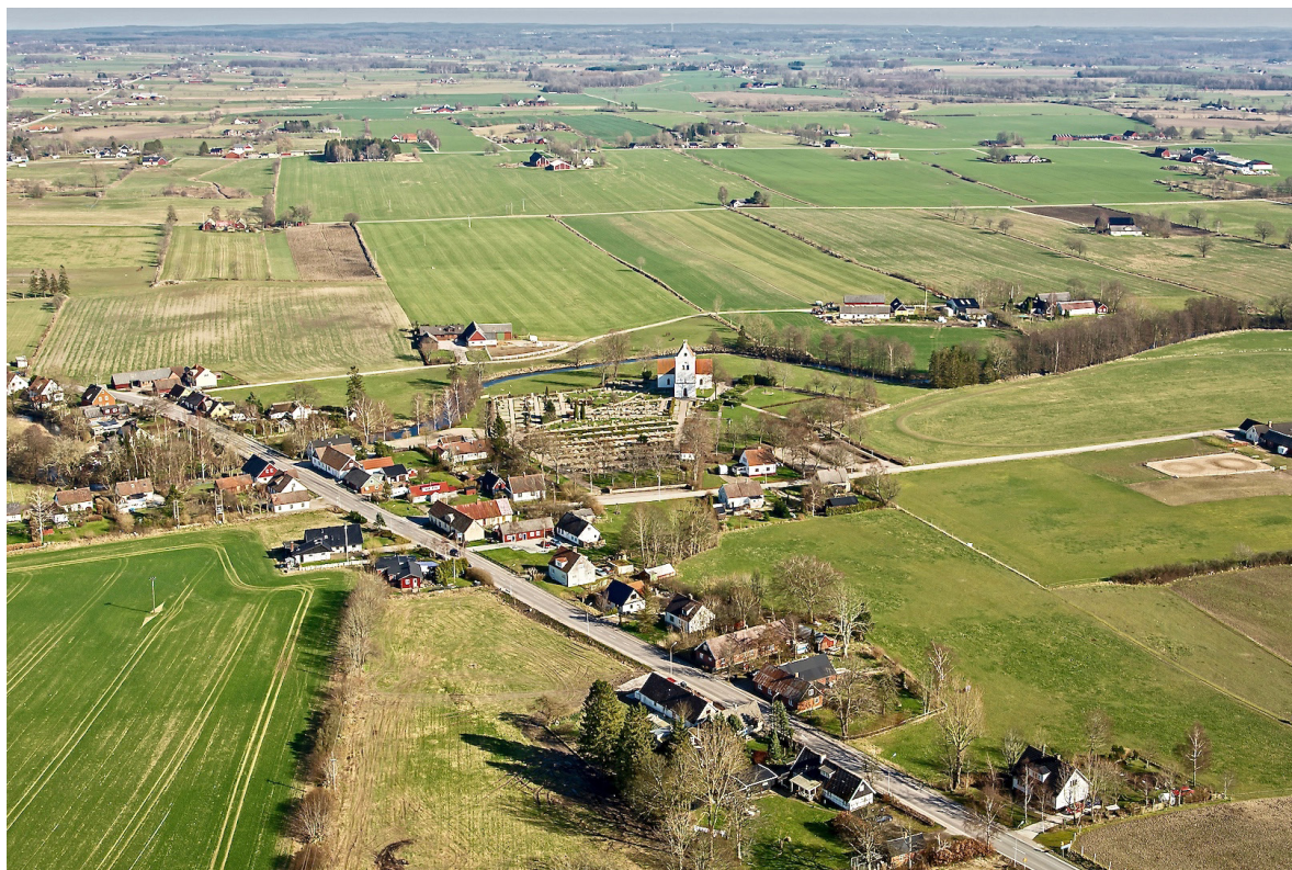
Flygbild över Vollsjö by 2014, tagen från väster.

Vollsjö kyrka ligger en dryg mil nordväst om Sjöbo i ett öppet odlingslandskap med inslag av skogsdungar, invid den slingrande Vollsjöån. Kyrkbyn, som idag går under benämningen Vollsjö by, var innan 1800-talets skiften en stor by med ett 30-tal gårdar och gatehus. Endast ett fåtal av dessa låg emellertid kvar efter skiftet och på de gamla gårdstomterna finns idag villabebyggelse som till stor del uppfördes under 1920- och -30-talen. Norr om kyrkan och den samlade bebyggelsen utmed den gamla bygatan ligger Vollsjögården, som var en av de 18 huvudgårdar danska kronan fick avstå till Sverige som lösen för Bornholm vid freden i Köpenhamn 1660. Idag utgörs huvudbyggnaden av ett putsat tvåvåningshus i sten, men på platsen ska det enligt traditionen tidigare ha legat en kungaborg.