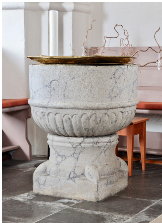
Den romanska dopfunten utgör kyrkans äldsta inventarium.