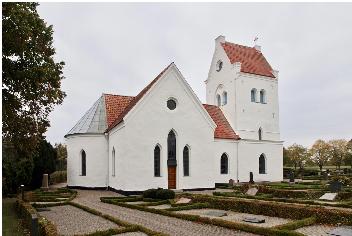
Kyrkan fotograferad från nordöst med den halvrunda absiden och norra korsarmen.

Kyrkans huvudentré i väster utgörs av spetsbågig perspektivportal med en rakt avslutad pardörr i lackad ek. Dörrbladen är av ramverkstyp med tre fyllningar vardera. Även det övre spetsbågigt avslutade fasta ekpartiet är utformat som ramverk med fyllningar, här med spetsbågig form. Entrén nås via två låga trappsteg i granit. Tornets bottenvåning har i söder och norr vardera ett högre och gråmålat spetsbågigt fönster i gjutjärn. Den krysställda spröjsningen indelas i två lansettbågar och överst en davidstjärna. De slätputsade omfattningarna har två språng. Tornets övre våningar ovan gördelgesimsen är något indragna jämfört med den fullbreda bottenvåningen. Tornvåningen har en utskjutande putsad sockel som i samtliga väderstreck utom öster bryts upp av ett mindre lansettfönster i gjutjärn, medan klockvåningen har två svagt spetsbågiga ljudöppningar i vardera fasad som i väster och öster är placerade i indragna spetsbågiga partier med en central rund blindering i två språng. De djupt sittande ljudluckorna är utförda av stående gråmålad panel. Samtliga fasader pryds av liljeformade svartmålade ankarjärn och de branta gavelröstena åt väster och öster har vardera ett rundfönster av gråmålat järn med slätputsade omfattningar i tre språng.