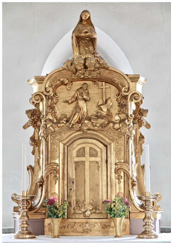
Sakramentskåpet är ett italiensk barockarbete från 1600-talet.

Predikstolen uppges i kyrkans underhållsplan ha byggts om 1929. Frånsett att korgens målningar då utfördes av konstnären Per Siegård framgår det inte på vilket sätt den ska ha byggts om. Dess ålder och upphovsman är också okända. På ett äldre fotografi av dålig kvalitet tycks hörnen markeras med pilastrar. Möjligen medförde ombyggnaden 1929 en förenkling av formspråket där dekorativa detaljer avlägsnades. Predikstolen har idag en korg med tre synliga sidor och svängt understycke som vilar på en smal hexagonal fot. Den profilerade överliggaren har förgylld text. Siegård's modernistiskt och bysantinskt inspirerade målningar framställer bibliska motiv i ljusa färger på förgylld botten. Färgsättningen går i bränd terra/lila med detaljer i rött och svart. Understycket och foten är marmorerade.