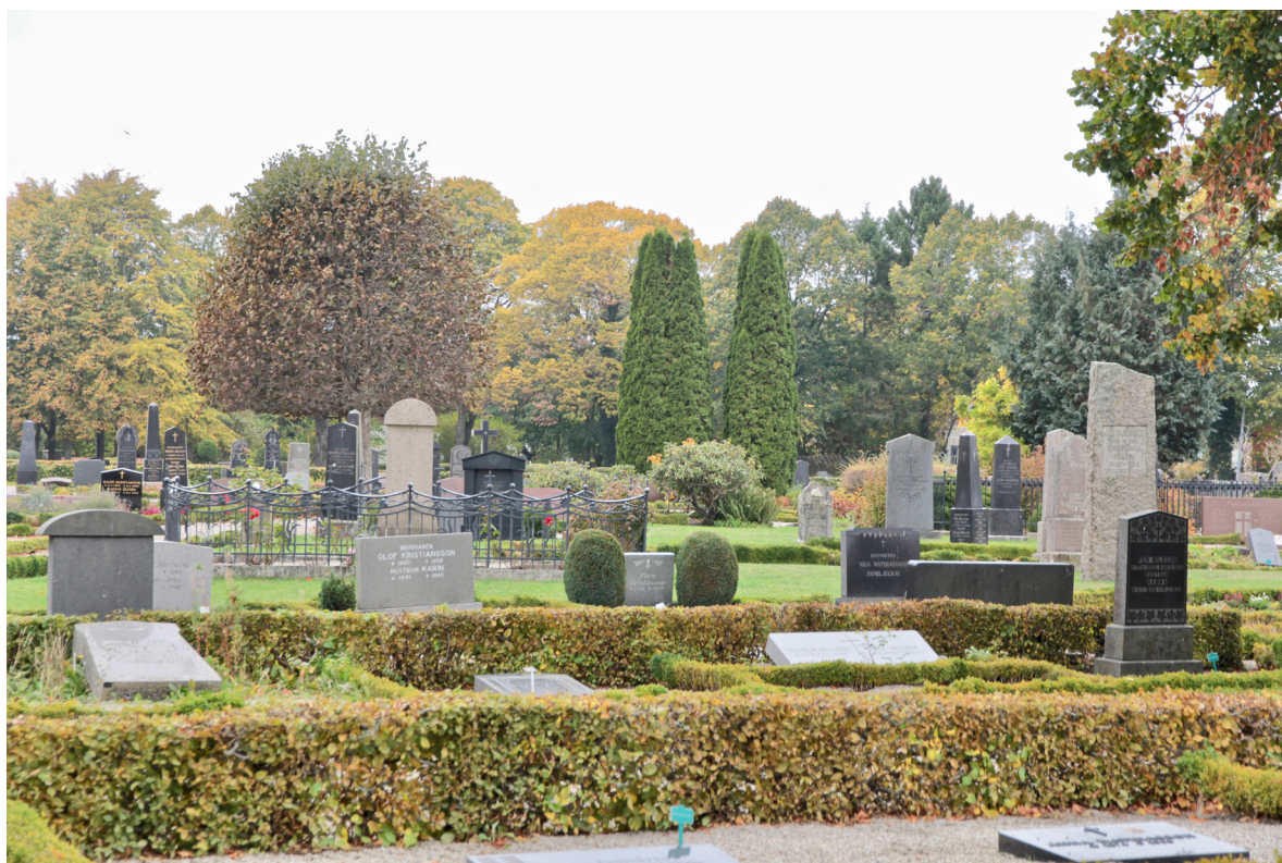
Vollsjo kyrkogårds äldsta delar närmast kyrkan präglas av högresta gravstenar i granit och diabas från decennierna kring sekelskiftet 1900.

Kyrkogården omgärdas av en ofullständig trädkrans av lindar av varierande ålder samt en bogårdsmur av natursten, delvis i bruk med tegel- eller betongavtäckning, delvis som kallmurad stödmur. I gränsen mot villatradgårdarna i nordväst växer buskar som