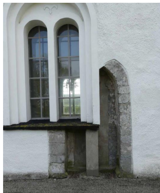
Nordportalen till långhuset och tornet sett från väster.

putsen och ljusare puts kring fönster och portaler. Under 1927 genomfördes en inre renovering av kyrkan. Några bänkar togs bort från långhuset, tegelgolvet kompletterades och värmekaminen renoverades. Utvändigt lades de spåntäckta taken om med korrugerad plåt. Kring 1934 lades golvet om med nya golvplattor, sannolikt gällde det mittgången i långhuset. Under 1942 gjordes en undersökning av grundläggningen till kyrkan. Arkitekt Eiler Graebe ledde undersökningen. Från detta år finns fotografier från en utgrävning inne i kyrkan framför altarringen i korsmitten. Sannolikt påträffade man det gamla korets och absidens grundmurar.