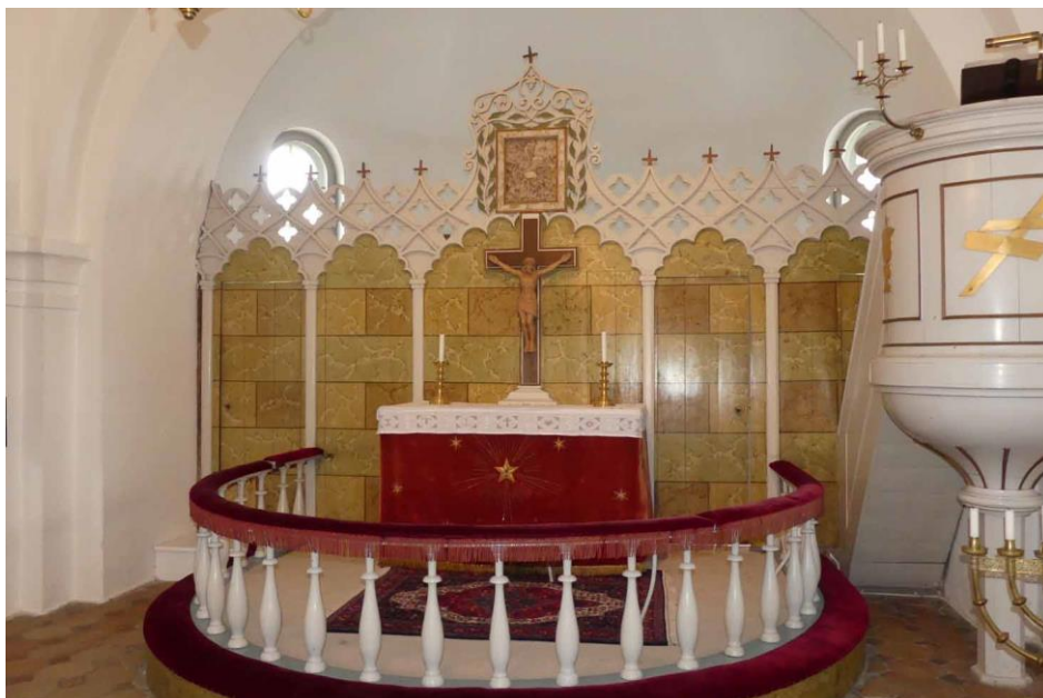
Koret med korskränket, altare, altarring och predikstol har tillkommit vid nybyggnaden av koret 1860.

når upp över korskränket finns genombrutna växtslingor av trä. Träramen är målad i samma vita färg som korskränket. Alabastertavlan är sannolikt ett senare tillägg till korskränket då ramen inte är integrerad i korskränket utan monterad ovanpå denna.