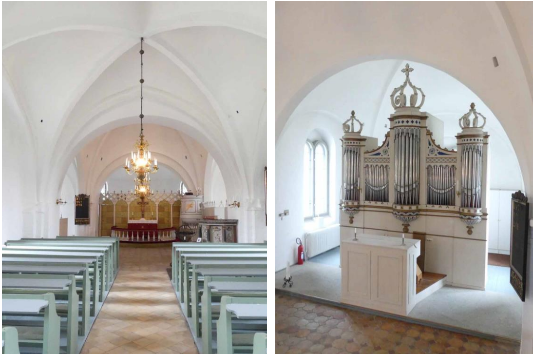
Kyrkorummet sett från långhuset i väster och orgeln i norra korsarmen.

Yttertaken består av sadeltak över tvärskepp och långhus täckta av rött enkupigt tegel på undertak av brädor. På absiden och koret ligger ett gråmålat plåttak lagt i skivtäckning med förskjutna falsar på undertak av brädor. Tornets täcks av ett tålttak av plåt med samma läggningssätt som till koret. Överst kröns torntaket av ett järnkors och en kyrktupp.