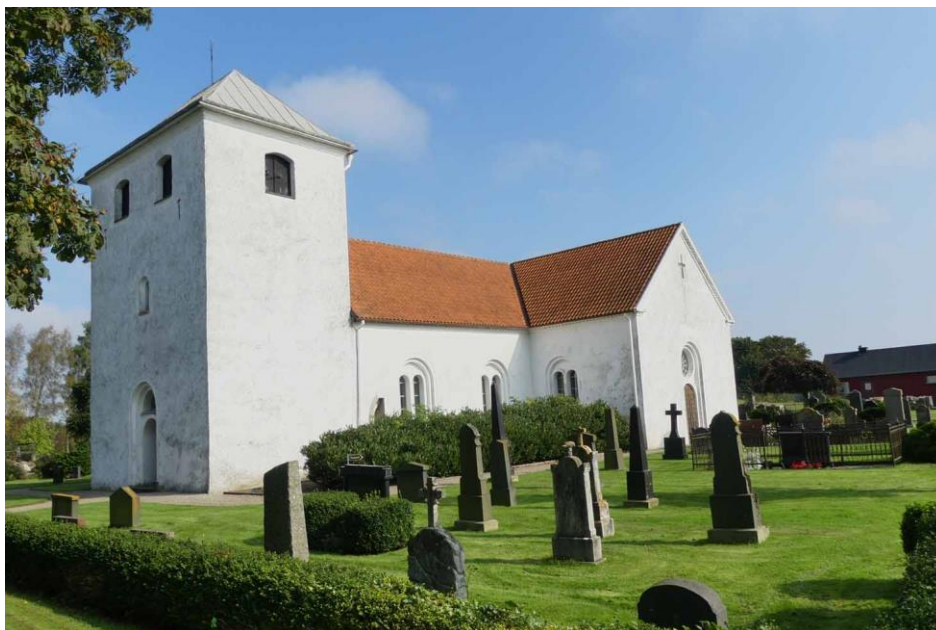
Kyrkan sedd från sydväst.