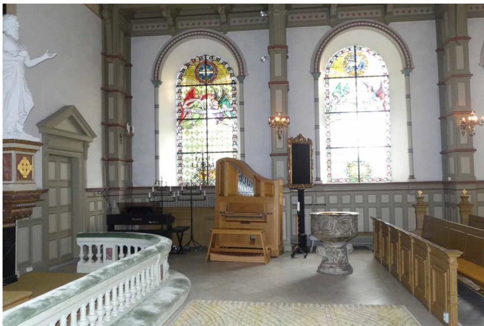
Koret sett mot söder.

Under sakristian finns en källare med gjutet bremervalv. I källaren finns värmepumpen till kyrkans värmeanläggning samt en äldre oljepanna.