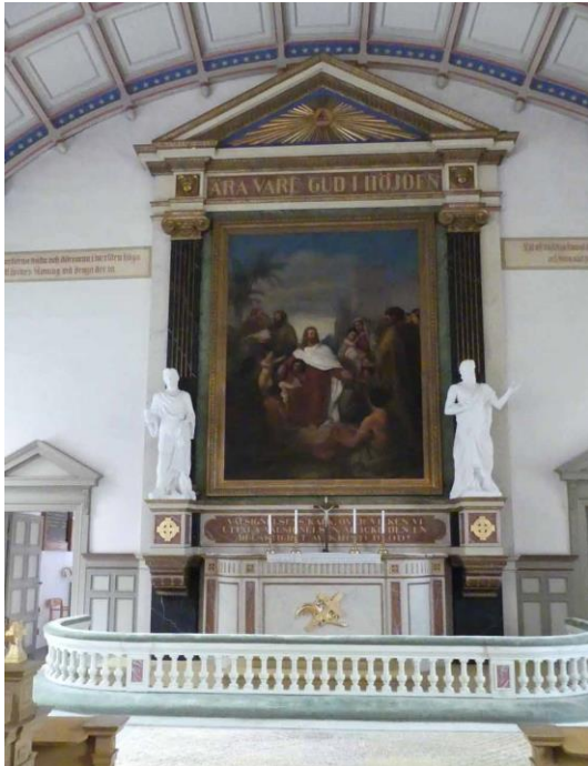
Altaruppställning i koret.

Kyrksalen är mycket stor och täcks av ett högt trätunnvalv uppburet av höga fristående träpelare vid sidorna. Mellan pelarna finns, längs med ytterväggarna, ett slätt innertak vilket bärs upp av pelarna och konsoler vid ytterväggarna. Valvet har korgbågig form och dess undersida är indelat i kvadratiska kassetter målade i vitt, rött och grått. Valvets bärande träbågar, som utgår från konsoler vid pelarna, är målade i blått med gula stjärnor på sidorna. Pelarna är indelade med fyllningar mellan horisontella gesimser och målade i ljus grågröna toner.