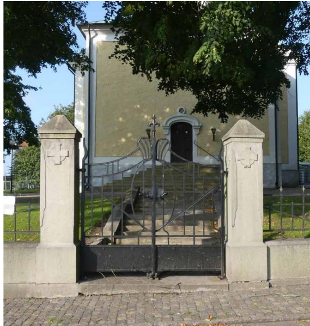
Kyrkan från väster och öster.