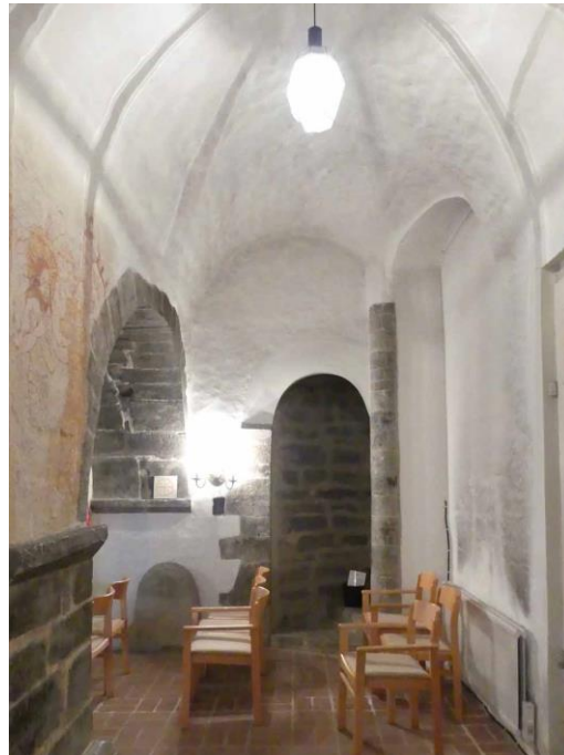
Till vänster: Långhuset sett mot väster och tornbågarna med dopfunten intill mittpelaren. Till höger: Tornets bottenvåning som tidigare fungerat som dopkapell.