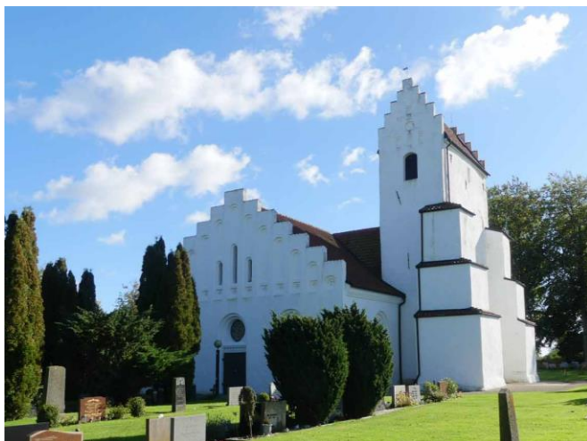
Kyrkan från norr.

fönsteröppning. Ingångarna i korsarmarnas gavelsidor har rundbågig omfattning kring en raksluten dörr med ett runt överljusfönster med blommonstrat spröjsverk. Mellan dörr och överljusfönster finns ett tandsnittslisterverk. Ytterdörrarna är pardörrar klädda med liggande grönmålad pärlspontspanel. En likadan ytterdörr finns till tornet.