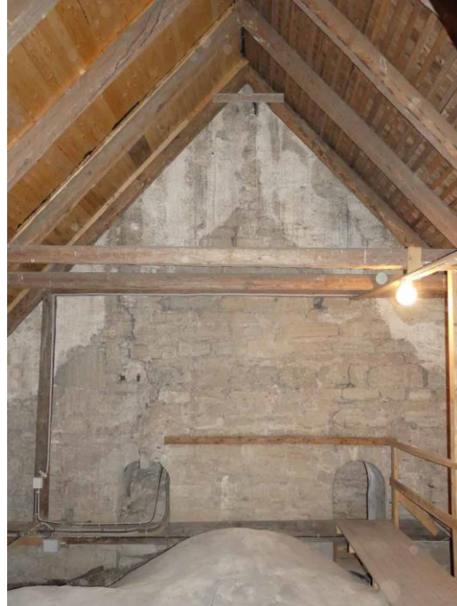
Vy över norra korsarmen från söder samt tornets emporöppningar sedda från långhusvinden.

tak av brädor är av sentida grönimpregnerat virke och valvets ovansida och absidmurarna är inte synliga.