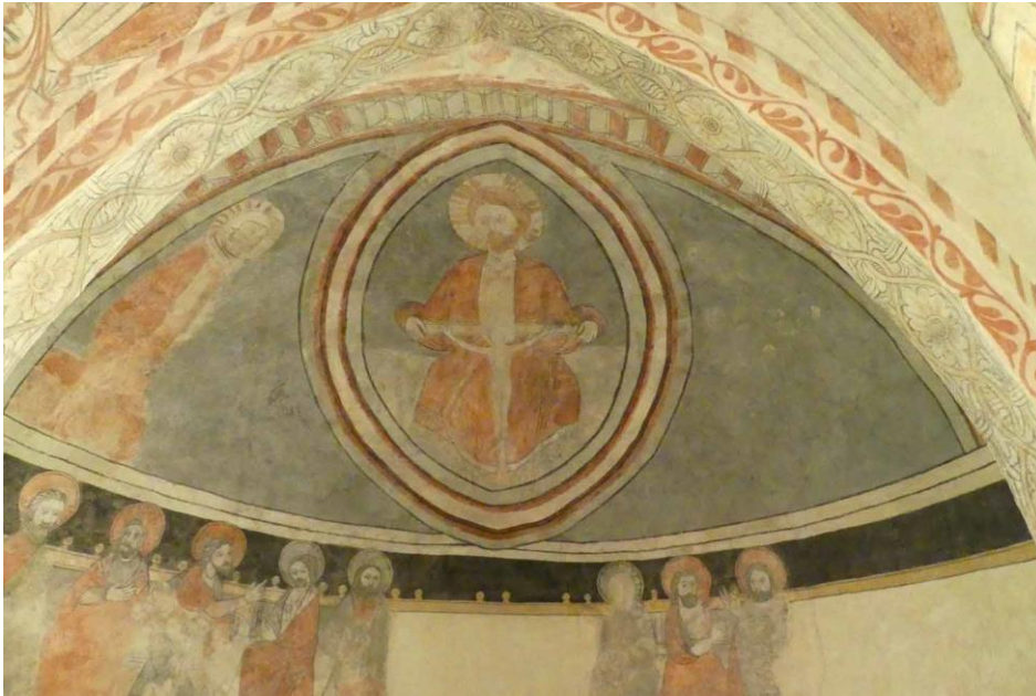
Absidens målningar från sen romansk tid eller tidig gotisk tid. . Majestas Domini i absidens mitt har senare målats om till Nådstolen genom komplettering med ett krucifix.