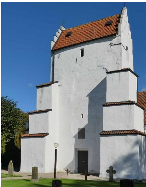
Kyrkans torn sett från sydväst.

fattighus. Söder om skolan från 1902 ligger en äldre skola vilken under en period fungerat som församlingshem. Byggnaden ägs numera av byalaget och prästgården söder om kyrkogården är privatbostad.