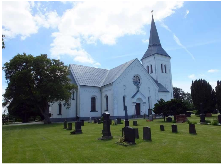
Bilden till vänster visar kyrkans huvudentré i tornet. På högra bilden syns kyrkan sedd från norr.