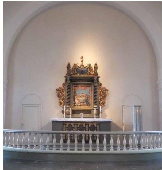
Kyrkorummet sett mot öster och koret där den gamla kyrkans altaruppsats står.