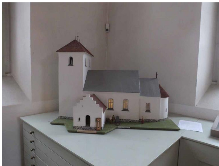
Södra Mellbys medeltida kyrka vilken revs 1887.

Den medeltida kyrkan revs på 1800-talet och en ny kyrka byggdes något nordväst om den gamla kyrkogården. Av den gamla kyrkans murar finns inget bevarat idag ovan mark. Före rivningen dokumenterades kyrkan av domkyrkoarkitekt Carl Georg Brunius och folklivsforskaren Nils Månsson Mandelgren. Kyrkan hade ett tvåskeppigt långhus, ett lägre och smalare kor med absid och ett västtorn med rektangulär planform och samma bredd som långhuset. Kyrkans murar var uppbyggda av sandsten och långhuset var indelat med sex korsvalv med tre åttkantiga pelare i mitten. Västtornet