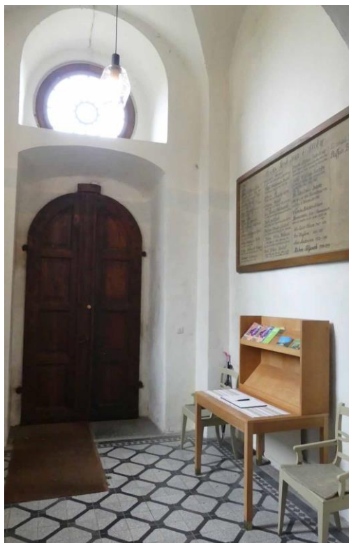
Kyrkorummet sett mot orgelläktaren i väster samt vapenhuset i tornets bottenvåning.

terrazzoplattor i svart och grått rutnätsmönster med en kantbård i form av mindre rutor. Från vapenhuset leder en stickbågig dörröppning in till kyrkorummet genom den tjocka tornmuren. Dörren består av spegeldörrar av omålade fur med ett glasparti i den övre fyllningen. Den första delen av kyrkorummet utgörs av inbyggnader under läktaren. Längst i väster finns ett wc och en trappa till läktaren utförd 1968 med väggar av gråmålad träpanel. Öster om dessa ligger inbyggnader för samlingsrum och pentry år 2007 med väggar av oljad ekpanel mellan läktarens pelare. Pelarna är ekådrade med fyrkantig genomskärning, hög sockel och fint profilerade kapitäl. Invändigt är väggarna vitmålade med glasade öppningar mot kyrkorummet i öster. Mellan 1968 års och 2007 års inbyggnader och finns ett dörrparti med ekimiterande spegeldörrar från 2007.