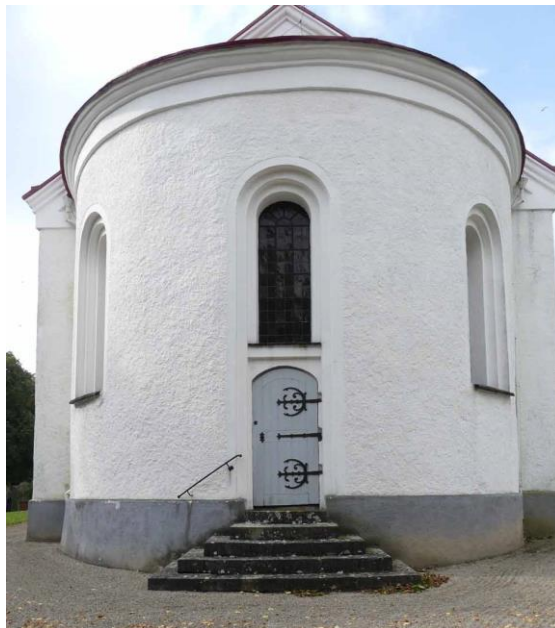
Kyrkans torn och absid sedda från öster.

läktaren av orgelfirman Johannes Künkel. Efter en misslyckad yttre putsrenovering 1980 putsades tornets om mellan 1983-1984. Omputsningen skedde med KC-bruk och silikatfärg. Fasaderna renoverades återigen under 1991 då de målades delvis med kalkfärg och delvis med silikatfärg. Nytt plåttak lades samtidigt på tornet. År 2000 gjordes nästa yttre putsrenovering samtidigt som nytt värmesystem installerades i kyrkan. Lagom till kyrkans 150-årsjubileum 2007 gjordes en invändig renovering av kyrkan efter handlingar av Barup & Edström arkitektkontor AB. Utrymmena under läktaren inreddes till fikarum med pentry och samlingsrum. Wc och städutrymmen byggdes om och terrazzogolvet i kyrkan renoverades.