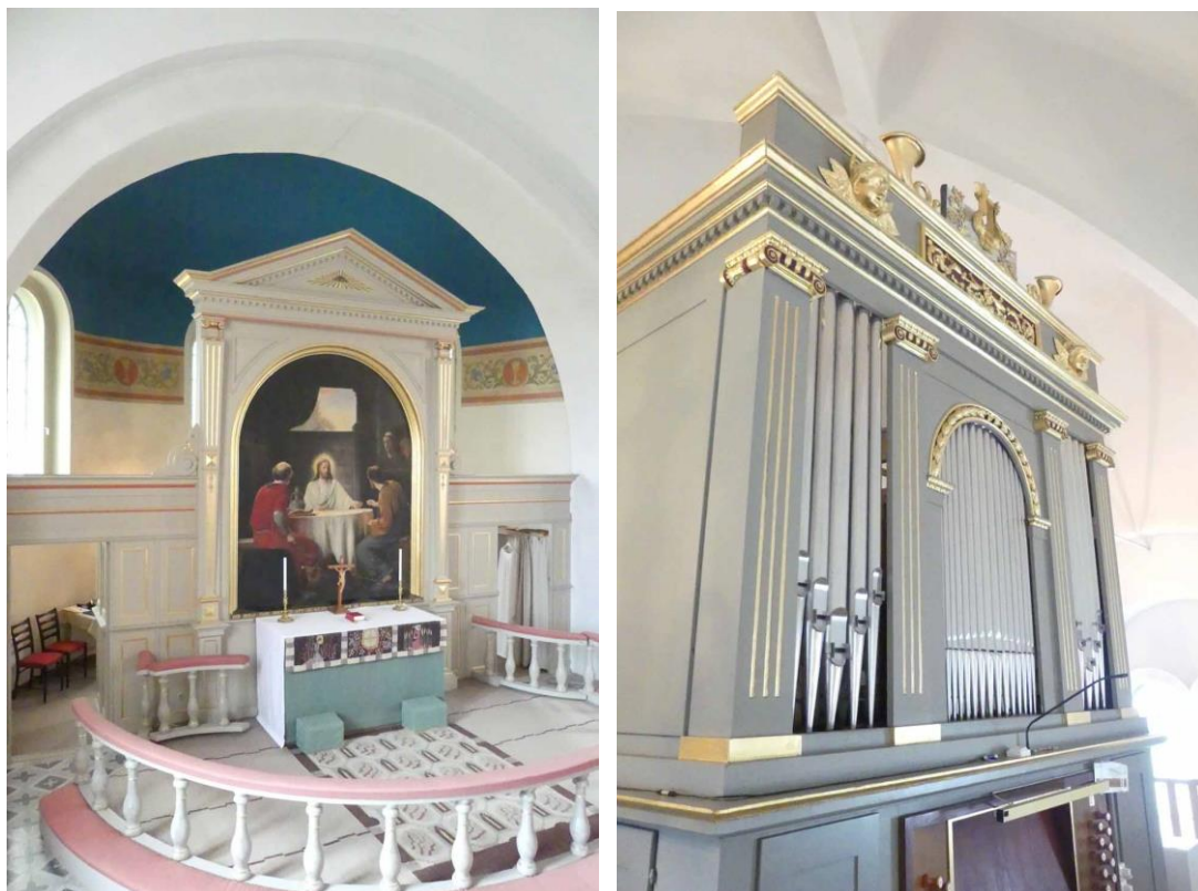
Kyrkans kor sett från predikstolen och orgelfasaden från 1835.

klockor i en klockstol av ek. Klockstolen kan vara samtida med den nuvarande kyrkan. Taklaget över tornet förefaller vara av furu eller gran bestående av sparrar, hanband och snedsträvor samt bindbjälkar. Taklag över långhuset är av furu och gran och består av takstolar med sparrar och en nivå hanband och stödben och strävor på stickbjälkar vid murkrönet.