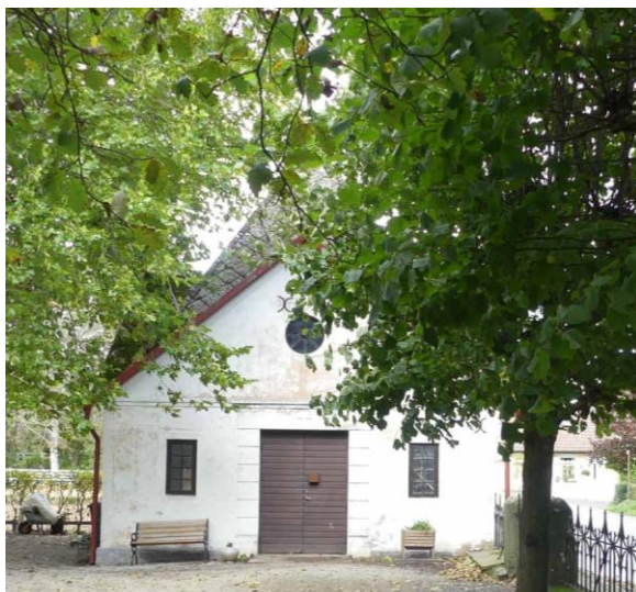
Bårhus vid kyrkogårdens nordöstra hörn.

utan staket finns längs den norra sidan som också kantas av en träd-rad av oxel. I kyrkogårdens nord-östra hörn ligger ett gravkapell intill en stor platan. Väster om kapellet finns en minneslund i form av en gräsmatta med u-format gångstråk och en plantering i ytterkanterna. Gravplatserna i gamla kyrkogårdsdelen har traditionell utformning, ordnade i rader från norr till söder och kringgårdade med buxbom. Gravplatserna är förhållandevis stora norr och söder om kyrkan medan området väster om kyrkan