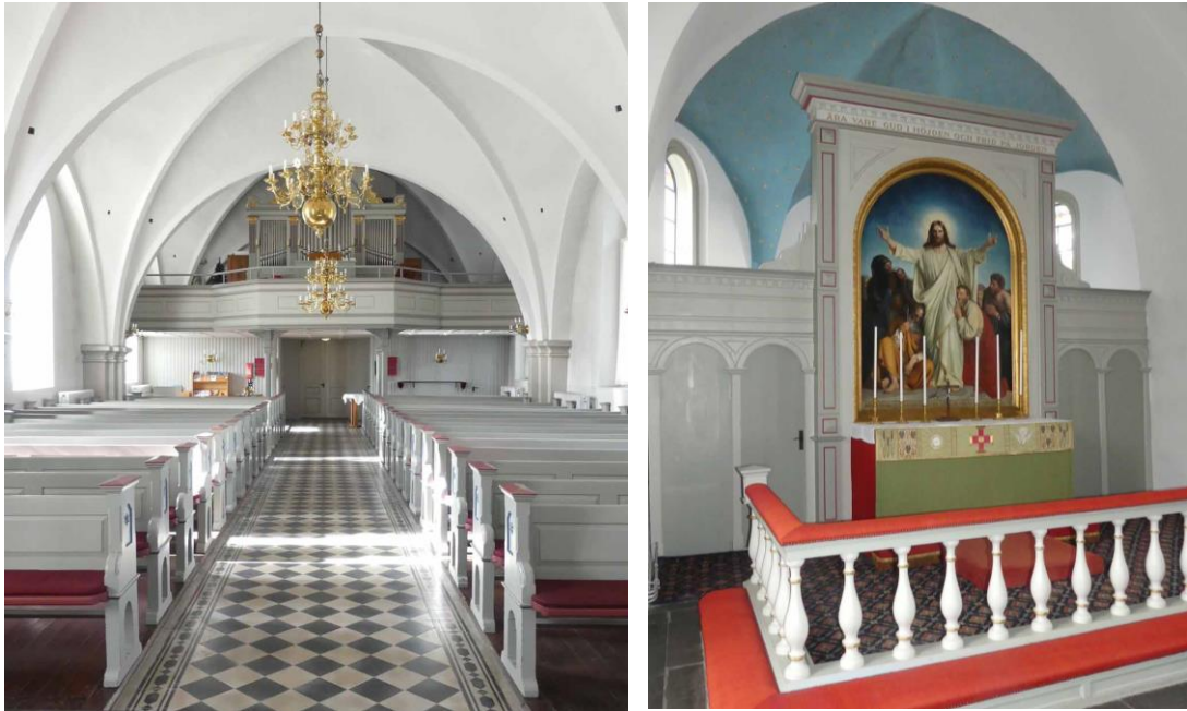
Långhuset sett från öster mot orgelläktaren och till böger altaruppställningen i koret.

ett bibelord och ett listverk. Trappan till predikstolen är från 1894 och gråmålad med spegelindelad vangstycke och räcke av kolonettformade ståndare.