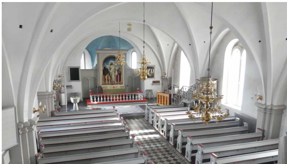
Kyrkorummet sett mot koret i öster.

Koret som ligger under kyrkorummets fjärde valvtravé har samma bredd som långhuset men har ett högre beläget golv av kalkstensplattor. I korets norra del står dopfunten och predikstolen är belägen i bänkkvarterets sydöstra del med trappuppgång från koret. Altaruppställningen med altare, altartavla och altarring står mitt i en vid rundbågsöppning mellan koret och sakristian. Bågöppningen är nedtill avskärmad med ett korskrank av trä på ömse sidor om den höga altartavlan. Valvet över sakristian består av tre ribblösa valvkappor målade som en stjärnhimmel i klarblått med fastspikade gyllene stjärnor av mässing. Genom bågöppningens övre del är sakristians takvalv synligt från långhuset och bildar en fond mot altare och altartavlan.