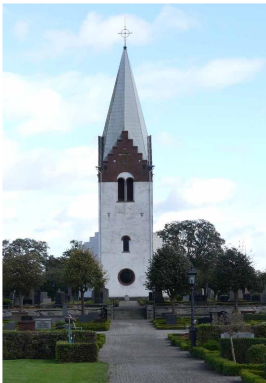
Kyrkan från väster.