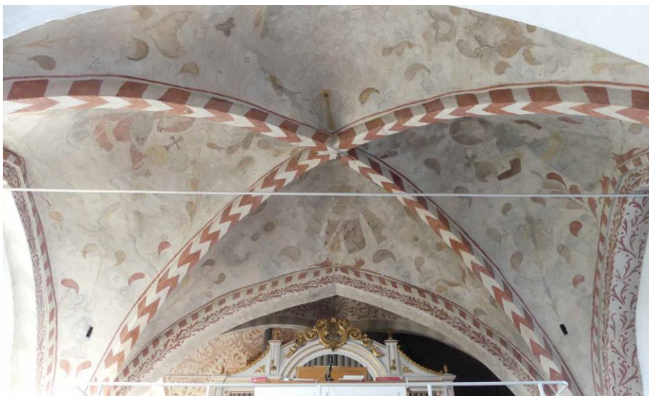
Rester av medeltida kalkmålningar i kyrkans västra valvtravéer.

trappa leder upp till läktaren vid södra sidan av mittgången. Vid norra sidan finns en inbyggnad för elcentral och förråd. Valvpelarna i detta hörn har en bevarad äldre målning i beige färgton med rester av marmorering och en brunmålad smal bård. Långhuset är i övrigt möblerat i två bänkkvarter längs sidorna om mittgången. Bänkkvarteren sträcker sig fram till korsmitten västra gräns.