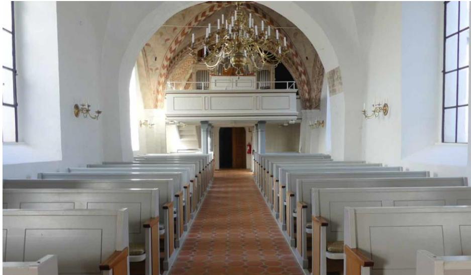
Långhuset sett från korsmitten med 1500-talets valvtravé närmast och den medeltida långhusdelen i fonden.

har samma konstruktion som övriga delar men är lägre och sammanbyggt med långhustaket. Tornet täcks av ett pyramidformat tak nedtill vilket övergår i en åttkantig, spetsig spira krönt av ett kors på en kraftig kula.