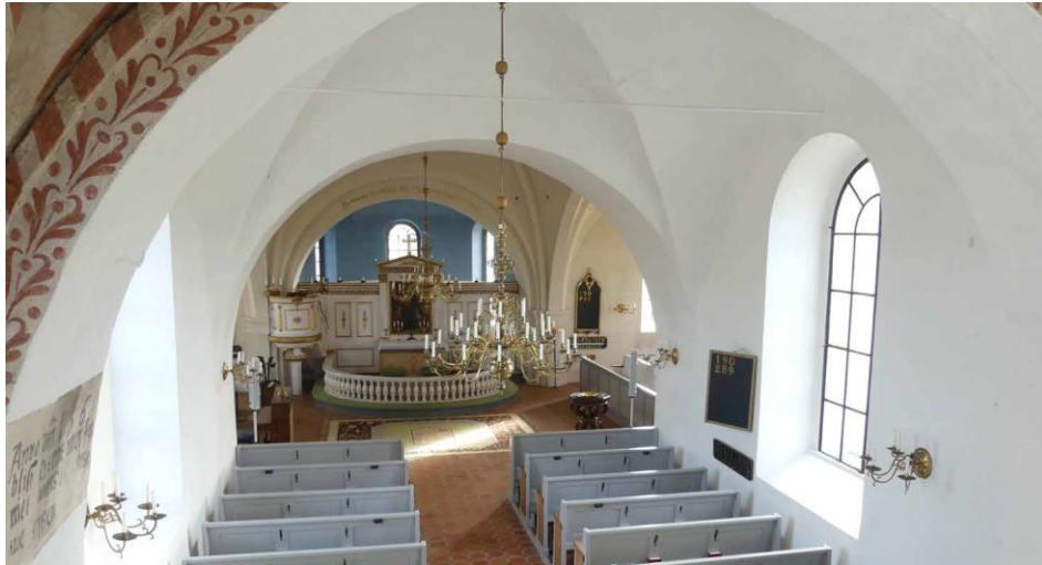
Långhuset sett mot öster.

Mellan långhusets äldsta del och 1500-talsdelen finns en bred valvbåge. Den ursprungliga triumfbågen till det romanska koret är inte bevarad. I valvbågens norra sida finns en inskription som anger att valvbågen byggdes om 1560: Anno d(omi)ni 1560/blifu(e) denne mur for/niet...(t)utores ole ..lnisen/ue. Jensen. Valvet i långhusets 1500-talsdel utgår från yttermurarna utan valvpilastrar eller konsoler. Valvet är slaget utan ribbor och valvkapporna möts i en spetsig vinkel vilken överst i valvkrönet övergår i fyrsidig ribbform. Under golvet i den tredje valvtravéen, ska det Ulftandska gravvalvet ligga. En trappnedgång har lett ned till gravvalvet från väster.