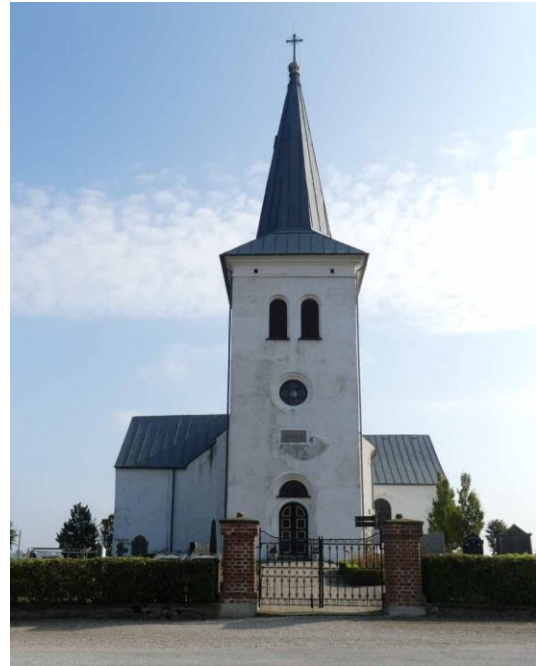
Gravkoret på långhusets norra sida och kyrkan sedd från väster.