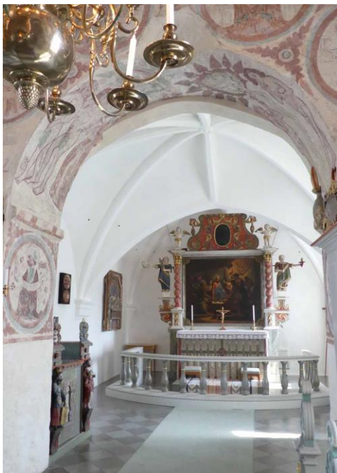
Koret och triumfbågen sett från långhuset.

tympanonsten. Från vapenhusvinden finns vidare ingång till långhusets och korets vind via en stege över murkrönet.