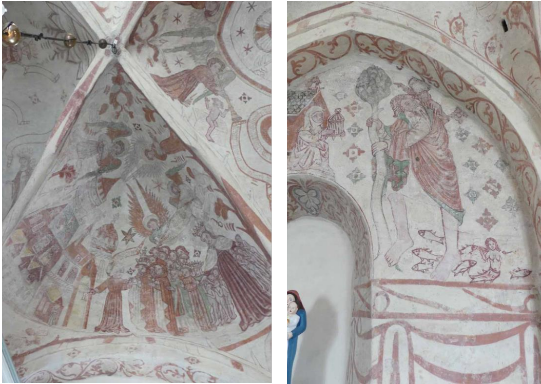
Kalkmålningar föreställande de saliga i västra valvtravén och sankt Kristoffer i andra valvtravén.