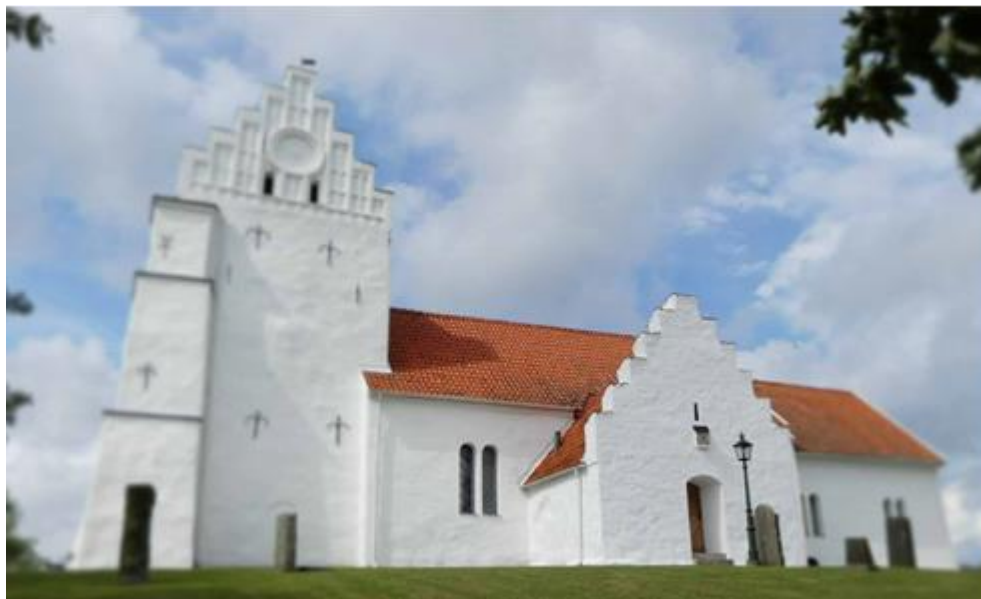
Kyrkan sett från söder.