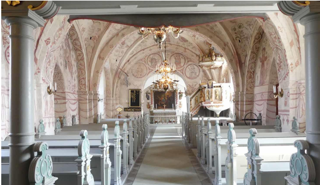
Kyrkorummet sett från väster.

utgår från profilerade konsoler i yttermurarna, utan pilastrar och sköldbågar. Gördelbågen mellan valven har en flack form och ribborna möts i en rund knopp i valvkrönet.