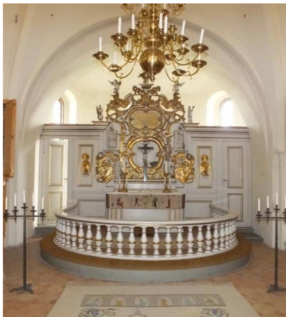
Koret i form av altaruppställning är beläget i korsmitten. Långhuset upptas av en bänkinredning.

takfoten, och en hög spetsig spira som avslutas av ett krönkors i järnsmede. Taklaget över kyrkans lågdelar är av bilad fur från 1869. Inslag av äldre virke finns på långhusvinden i form av inmurade romanska/ursprungliga bjälkar. Tornets bjälklag består av både ek och fur sannolikt av både äldre och nyare delar från 1700-talet och framåt.