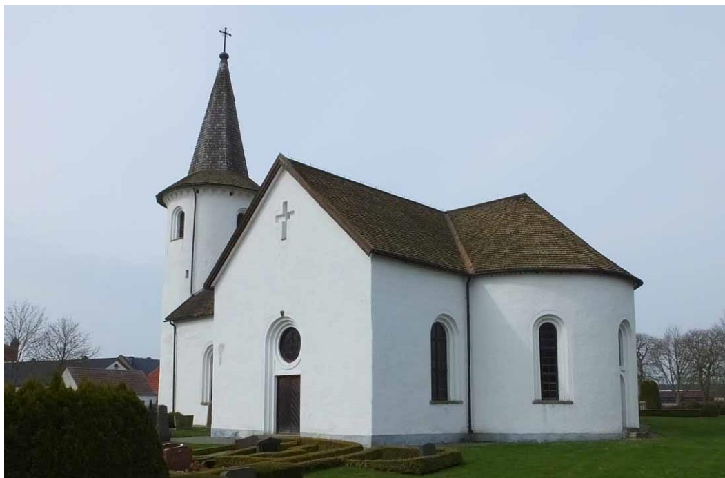
Kyrkan sedd från sydost.

På 1700-talet såg Bollerups by mycket annorlunda ut. Själva bybebyggelsen bestod av drygt 25 gårdar som låg i en klunga söder om vallgraven och en liten damm, Bydammen. Intill bäcken öster om borgen och vallgraven låg kvarnbostället och kvarndammen. Sydväst om borgen fanns en smedja vid Smedjedammen och norr om borgholmen var säteriets gårdsbyggnader placerade. Väster om vallgraven fanns ytterligare en damm; Kosjön. När Bollerups by skiftades upprättades ett farmsystem med arbetarbostäder i form av mindre gårdar längs vägen söder om Bollerup. Den gamla byn, bydammen och kvarnen finns inte kvar längre. På 1870-talet inrättades Bollerup till lantbruksinstitut med ny huvudlänga i klassicerande stil och nya ladugårdslängor. Gårdslängorna från 1800-talet och senare samt borgen dominerar Bollerup idag. Kyrkan är omgiven av hagmarker i norr, öster och söder medan lantbruksinstitutet ligger alldeles inpå kyrkogården vid dess västra sida.