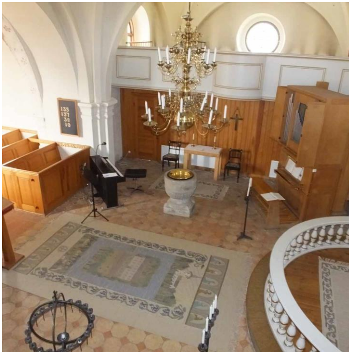
Korsmitten sedd från läktaren i södra korsarmen.