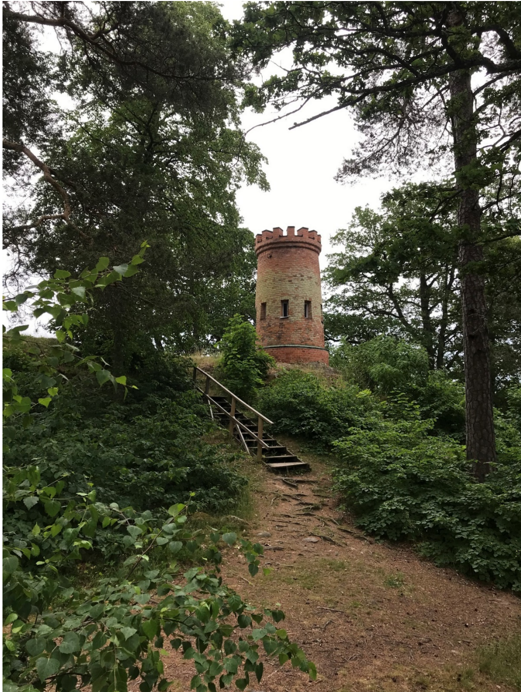
Solkanontornet från norr. Foto 2021.