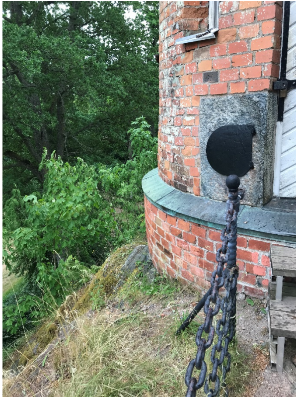
Solkanontornet, Lucka och öppning för kanonröret. Foto 2021.