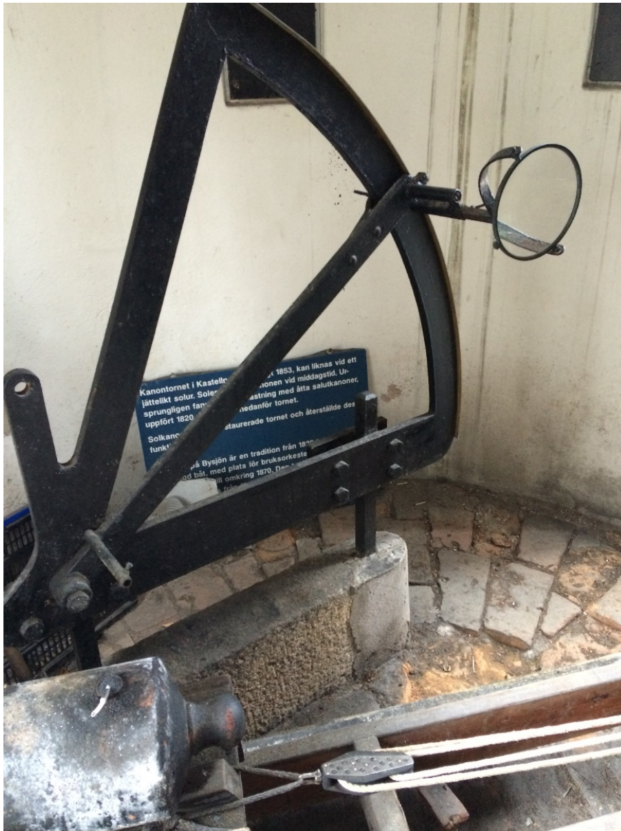
Solkanontornet. Bränningsglas och gradskiva för kanonskjutning. Del av kanonen syns i nedre vänstra hörnet av bilden. Foto 2017.