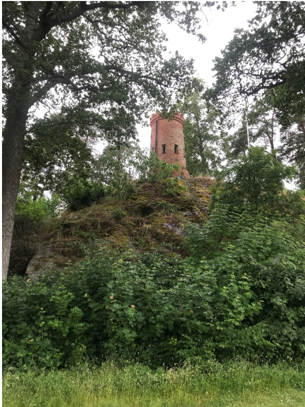
Solkanontornet från öster. Foto 2021.