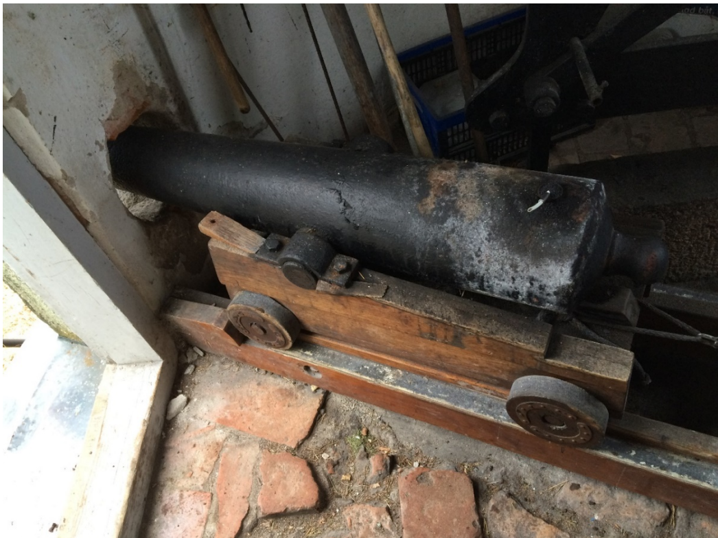
Solkanontornet, kanonen. Foto 2017.