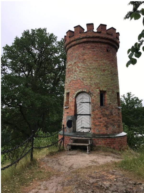
Solkanontornet ingångssidan. Foto 2021