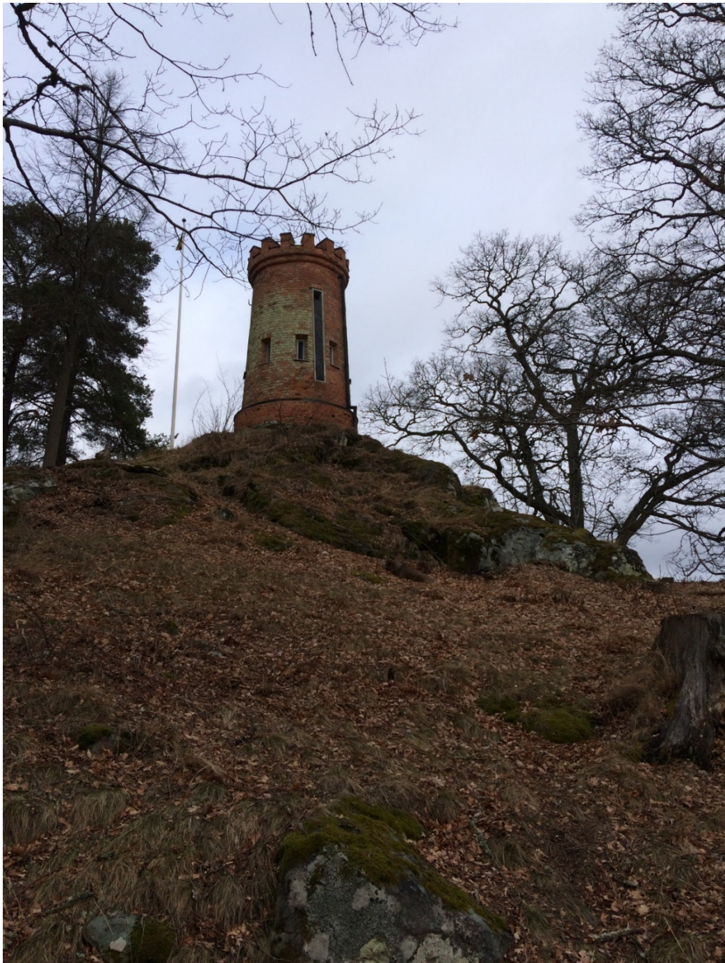
Solkanontornet från söder med den långsmala öppningen för solinläpp. Foto 2017.