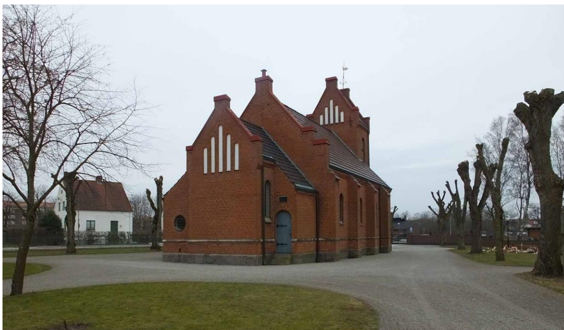
Tomelilla kyrka från öster.