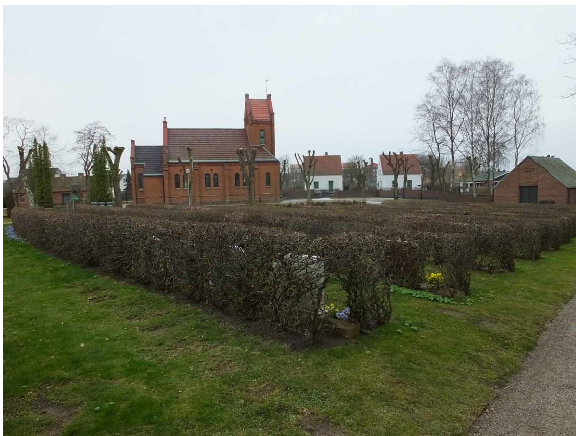
Askgravlundan på kyrkogårdens senare utvidgning planlagd av Eiler Graebe. I fonden till höger syns gravkapellet ritat av samme arkitekt.

En personalbyggnad uppfördes 2015 i kyrkogårdens norra hörn. Byggnaden har fasader av rött tegel och flackt sedumtäcktt yttertak med utskjutande takfot. Vid entrén i östra sidan finns en handikappanpassad toalett med entré från kyrkogården. Intill södra sidan av den nya personalbyggnaden ligger ett bårhus ritat 1968 av Eiler Graebe. Bårhuset är uppbyggt av mörkbrunt tegel med skiffertäckt sadeltak. Vindskivor och takplåt är av koppar medan hängrännor och stuprör är bytta till brun plåt. Ytterporten består av en kopparbeslagen pardörr. Fönsteröppningarna till bårhuset är långsmala och består av blyinfattat med råglas.