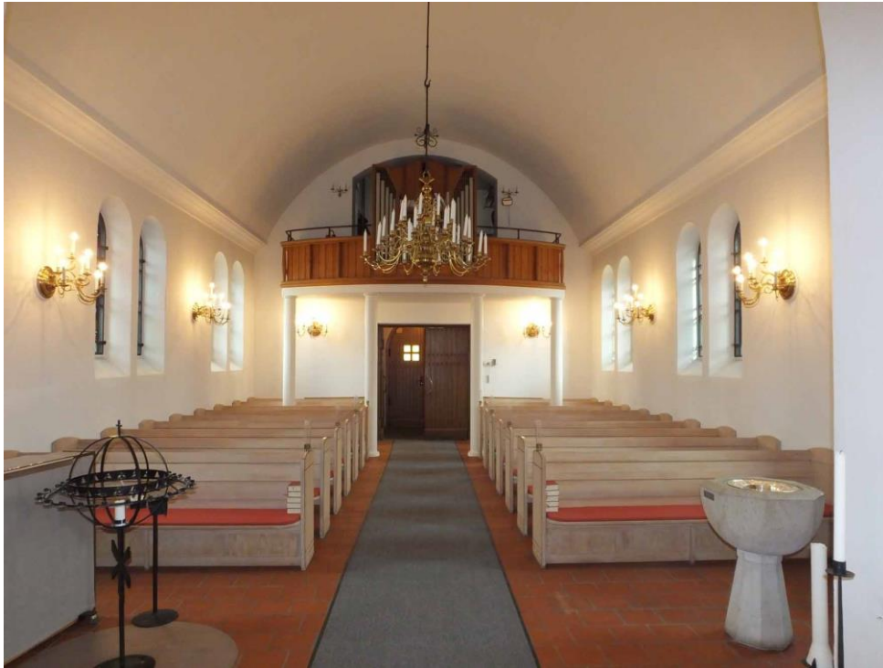
Kyrkorummet sett från koret mot läktaren och ingången till kyrkan.