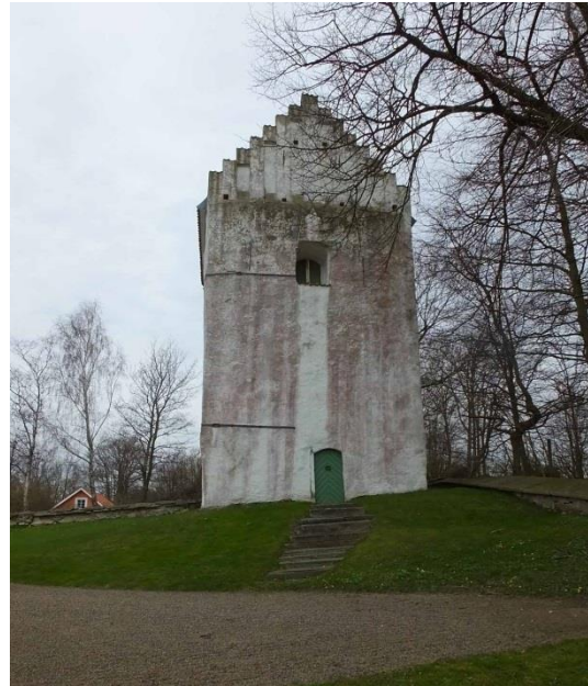
Kyrkans entré i väster samt kastalen från söder.

trä med spröjsade, kvadratiska glas. Den västra portalöppningen har en spetsbågig omfattning murad med tre språng. En trappa av kalkstenshällar leder upp till ytterporten som är en grön pardörr med spegelfyllningar. Över dörren, i valvspetsen, finns ett masverksliknande träpanel med trepassdekor. Möjligen ersätter denna ett äldre överljusfönster utfört i samma stil. Prästingången är murad utan språng. Dörren är klädd med grönmålad pärlspont och dess överljusfönster har spetsbågeformade spröjsar.