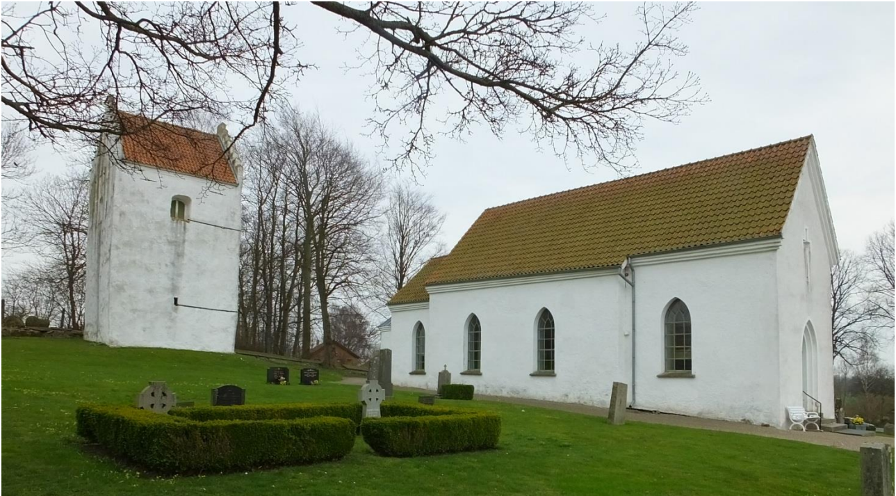
Benestads kyrka och kastal från nordväst.