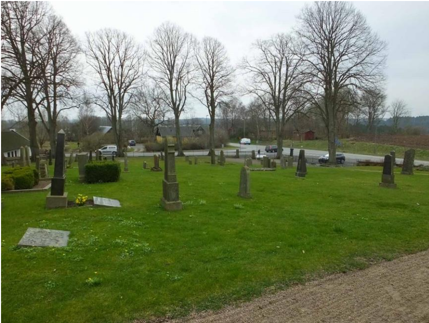
Kyrkogården sedd från nordost.