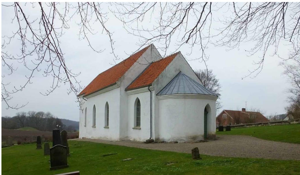
Kyrkan från sydost.

Nordost om kyrkan står ett fristående torn, en så kallad kastal som idag inrymmer kyrkans klockor. Kastalen byggdes under senmedeltiden, omkring 1400-1500-talet, med stickbågiga öppningar och tre våningsplan. År 1903 muras kastalens södra gavel om med nytt tegel. En utvändig renovering av kastalen gjordes 2004. Senaste invändiga renovering skedde 2008 då ett nytt golv gjordes vid altaret, några bänkar i väster byggdes om till liggande förvaring på vänster sida och på höger sida gjorde man förråd. Väggarna från vapenhuset och upp till orgelläktaren målades också om.