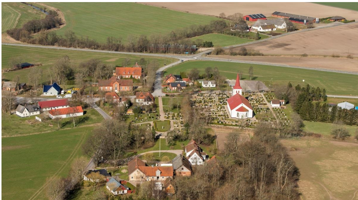
Flygfoto över Tryde by från öster, 2015.