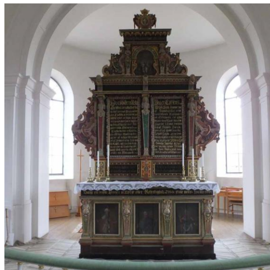
Kyrkorummet sett från orgelläktaren mot öster samt kyrkans altare och altarpopsats från tidigt 1600-tal.

Koret består av långhusets östra del där altarplatsen markeras av altarringen. Altaret och altarpopsatsen står väster om valvöppningen till absiden/sakristian. I sydöstra hörnet är golvet förhöjt med två steg till ett dopkapell där kyrkans medeltida dopfunt står. Ett litet putsat och vitmålat dopaltare med stenskiva står längs södra väggen och i dopkapellet finns också en kopia av Thorvalsens Kristusskulptur. I långhusets nordöstra del står predikstolen och intill norra bänkkvarterets östra gräns en mindre kororgel. Långhusets västra del upptas av en läktare för orgeln med trappuppgångar längs med västra väggen på var sida om mittgången. Läktaren bärs upp av två rader pelare av trä utmed mittgången. Pelarna är gråmålade och har fasade hörn och är profilerade med sockel och kapitäl. Under läktaren finns sedan 1970 inbyggnader för samlingsrum/väntrum och förråd samt wc. Inbyggnaderna är utförda med gråmålad spontad träpanel. Innertaken i inbyggnaderna är av vitmålade brädpanel, väggarna är vitmålade och golvet är lagt med rött murtegel.