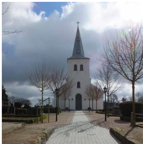
Tryde kyrka sett från söder och från väster.

År 1955 restaurerades kyrkans altaruppsats, altare och predikstol av konservator Oswald Oswald. Under 1960-talet utfördes flera inre åtgärder. År 1962 utfördes en renovering under ledning av arkitekt Eiler Graebe. Korskranket togs bort, korbågen gjordes smalare och altarringen flyttades fram. Ny inredning i form av altare och skåp tillverkades till sakristian. År 1967 kompletterades väst- och sydportalen med innerdörrar och de gamla ytterdörrarna byttes ut. Vapenhusets golv renoverades och innertaket gjordes om. Arkitekt i samband med åtgärderna var Aina Berggren. Några år senare, 1970, genomfördes en inre renovering under ledning av arkitekt Torsten Leon-Nilson. Koret utvidgades mot väster, och utrymmen under läktaren inreddes till vänt- rum/samlingsrum samt förråd och wc. En ny bänkinredning tillverkades också. Invändigt skedde en mindre renovering 1986 då väggar och tak tvättades och bänkar samt pelare målades om i ljus grön kulör. Kyrkans fönster kompletterades med innerfönster 1988 ritade av arkitektkontoret Barup & Edström. En del utvändiga åtgärder utfördes år 2001 då en storm orsakat skador på taket. Åtgärderna omfattade nya stuprör, lagning och ommålning av plåttaket, puts- lagning samt ommålning av fönster och dörrar. 2015 utfördes en utvändig renovering då samtliga yttertak lades om med reinzink på ny papp och läktning, nya stuprör och hängrännor monterades samt putsrenovering och utvändig målning utfördes.