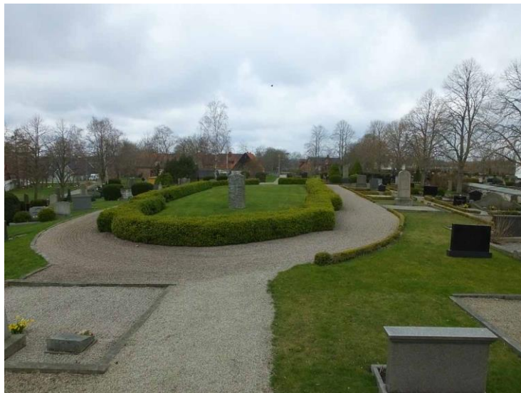
Bårhus i norra delen av nya kyrkogården samt gamla kyrkogården med den medeltida kyrkans grundplan markerad av en buxbomshäck.

I kyrkan har också funnits en träskulptur av S:ta Anna (motivet kallas Anna-själv-tredje) skulptur i trä. Detta har karaktär av ett inhemskt arbete och kan ha ingått i ett altarskåp. Den kan dateras till kring 1400-talets andra hälft eller slut. Skulpturen förvaras numera på historiska museet i Stockholm. På historiska museet förvaras också de bevarade delarna av en relikgömma som återfanns vid en flyttning av den medeltida kyrkans högaltare på 1700-talet.