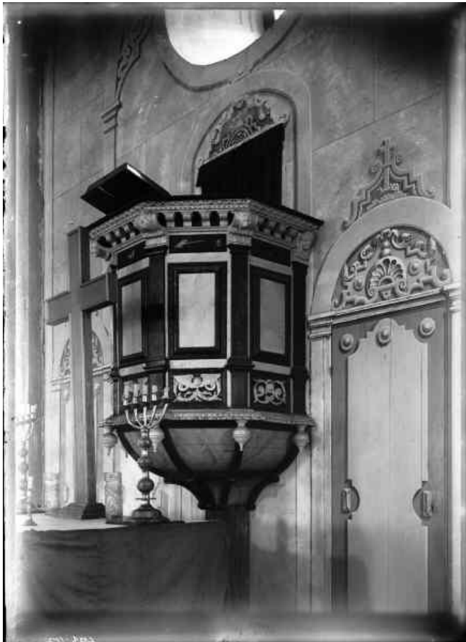
Kyrkans interiör mot norr. Foto: Torsten Mårtensson, 1919. Bilden är hämtad från Riksantikvarieämbetets bilddatabas Kulturmiljöbild.