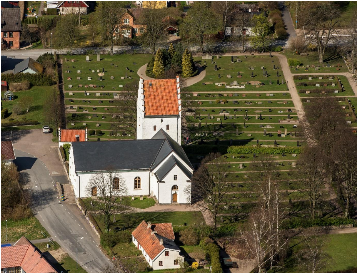
Flygbild över Degeberga kyrkoanläggning från öster. Foto: Pär-Martin Hedberg, 2014.

Den äldre kyrkogården ligger väster, öster och norr om kyrkobyggnaden. Marken närmast kyrkobyggnaden är belagd med singel.