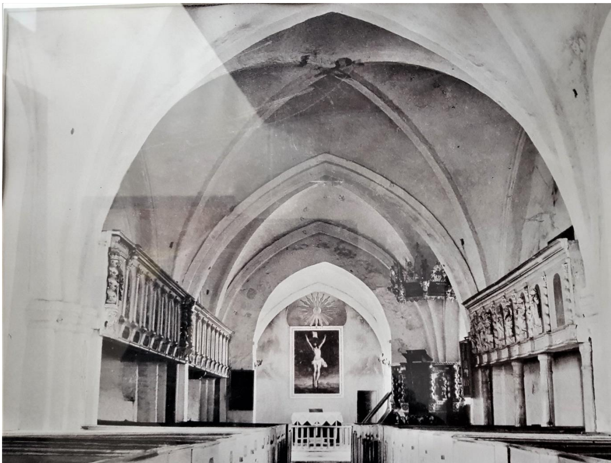
Kyrkans interiör mot öster före den omfattande renoveringen 1899–1900. Foto i kyrkan.