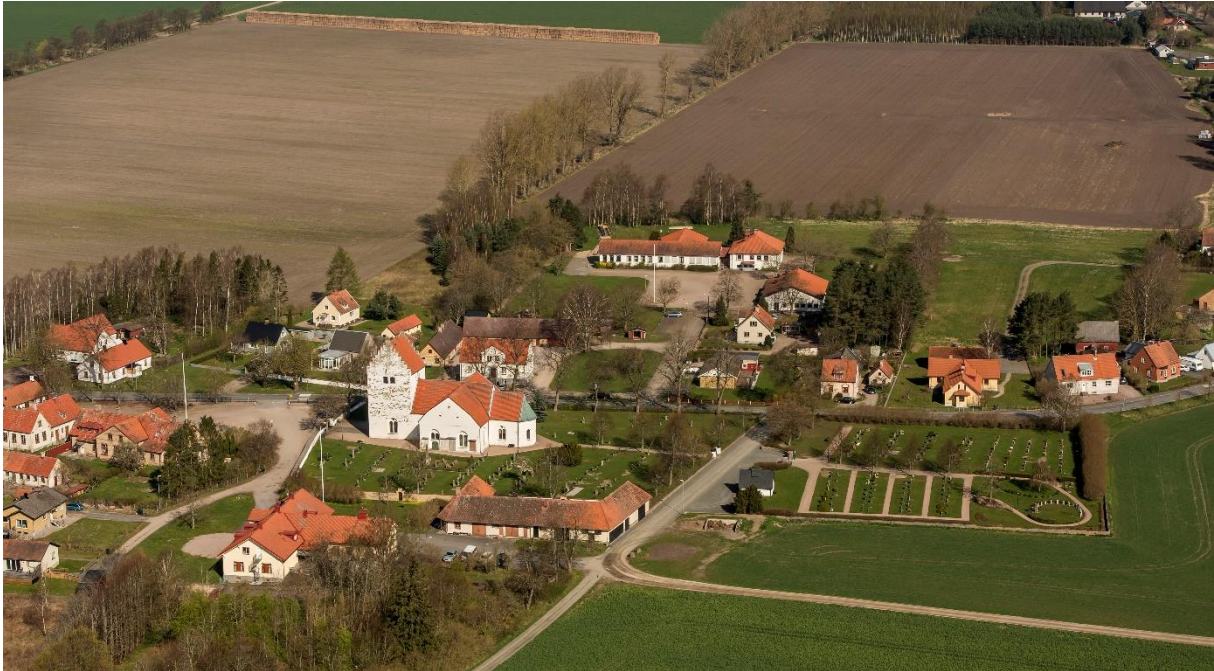
Flygbild över Vittskövle kyrkoanläggning med den nuvarande skolbyggnaden i fonden och öster om den platsen för den medeltida borgen, Gamlegård. Foto: Pär-Martin Hedberg, 2014.

Kyrkoanläggningen är belägen i Vittskövle bys västra del. Byn finns belagd i skriftliga dokument 1348. Väster om kyrkan finns en torgbildning med den före detta skolan och norr om landsvägen är sockenstugan och en skolbyggnad från 1950-talet belägna. Vittskövle kyrka ingår i område av riksintresse för kulturmiljövården med motivering att slottsmiljön utgör en av Nordens största tegelborgar från 1500-talet omgiven av en vallgrav och vidsträckt odlingsfält, bokskogar och långsträckt alléer.