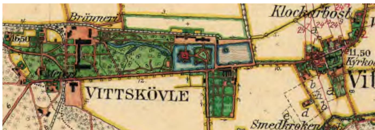
Utsnitt ur Häradsekonomska kartan 1926–34.

I byns nordöstra del, ca 100 m norr om kyrkan, finns även resterna av en borganläggning, Gamlegård, som varit en medeltida adels huvudgård och sannolikt föregångaren till Vittskövle gods. Vid arkeologiska utgrävningar, som utfördes 2003–2005, påträffades vallgravar, byggnadslämningar och lösfynd, som daterades till 1200–1300-tal. Det är oklart hur länge Vittskövle kyrka varit patronatskyrka, men sannolikt kan det föras tillbaka till medeltiden. Henrik Brahe hade dock patronatsrätt till Vittskövle, Degeberga och Sönnarslövs kyrkor från år 1568. Patronatsrätten till Östra Sönnarslöv kyrka övergick senare till Maltesholms gård. Patronatsrätten upphörde i samband med att den avskaffades 1922.