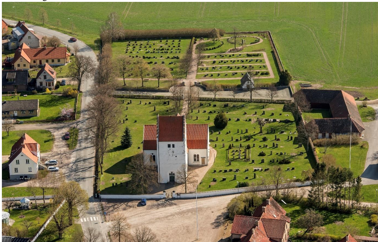
Flygbild över Vittskövle kyrkoanläggning från väster. Foto: Pär-Martin Hedberg, 2014.

Huvudingången till kyrkan och kyrkogården är från väster genom smidesgrindar. En grind finns även i öster till den utvidgade kyrkogårdsdelen, som är belägen på andra sidan en mindre väg.