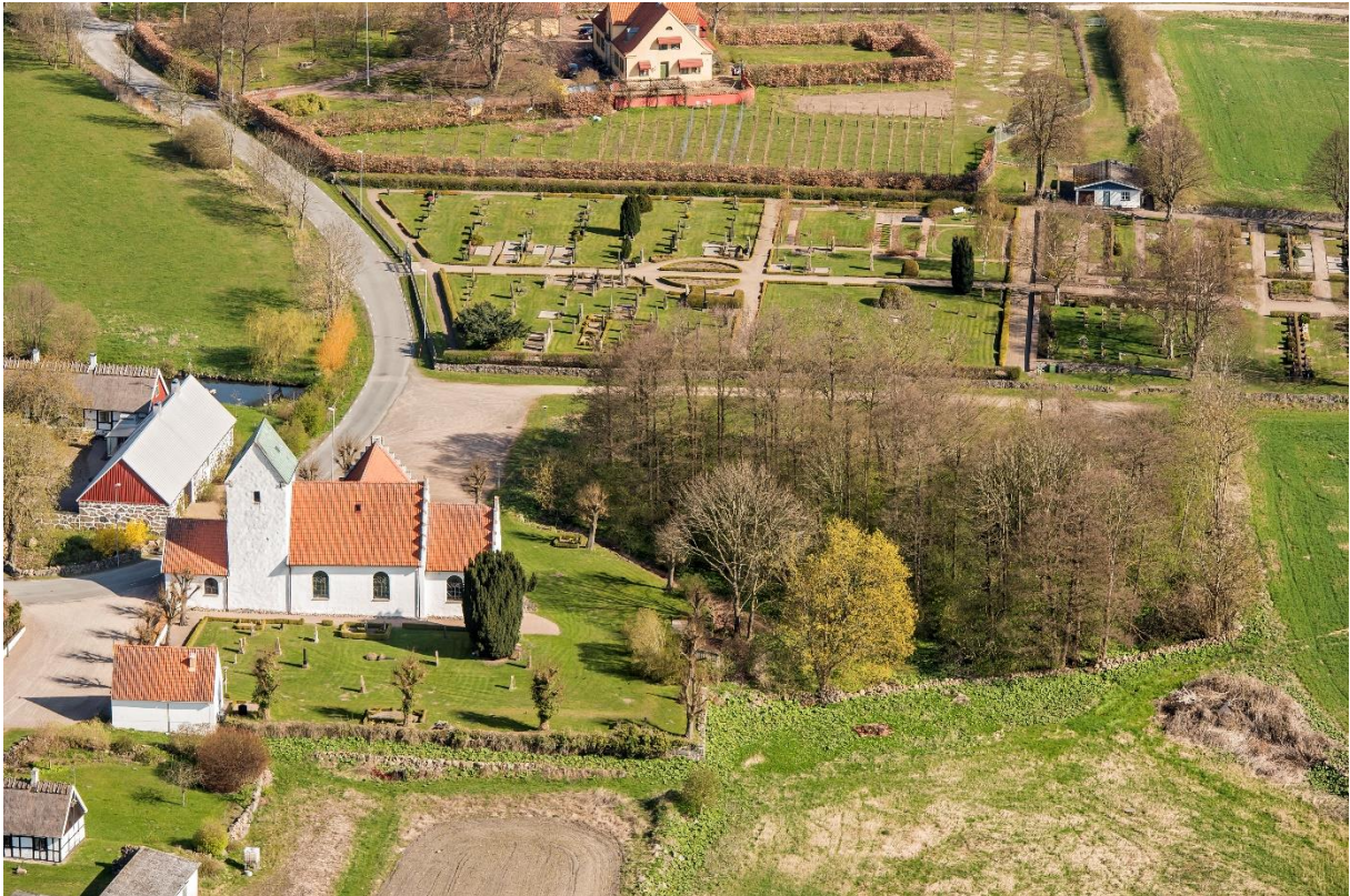
Flygfoto över Maglehems kyrkoanläggning från söder med kyrkogården från 1892 i norr samt den före detta prästgården.

Kyrkan omges av en äldre kyrkogård med en vitputsad mur med tegelavtäckning mot väster. Muren har två ingångar söder och norr om vapenhuset, vilka är försedda med dekorativt utformade smidesgrindar med solformad dekor. Mot omkringliggande mark i sydost och öster är en betydande nivåskillnad. Kyrkogården domineras av gräsbevuxna ytor med låga buxbomshäckar med några äldre gravvårdar framför allt på södra sidan. Marken närmast kyrkan är täckt med singel. En ny kyrkogård anlades 1892 norr om kyrkan och Julebodaån, mellan kyrkoherdebostället och kyrkan, och utökades 1945. Den äldre delen har ett dekorativt smidesstaket med grindar mot landsvägen i väster. Gravvårdar med titeln lantbrukare dominerar, vilket visar på att jordbruk varit en viktig näring i socknen. Men även titlar som kvarnägare förekommer, vilket visar på näringen vid Blåherremöllan vid Julebodaån.