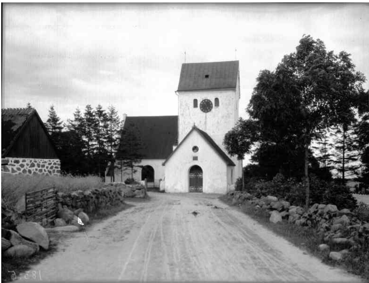
Maglehems kyrka från landsvägen i väster. Foto: Oscar Halldin, 1904–1906. Bilden är hämtad från Riksantikvarieämbetets bild databas Kulturmiljöbild.

1902 fick kyrkan nya dörrar och vapenhusets ingångar i söder och norr murades igen och ersattes av fönster. Fönsteröppningarna förstörades och försågs med gjutjärnsbågar. Invändigt kläddes korsarmens tak med pärlspontpanel och golven lades med viktoria-plattor. Äldre gravstenar i golvet placerade mot korets norra mur.