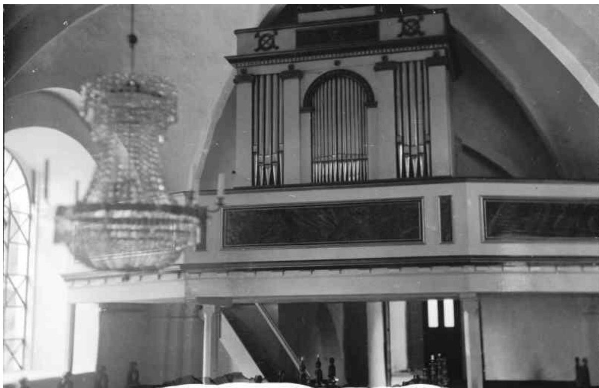
Interiör mot väster innan orgelläktaren revs i slutet på 1950-talet och orgeln flyttades till korsarmens läktare.

Maglehems kyrkomiljö ingår i område Olseröd-Blåherremölla-Maglehem som är utvärderat som Särskilt värdefull kulturmiljö i Kulturmiljöprogram för Skåne, framtaget av Länsstyrelsen.