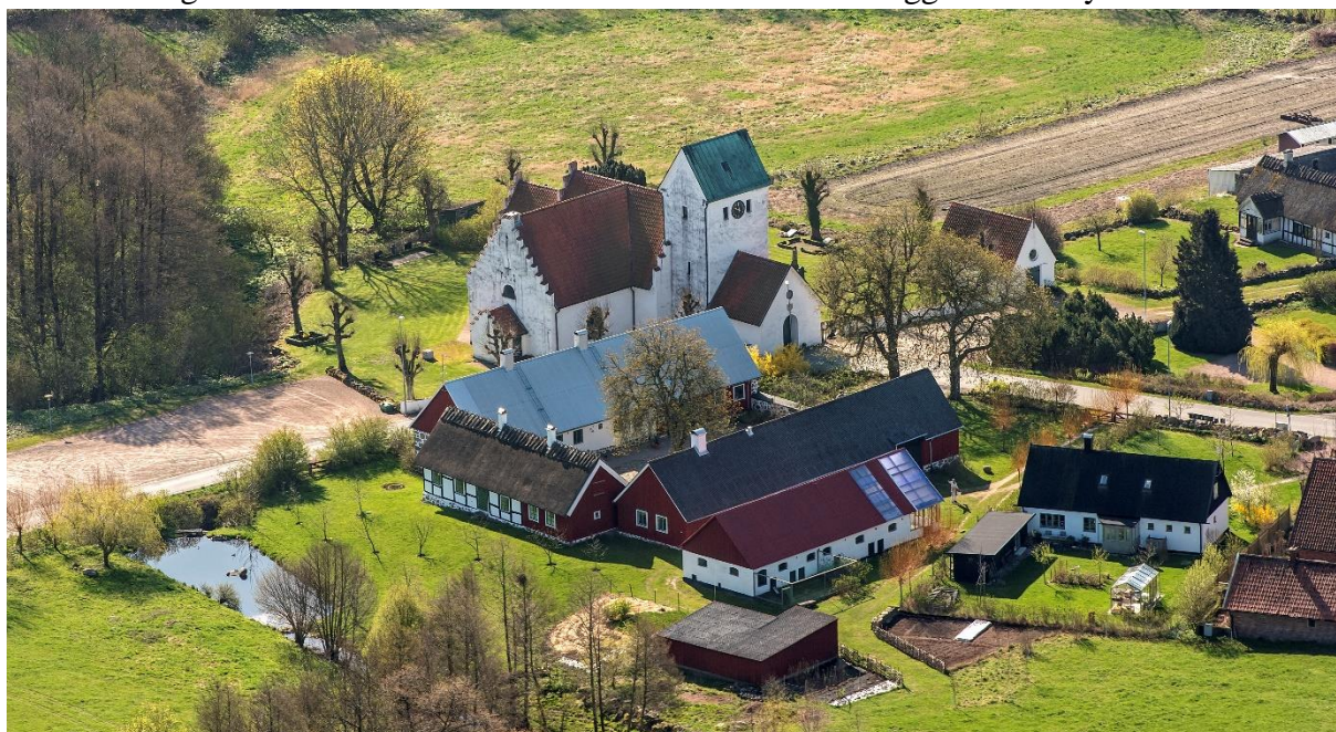
Flygfoto över Maglehems kyrkoanläggning från nordväst. Foto: Pär-Martin Hedberg, 2014.

Maglehems kyrka är belägen strax öster om väg 19, ca 2 mil söder om Kristianstad. Socknen ligger på sydostsluttningen av Linderödsåsen och nära kusten i öster och består av öppna betesmarker, fruktodlingar och områden av ädellövskog. Den äldre vägsträckningen passerar direkt väster om kyrkans vapenhus och kyrkogårdens västra mur. Kyrkan är högt placerad på en liten plåtå, som sluttar i öster mot Julebodaåns före detta bäckravin, och med vid utsikt mot havet i öster. Byn låg tidigare, enligt äldre kartor, framför allt väster och söder om kyrkan. Ett flertal äldre gårdar med karaktäristisk korsvirkeskonstruktion ligger kvar i byn.