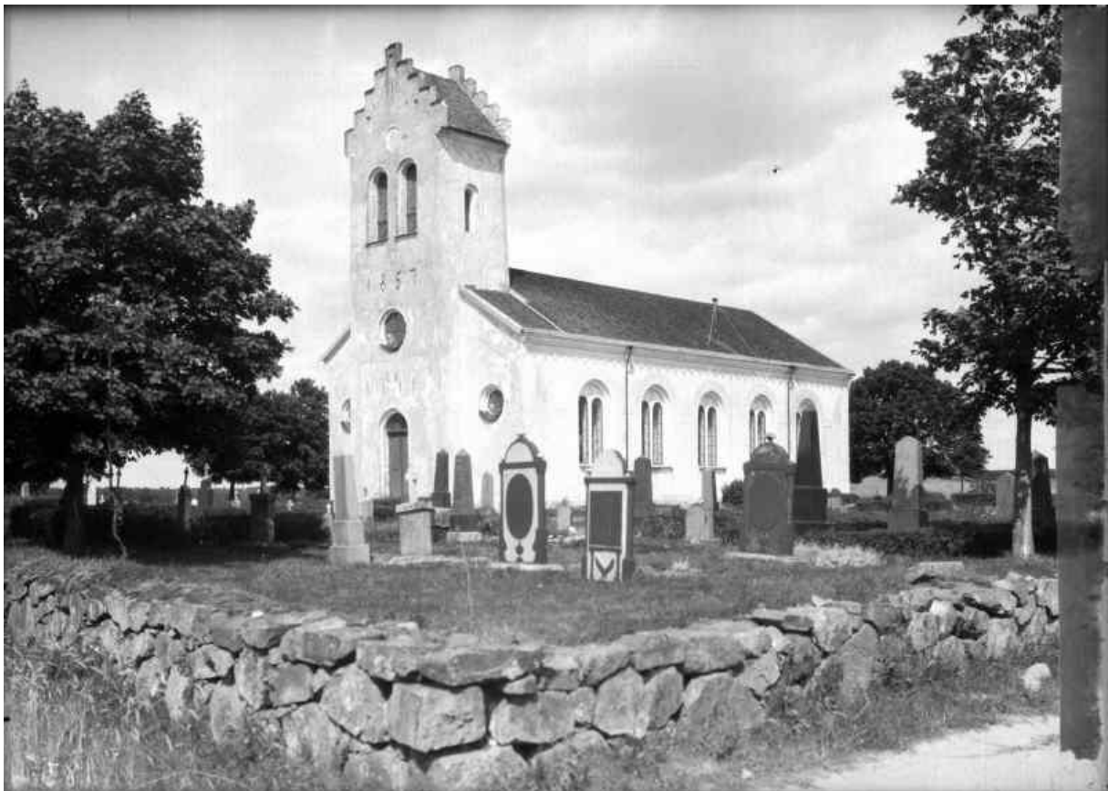
Foto: Oscar Halldin 1904–1906. Bilden är hämtad från Riksantikvarieämbetets bilddatabas Kulturmiljöbild.

Hörröds kyrka nyuppfördes 1856–1858 i nyromansk stil efter ritningar utförda 1846 av arkitekt Albert Törnqvist, Överintendentsämbetet. Kyrkans utformning blev enklare än ritningsförslaget med bl. a ett typiskt skånskt trappgaveltorn istället för en högre spira. Byggmästare var T Ljunggren, Kristianstad. Albert Törnqvist (1819–1898) var en flitigt anlitad kyrkoarkitekt i hela landet och hans kyrkor uppvisar för tiden moderna dekorativa drag, men anknyter också i hög grad till den omedelbart föregående periodens former i nyklassicism. Vid grundläggningen 1856 lär en tupp blivit begravd, vilket ska vara sista gången den urgamla riten användes vid uppförandet av svensk kyrka.