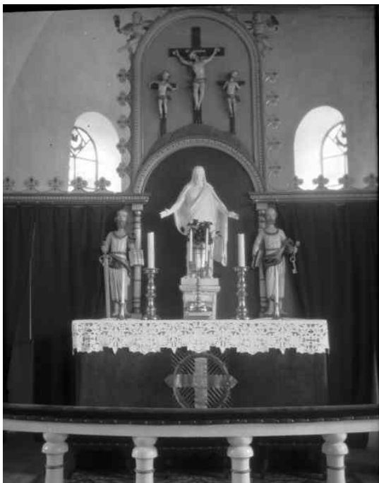
Foto: Henrik Alm 1926. Bilden är hämtad från Riksantikvarieämbetets bild databas Kulturmiljöbild.

Riksantikvarieämbetet – FMIS Fornsök, Kulturmiljöbild