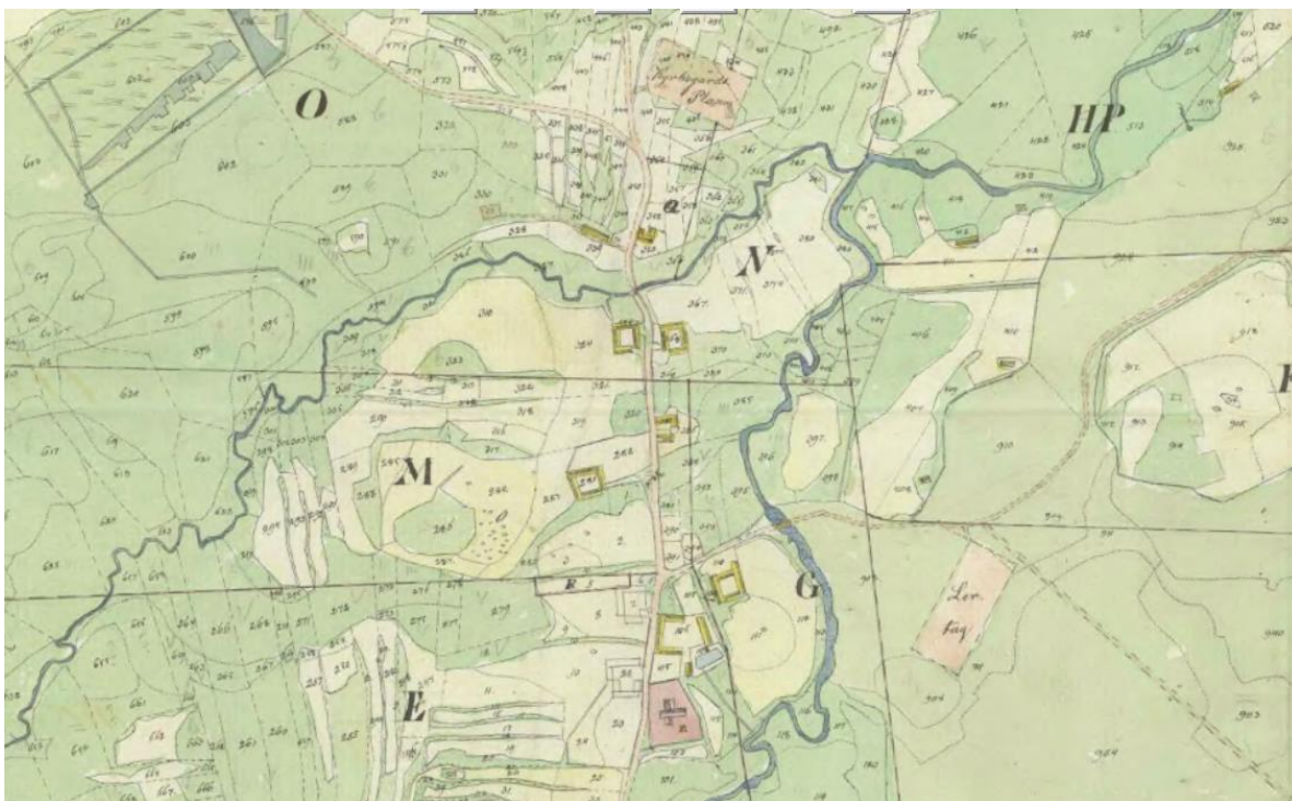
På lagaskifteskartan över Huaröd 1831 är den fristående klockstapeln markerad vid kyrkans södra sida och i byns norra del syns pest- och kolerakyrkogården.