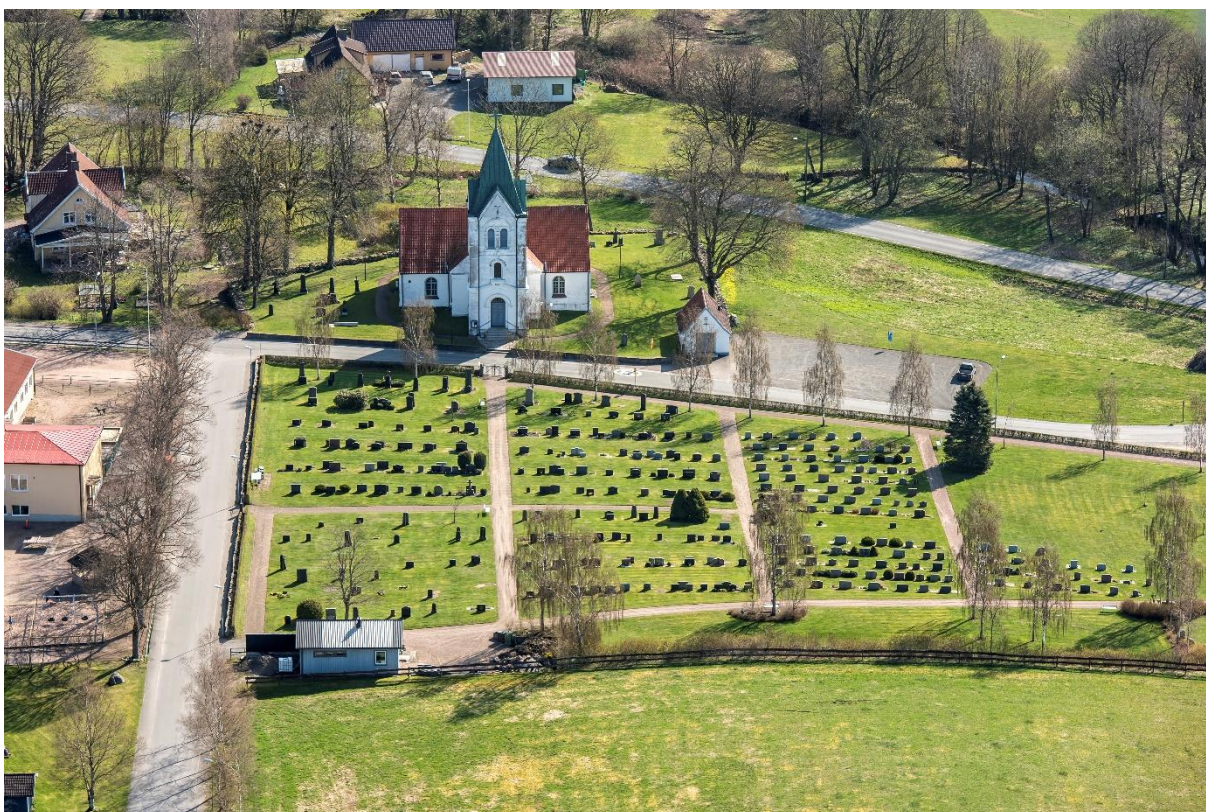
Flygbild över Huaröds kyrkoanläggning från väster med den nyare kyrkogården, som anlades 1915 i förgrunden. Foto: Pär-Martin Hedberg, 2014.