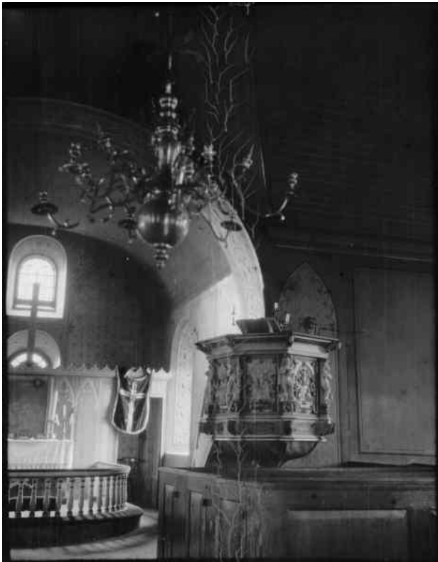
Foto: Henrik Alm, 1926. Bilden är hämtad från Riksantikvarieämbetets bilddatabas Kulturmiljöbild.

1883 utfördes nästa större ombyggnad, då tornet i väster revs och långhuset förlängdes åt väster och ett nytt torn uppfördes. Delar av det medeltida murverket återanvändes i de nya murarna. Även dessa förändringar utfördes efter ritningar utförda av arkitekt Ludvig Hedin. Sannolikt förändrades även interiören samtidigt med innertak av pärlspontpanel samt schablonmålning.