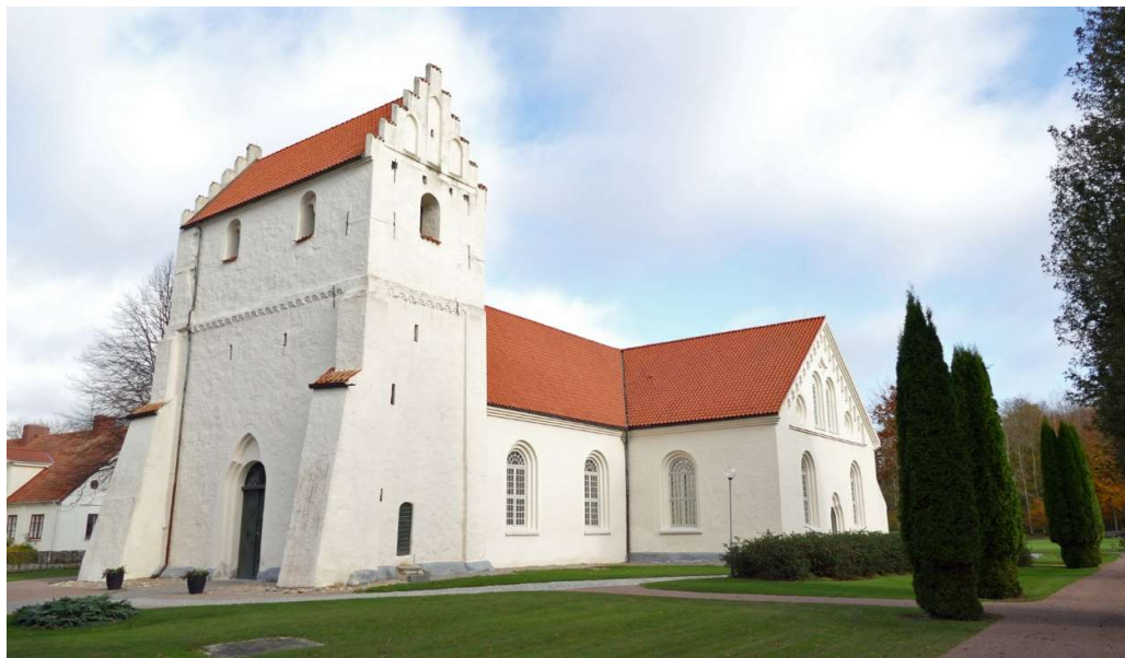
Ivetofta kyrka med romansket västtorn och långhus och korsarmar uppförda på 1850-talet. Bilden är tagen från sydväst.