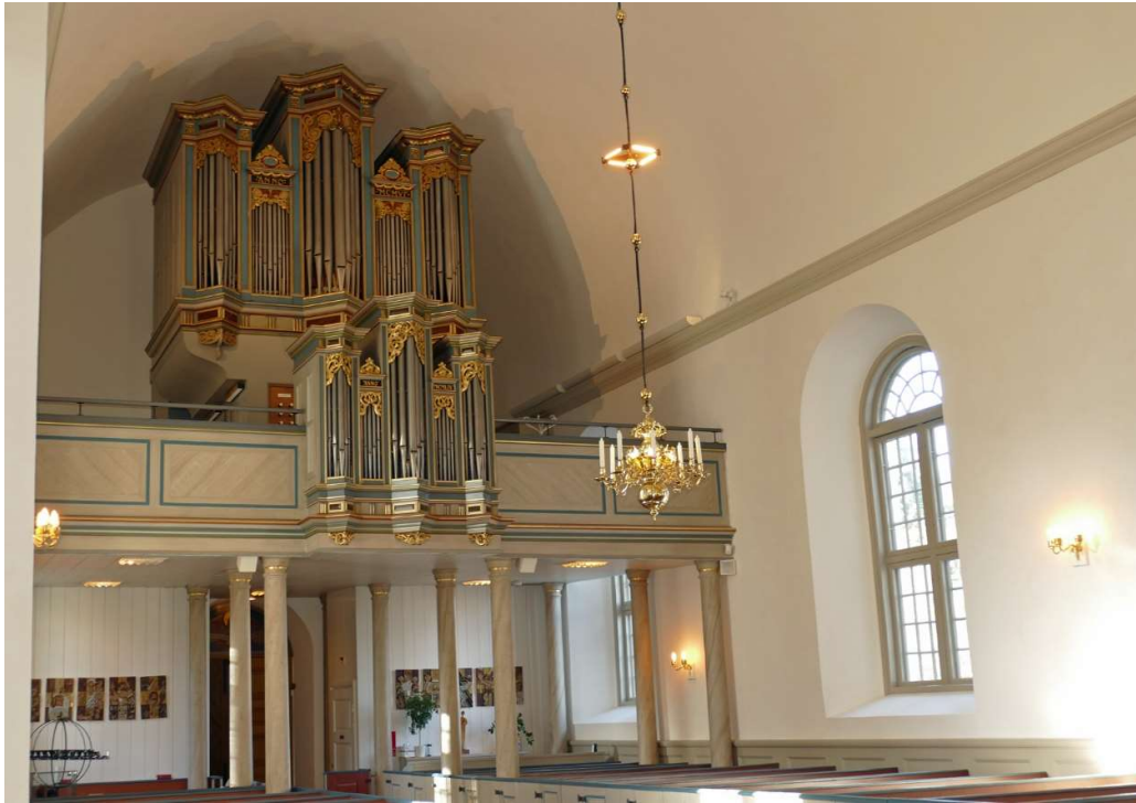
Kyrkans orgelläktare är från 1850-talet. Läktarfronten och orgelfasaden tillkom vid 1906 års renovering och ryggpositivet i läktarfronten tillkom på 1950-talet.

längs tornets södra mur. Tornet har två våningar utöver bottenvåningen (första våningen). Trappan är murad av olika stora markstenar. I muren finns partier med tegel som kan vara ursprungliga. Vid andra våningsplan har södra delen av tornet med trappan sannolikt varit avskild från tornrummet med en murad vägg. Väggen är numera raserad och våningens murverk är synligt. Murverket är bredare nedtill på väggen, vilket kan vara spår efter det tunnvalv som tidigare täckte vapenhuset i tornets bottenvåning. Partier med tegel förekommer även här. I norra väggen finns en murad rundbåge i muren under vilken det, enligt vård- och underhållsplanen, ska finnas ett igensatt fönster. Den tredje våningen rymmer klockbocken av furu. I murverket finns urtag som kan ha varit avsedda för en äldre klockupphängning. Vid murkrönet är bjälklaget av ek och mycket kraftigt. Takstolarna är medeltida och uppbyggda med saxsparrar av ek. Urtag visar att takstolarna vid något tillfälle ändrats om. Vinden över långhuset har taklag av furu och isolering på tunnvalvens översida.