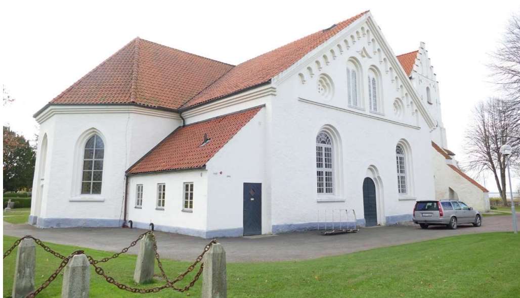
Kyrkan från nordost. Den lägre byggnaden med pulpettak byggdes på 1950-talet och rymmer sakristia.