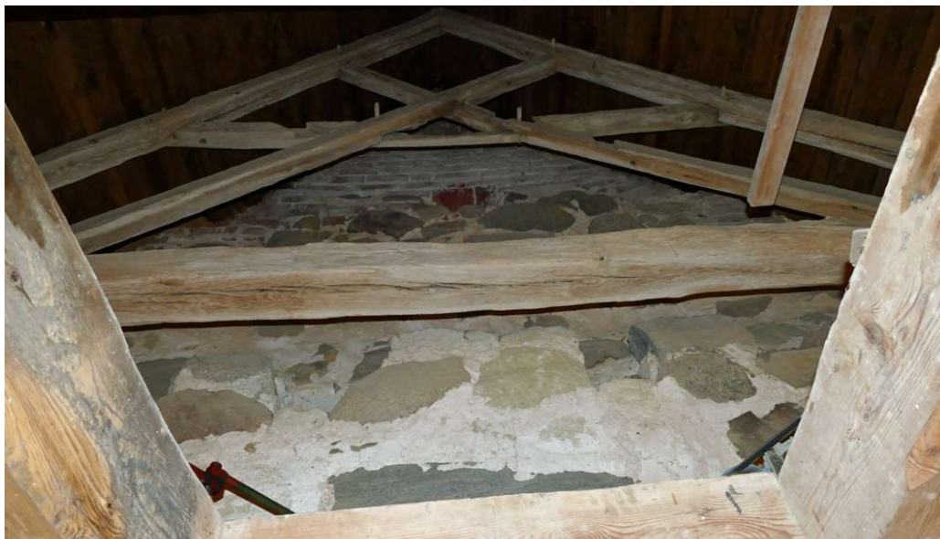
Tornets takstol och det övre bjälklaget är utförda i ek. Detta är den äldsta delen av kyrkans takkonstruktion och bör dateras med dendrokronologi. Urtag i takstolarnas delar visar på att de ändrats eller kompletterats. I den nedre delen av bilden syns klockbocken av fur, sannolikt från 1800-talet.

Ryggpositivet tillkom på 1950-talet. Orgelfasaden och ryggpositivet är båda indelade i fem lodräta fält med orgelpipor. Grundkulören är grå med ljus blå, röda och förgyllda detaljer.