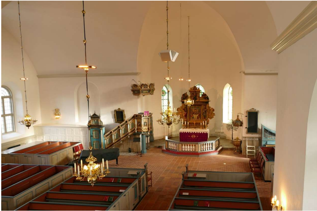
Utblick över kyrkorummet från läktaren i västra delen av långhuset.

listverk mot takfoten. Likaså på östra fasaden. Klockvåningen har kolonettförsedda, rundbågiga öppningar med tegelklädda solbänkar åt öster, norr och väster. Kolonetterna har tärningskapital. I söder är endast en rundbågig muröppning utan kolonnett. Trappstegsgavlar med spetsbågiga nischer vetter mot söder och norr. Synliga drag- och ankarjärn finns i höjd med rundbågsfrisen och klockvåningen. Kyrkans huvudentré ryms i en rundbågig muröppning omgiven av en mjukt treklöverformad spetsbågig omfattning i två språng. De dubbla dörrbladen är klädda med grönmålad panel, dekorativt utformad i rombiska mönster. I tympanonfältet ovan dörren finns ett överljus med sirligt utformade träspröjsar.