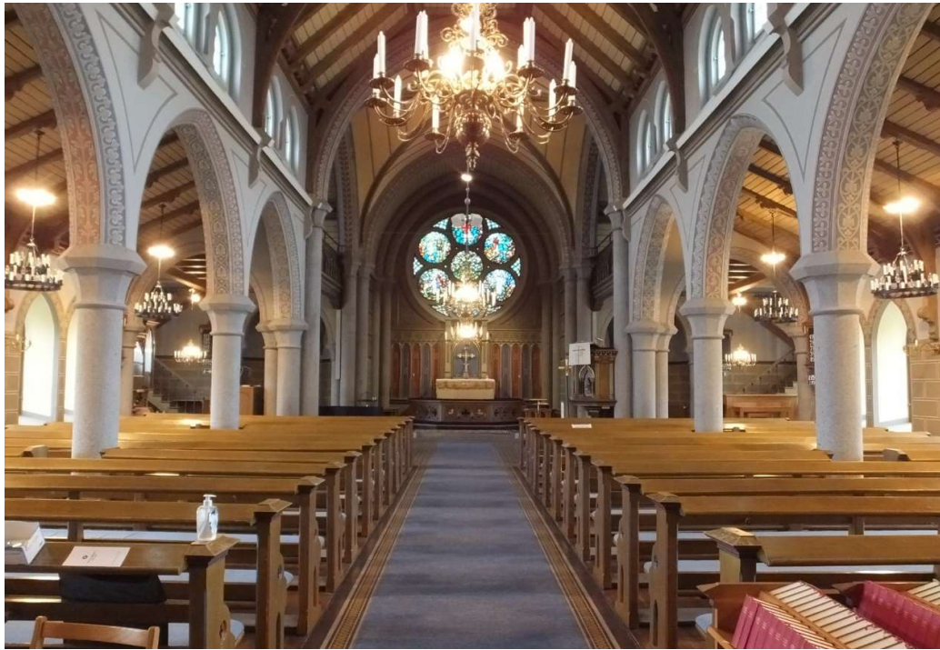
Utblick från västra delen av långhuset mot koret.

Färgsättningen på dessa bårder avviker från kyrkorummets övriga färgsättning som karakteriseras av dova och jordnära samt träimiterande kulörer. Likaså avviker motiven med sina raka och stiliserade uttryck från de övriga växtlika dekorerna.