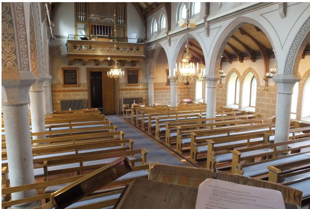
Utblick från predikstolen över kyrkorummet åt väster.