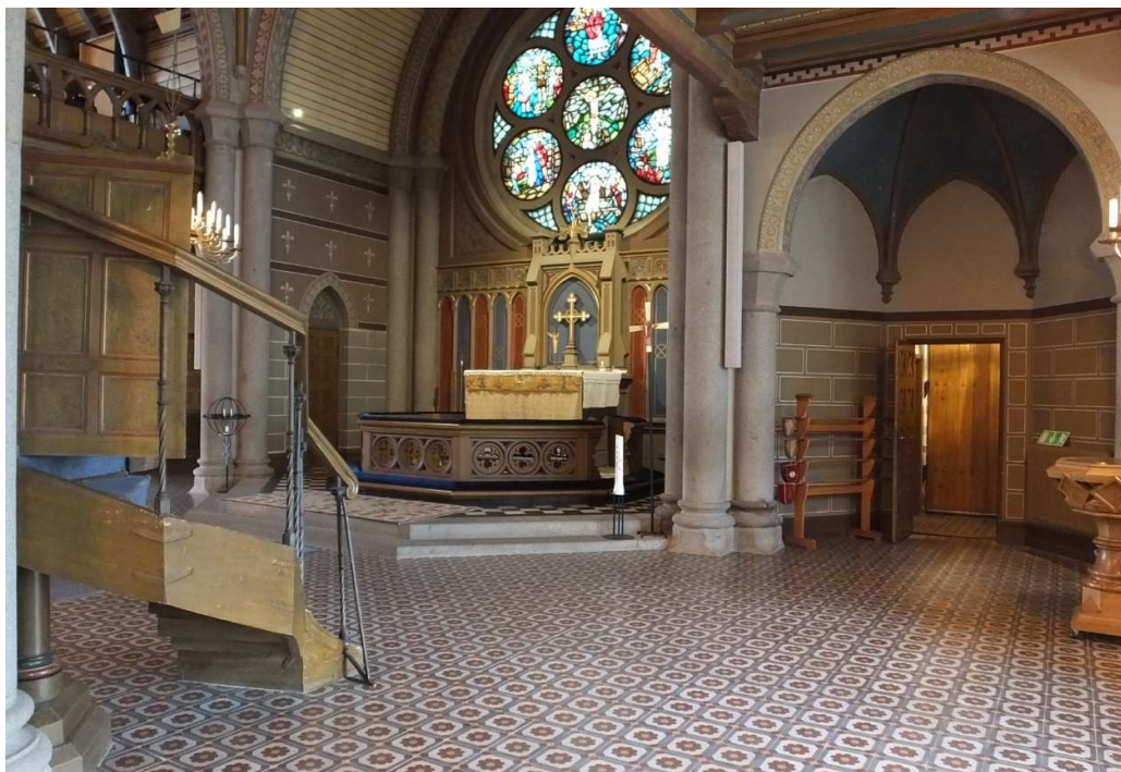
Koret och ingången till sakristian.