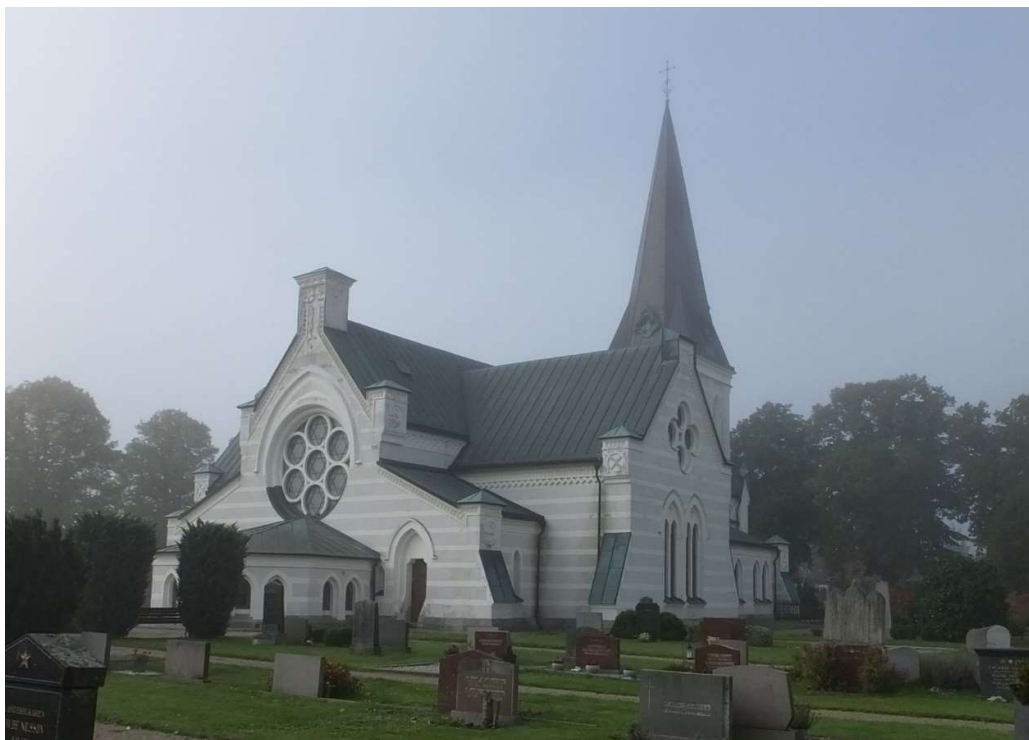
Nosaby kyrka, från nordost.

plåttäckning återkommer fyrpassformationer, här i form av blinderingar, en i vardera väderstreck. På sidoskeppens västra gavelfasader finns runda blinderingar med trepass. En grupp av tre små fönsteröppningar med vinklade avslut sitter på torndelens norra och södra fasader. Övriga fönsteröppningar är spetsbågiga i olika formationer, grupperingar och storlekar som är anpassade efter de olika fasaderna. I öppningarna sitter gjutjärnsfönster som är grönmålade men som tidigare haft en bronsliknande kulör. Även ljudöppningarna, två par på vardera tornfasad, är spetsbågiga med brunmålade jalusiluckor. Ljudöppningarna kröns med ett klöverblad som även förekommer på de små tornen kontreförerna på vardera sida om tornets västra fasad.