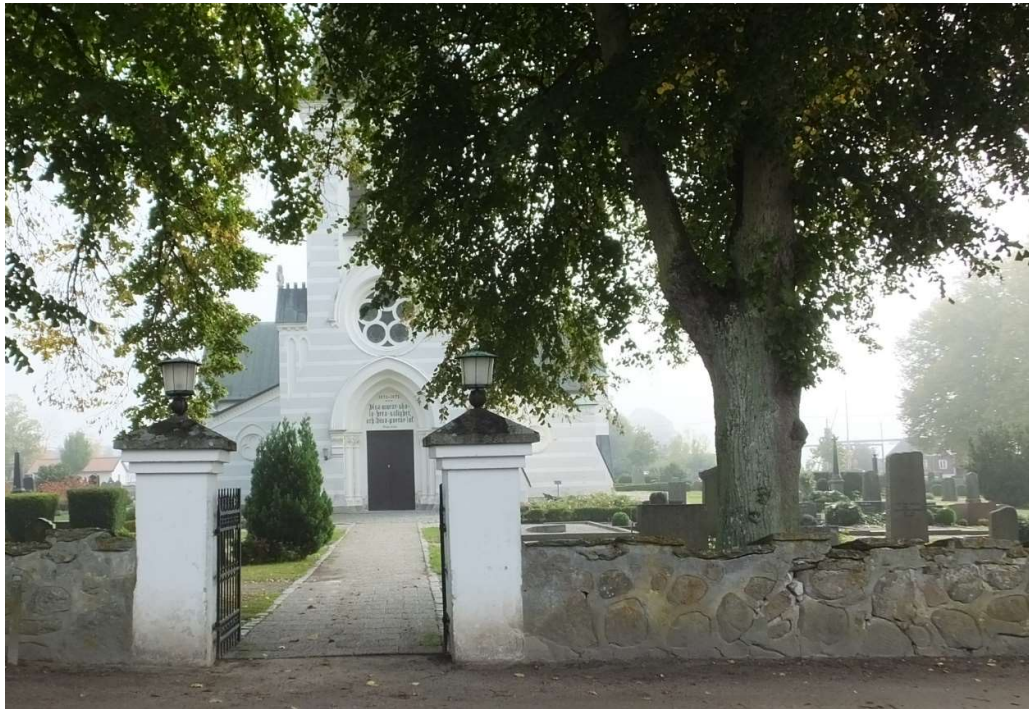
Ingången till kyrkogården genom muren i väster.

De panelklädda taken med den synliga takstolen tillför en nivå till kyrkorummets dekorativa gestaltning och ger kyrkorummet en sakral höjd men samtidigt en ombonad känsla. Detaljutformning i snickerier såsom sockellister, dörrar och foder är värdefulla delar i kyrkorummets helhetskaraktär.