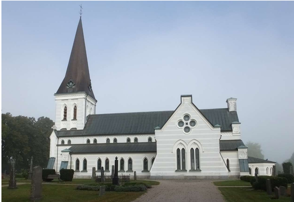
Nosaby kyrka, södra fasaden.