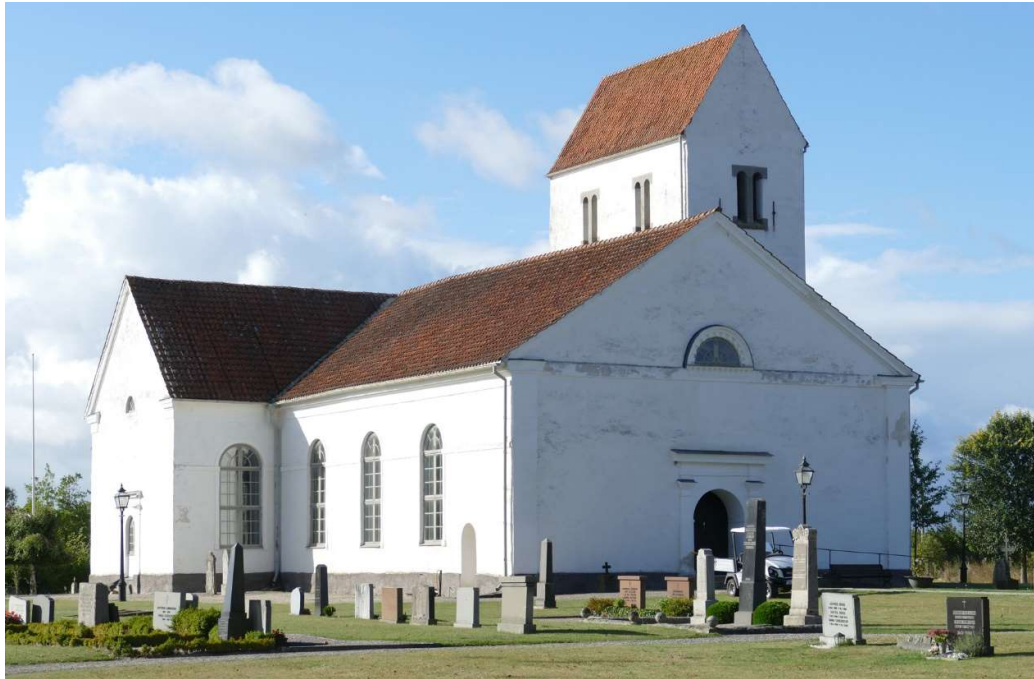
Fjälkestad kyrka från nordost.