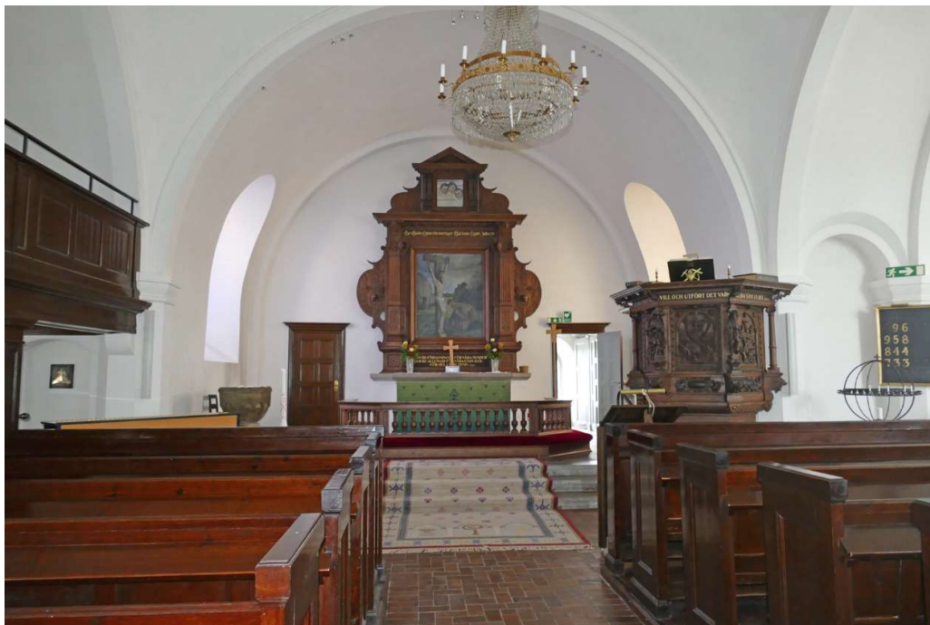
Utblick från norra delen av kyrkorummet, mot kyrkans kor som ligger i söder.