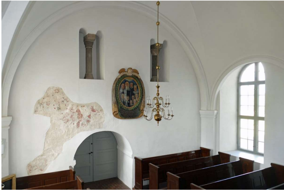
Kyrkorummets västra vägg är densamma som tornväggen och av medeltida ursprung. Här har ett parti av medeltida kalkmålningar frilagts och i väggpartiets övre del finns två kolonnstförsedda öppningar till en ursprunglig så kallad emporvåning.