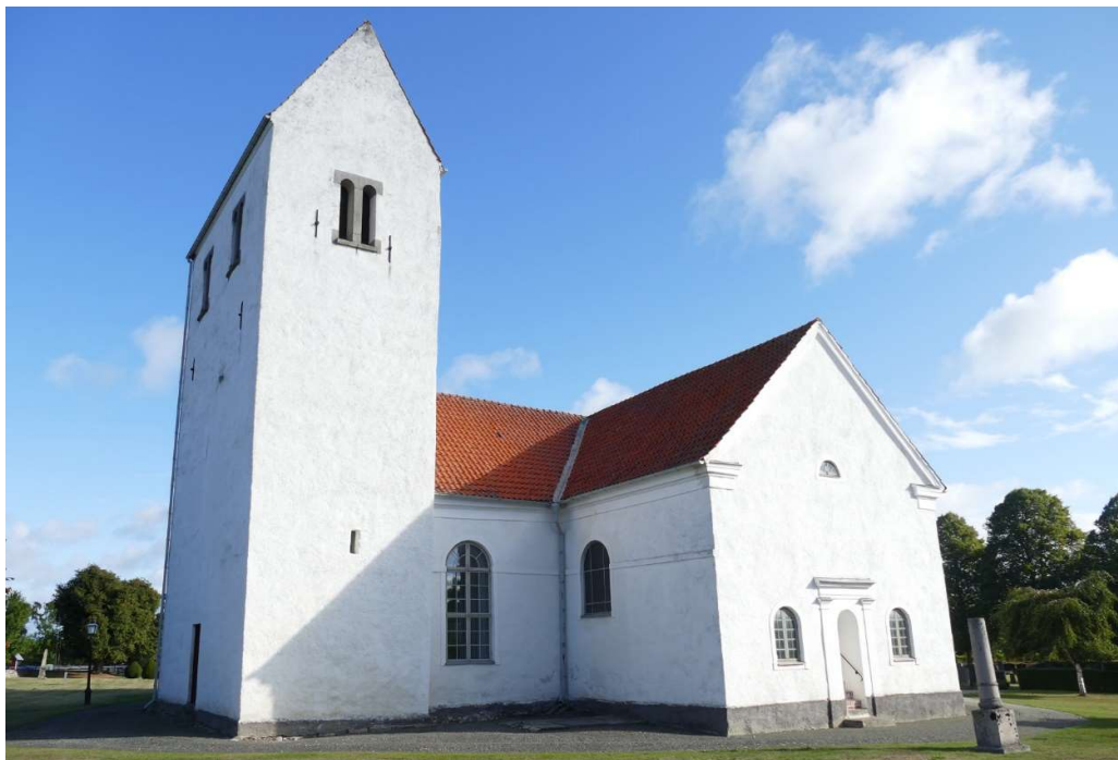
Kyrkan från sydväst.