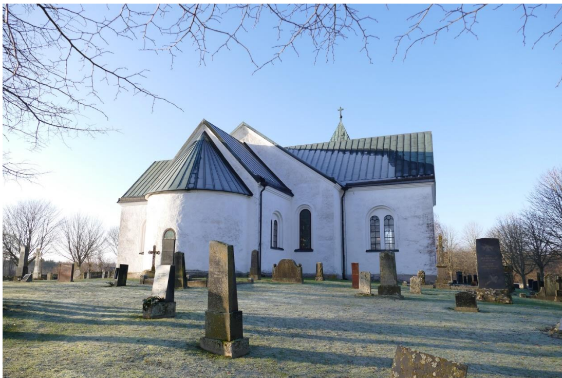
Kyrkans östra fasad med kor och absid från sent 1100-tal närmast i bild.

prytt med en törnekrona. En ny predikstol hade tillverkats. Kyrkorummet fylldes därtill med bänkar i hela långhuset och i de båda korsarmarna. År 1866 installerades en orgel på läktaren i västra delen av långhuset.