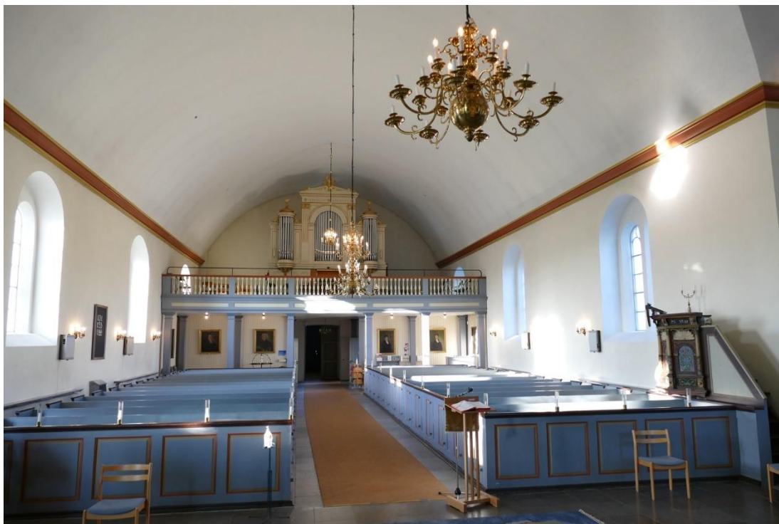
Utblick från koret mot orgelläktaren i den västra delen av långhuset.

flyttats från kyrkorummet. En brant trappa av trä leder vidare upp till klockvåningen. Denna våning domineras helt av klockbocken som har en plattform med trappor mellan de två klockorna. Klockrummets väggar är putsade och vitmålade. I djupa, tegelmurade nischer i vart väderstreck finns parställda ljudluckor. Via träs-tegar kan torntakets bjälklag, också det av furu, nås.