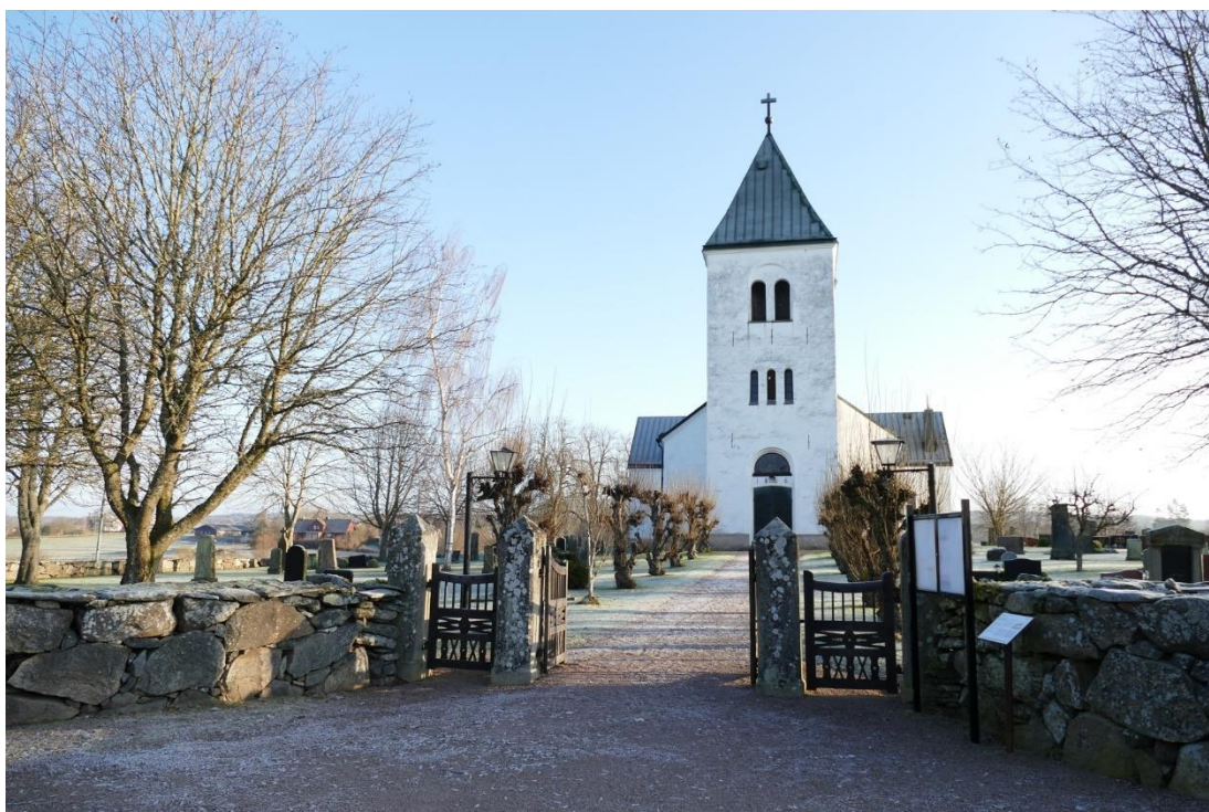
En trädkantad grusgång leder upp till kyrkans huvudentré i väster.