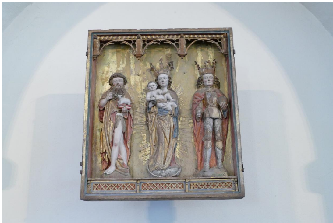
Av kyrkans medeltida altarskåp återstår idag endast mittpartiet. Skåpdelen är monterad i koret och fungerar som altartavla. I mitten står Jungfru Maria med Jesusbarnet, till vänster Johannes döparen och till höger en oidentifierad helgkonung i rustning.

predikstolen till början av 1900-talet då denna återplacerades i kyrkan. Båda predikstolarna hade plats i kyrkan tills den yngre vid 1930-talets renovering flyttades upp i tornet.