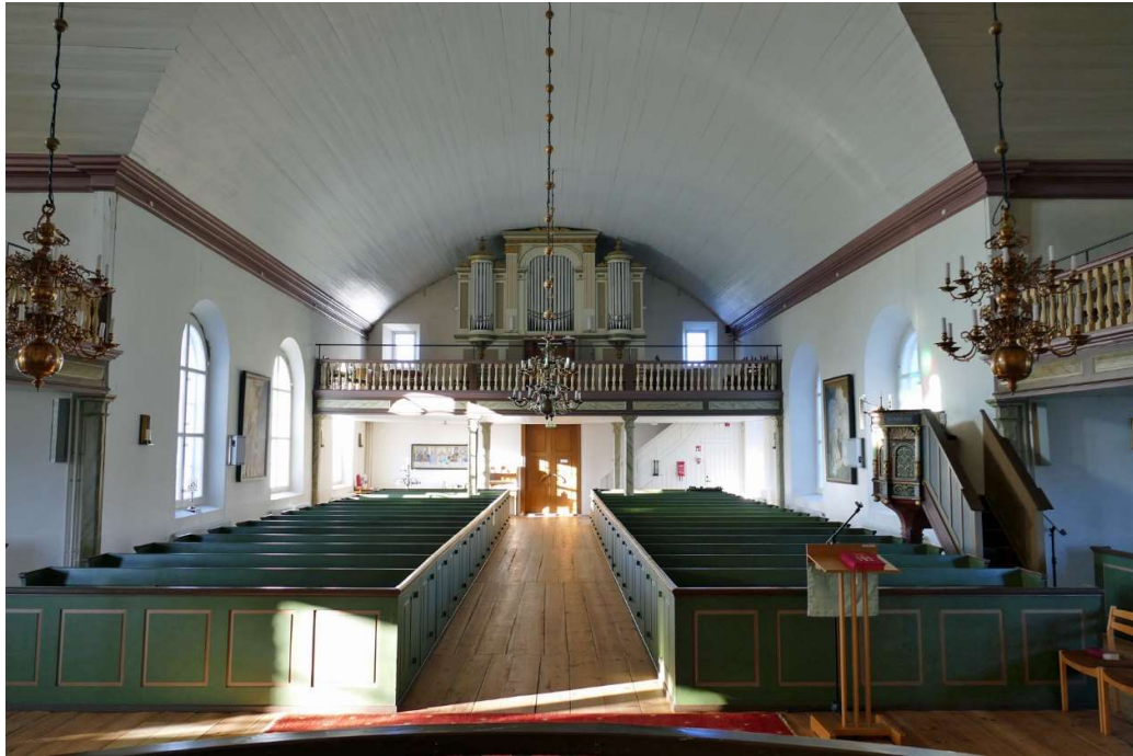
Utblick över kyrkorummet från koret, mot orgelläktaren i väster.

Predikstolen har daterats till 1590-tal och har tillskrivits en östskånsk verkstad, troligtvis hörde en baldakin ursprungligen till stolen. 1807 målades predikstolen med guld och silver, sannolikt plockades även en del av stolens dekorationer bort för att bättre passa tidens nyklassicistiska ideal. Vid renoveringen 1940–41 togs den äldre färgsättningen fram igen. Predikstolskorgen är ett snidat arbete i ek med fyra, kolonninramade bildfält med blomstermönster inom repstavramar, varje bildfält kröns av en palmett. Kolonnerna bär upp ett slätt textfält som tillsammans med en äggstavsfris och en utkragande överliggare avslutar korgen upptill. Korgen avslutas nedtill av en avsågad droppform på en senare tillkommen träpelare. Bemålningen är polykrom i dova kulörer där svart, grönt och rött dominerar.