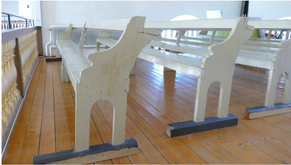
Enkelt utförda sittbänkar på kyrkans norra läktare.