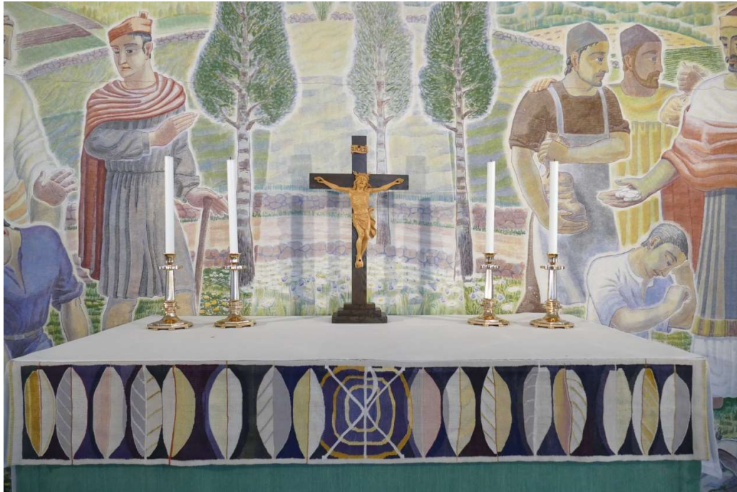
Kyrkans altare och en detalj av väggmålningen på korväggen.