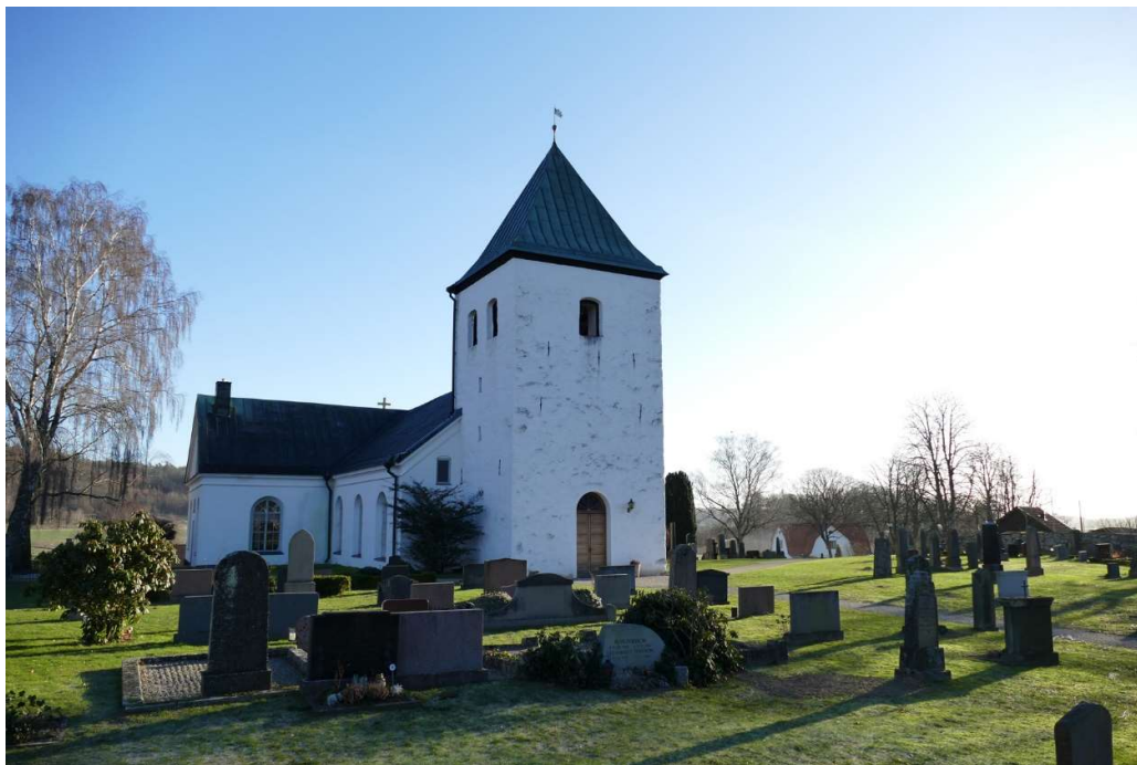
Vånga kyrka från nordväst. Tornet uppfördes på 1700-talet och övriga kyrkan 1867.