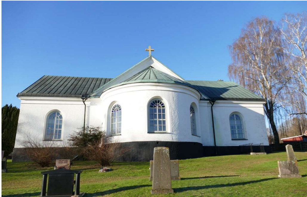
Vånga kyrkas östra fasad med halvrund sakristia.

Väggfältet ovanför sakristian försågs med en väggmålning med motivet då Jesus stiger upp ur graven.