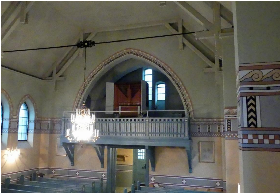
Utblick över kyrkorummet från predikstolen mot orgelläktaren i söder.