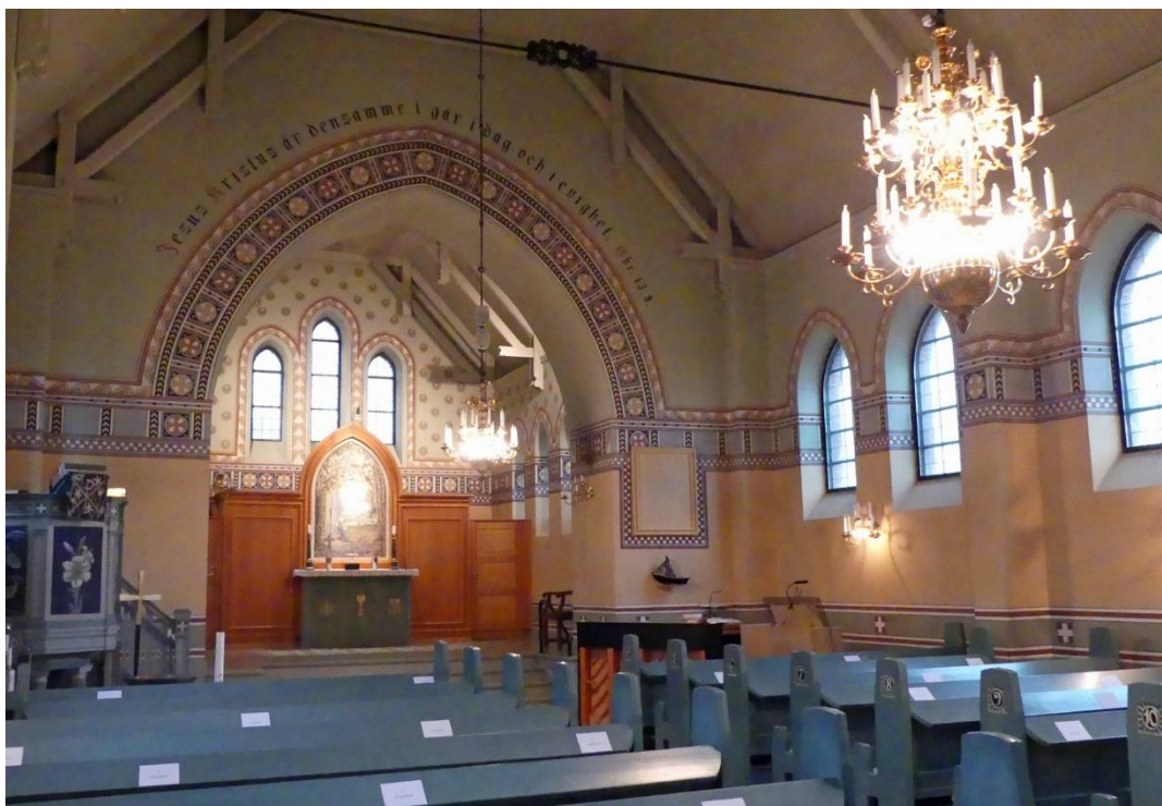
Utblick över kyrkorummet mot koret i norr.

furu. Till koret leder en trappa med tre steg, trappan liksom korets golv är av trä och målat i grå kulör.