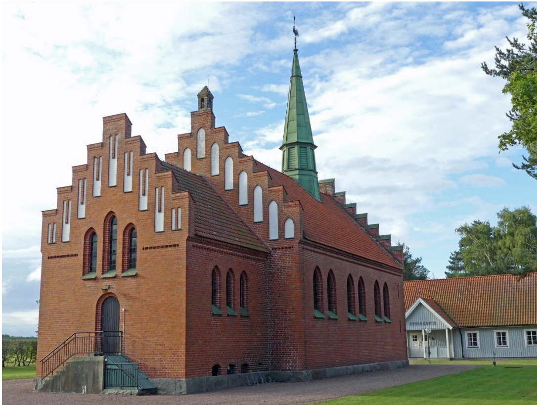
Yngsjö kapell med koret i norr.

ingången i söder. Trädplanteringar avgränsar tomten åt väster och söder och delvis åt öster. Norr om kyrkan ligger en sentida anlagd parkering och söder om kyrkan ligger ett församlingshem.