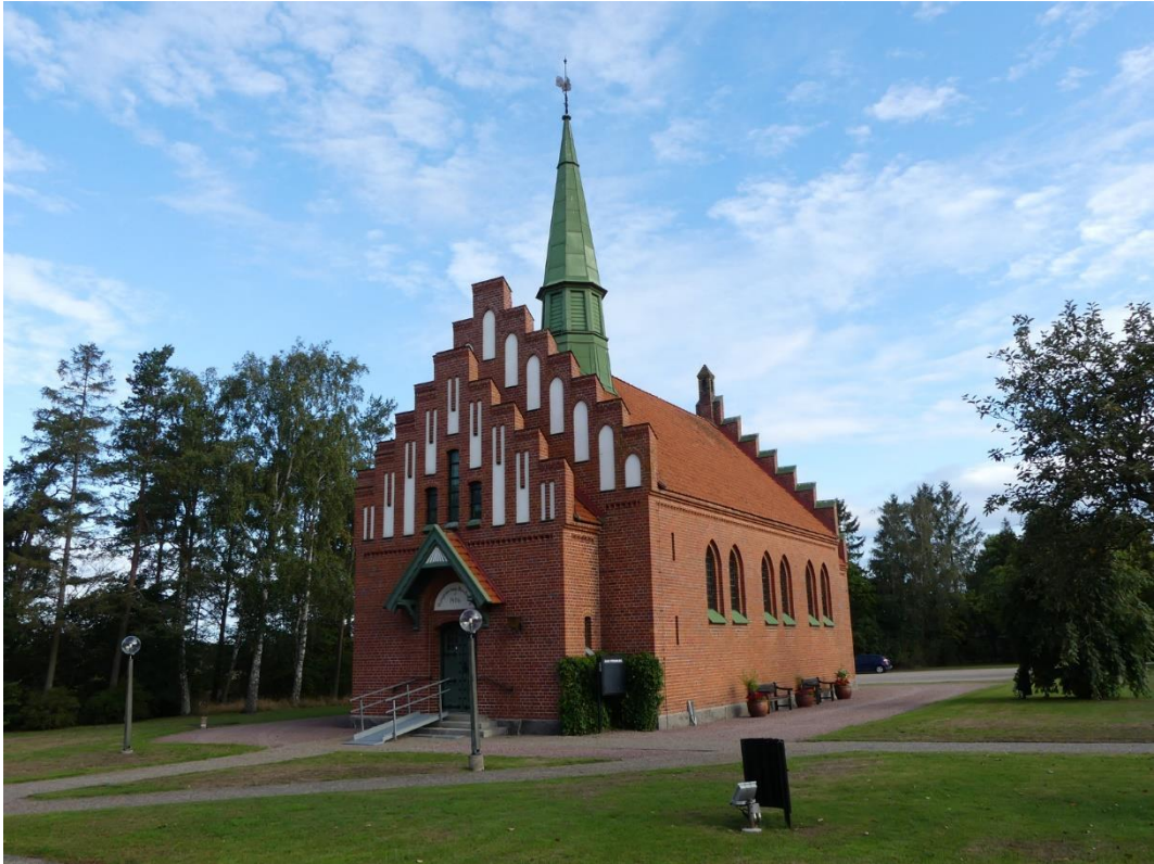
Yngsjö kapell med entrén i söder.