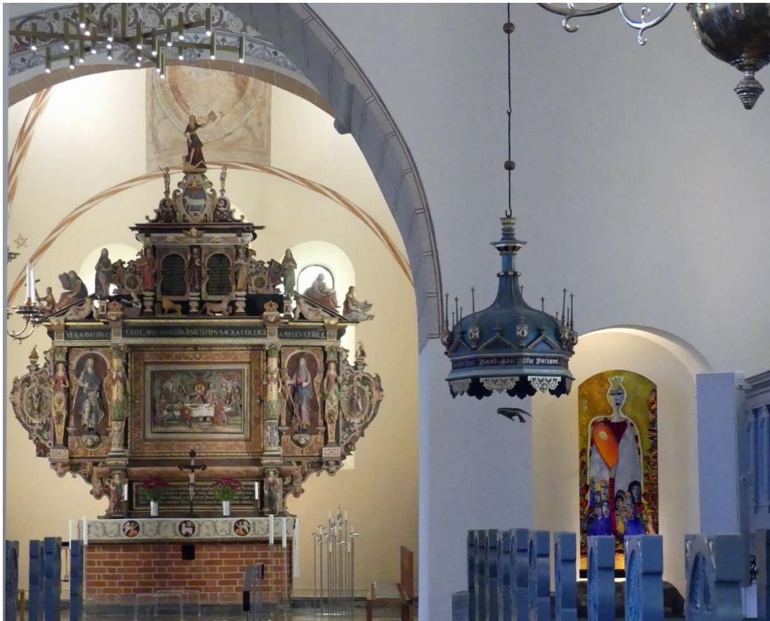
Utblick mot triumfbåge, tribunbåge och altaruppsats i koret.

ett tidigare befintligt bjälklag och över detta finns en muröppning med stickbågig innersmyg åt väster och rundbågig yttersmyg åt öster med tegeltäckt solbänk.