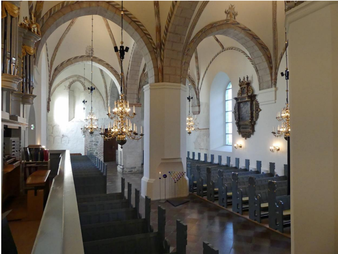
Utblick över mot västra delen av långhuset från orgelläktaren.

medeltida måleri som gjordes 1905 snarare varit väldigt nyskapande och varken i form eller kulör hade särskilt mycket gemensamt med sina medeltida föregångare. På flera av den västra mittpelarens sidor återfanns runinskrifter under den sentida putsen, bland annat början av bönen Ave Maria.