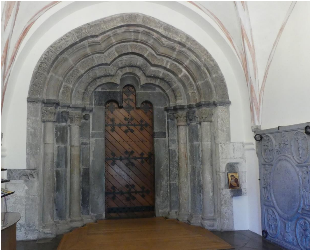
Senromansk sydportal i vapenhuset.

Kapellets fönsteröppningar är stickbågiga och gavelpartiet rikligt dekorerat med vitkalkade blindingar och redan ursprungligen försett med trappstegsgavlar. Grundläggning för ett altare har hittats vid kapellets östra vägg. Vid undersökningar i samband med 2018 års renoveringar framkom på pelaren mellan de två valvbågarna mot långhuset graffitti av vad som tolkades som ett skepp, tecknat med röd färg på den vita putsen.