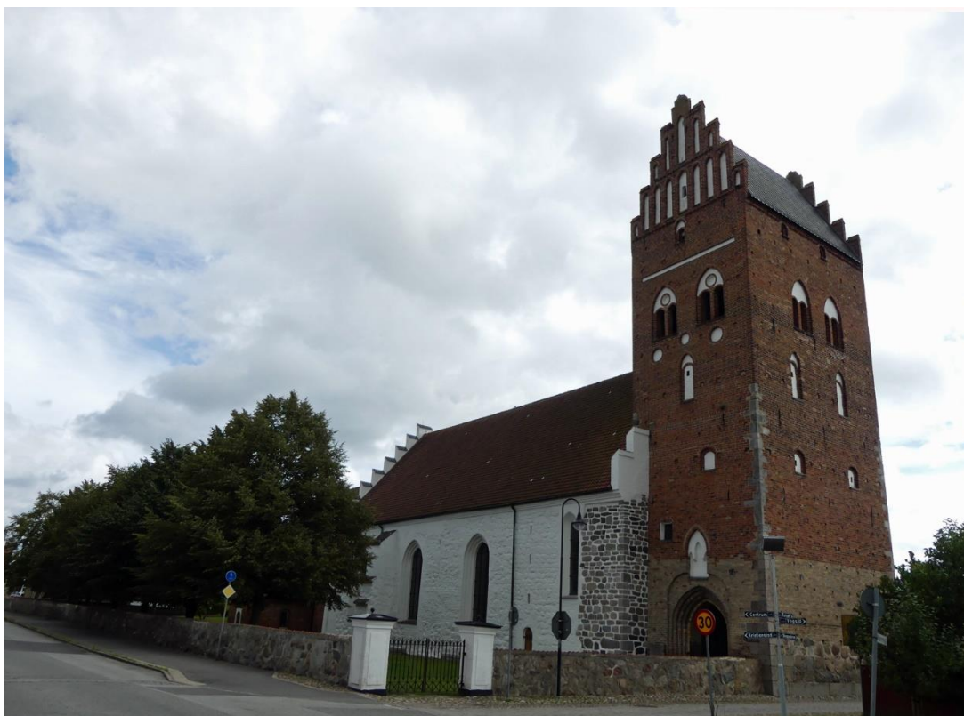
Åhus kyrka fotograferad från nordväst.