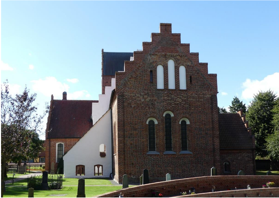
Åhus kyrka från öster med korväggen närmast. I förgrunden minneslunden på kyrkogårdens östra del.