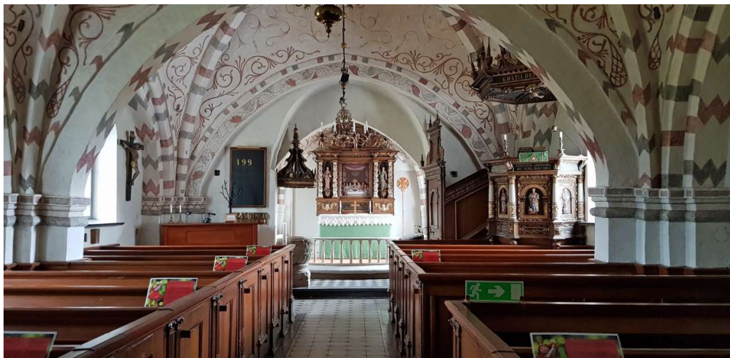
Utblick över långhuset, mot koret.

Långhusets och korets fönster är rundbågiga och placerade djupt indragna från murlivet, med fönsterbänkar av sten. Fönsterbågarna är av gjutjärn med svartmålad spröjsar. Sakristians fönster är av samma modell men i mindre storlek och är inte indragen i fasaden lika djupt. På tornets västra sida finns ännu ett gjutjärnsfönster som numer är igenmurat på insidan. På tornets södra fasad finns ett litet gjutjärnsfönster i en stickbågeformig muröppning. Strax till höger ovanför detta finns ett kvadratisk, spröjsat träfönster – i höjd med tornets första våningsplan. Muröppningen för fönstret är stickbågig. Tornet har ljudluckor i samtliga väderstreck, något större i öster och väster och något mindre i söder och norr, samtliga med stickbågeformade muröppningar och tegelpanneklädda solbänkar. Luckorna är av trä och svartmålade.