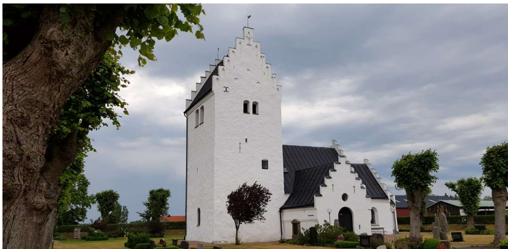
Utblick över södra delen av kyrkogården och kyrkan.

målad i vitt med detaljer i svagt blågrönt och rosa samt förgyllning. Orgelpiporna är indelade i sju lodräta fält, bland annat två tureller vilka omger ett centralt rundbågemotiv. Orgelhuset avslutas upptill av ett profilerat ramverk krönt av förgyllda kartuscher. Ovanför spelbordet från 1969 sitter ett textfält inom en förgylld ram med texten Lofsjunger Herran .