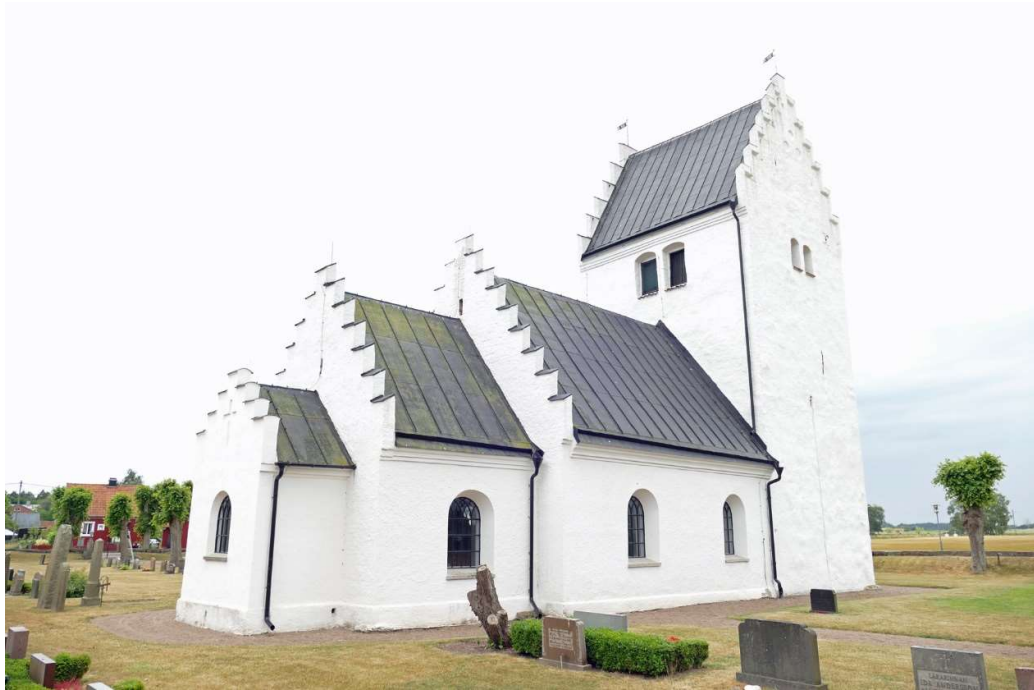
Kyrkans norra sida.

renoverades under 1680-talet. På 1820-talet hade kyrkan även två gallerförsedda fönster åt norr, med två stora lufter nedtill och små upptill. På 1840-talet byggdes sakristian öster om koret.