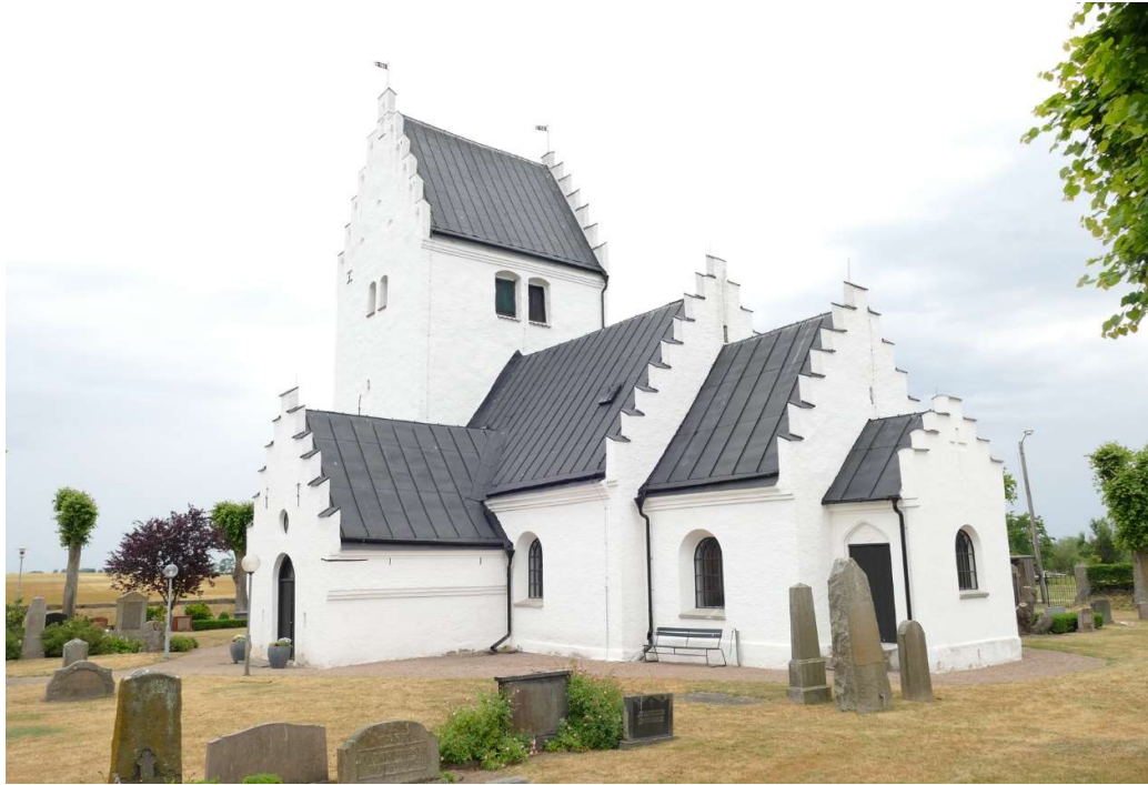
Nymö kyrkas södra och östra fasader.