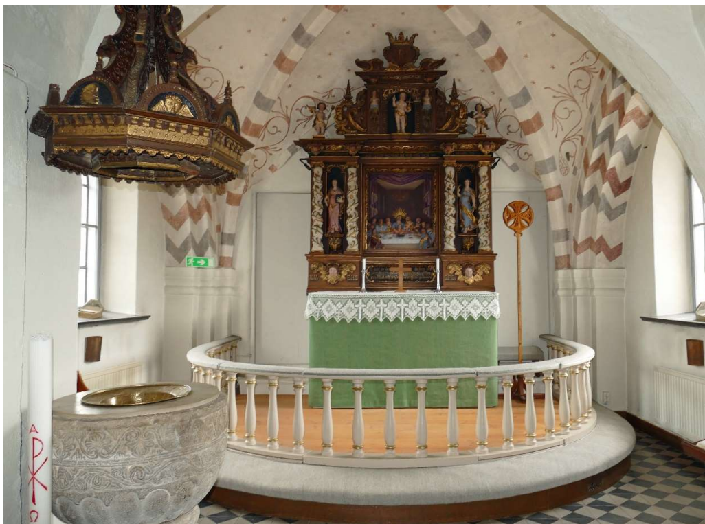
Dopfunten är daterad till tidigt 1200-tal, altaruppsatsen och dopfuntsbaldakinen är tillverkade på 1600-talet.