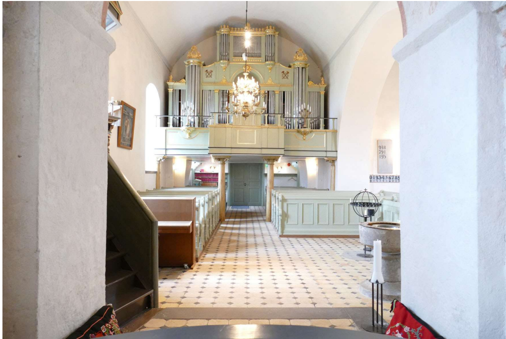
Utblick från koret och västerut över långhuset. Orgelfasaden från 1849 dominerar den västra väggen.

Åren 2007 till 2008 renoverades kyrkorummet invändigt under ledning av Ponnert arkitekter AB. Samtliga snickerier i kyrkan målades och taket under långhusets läktare kläddes med pärlspontpanel som målades ljusgrå. Fyra bänkrader i norra delen av nykyrkan togs bort. Läktarunderbyggnaden från 1971 byggdes om och i utrymmet inreddes sakristia och teknikrum. En ny trappa ersatte den äldre till läktaren. Ett fundament till en tresprångig valvpilaster upptäcktes mot långhusets sydvägg under arbetet. Även åtgärder av teknisk art beträffande larm, belysning och värme utfördes.