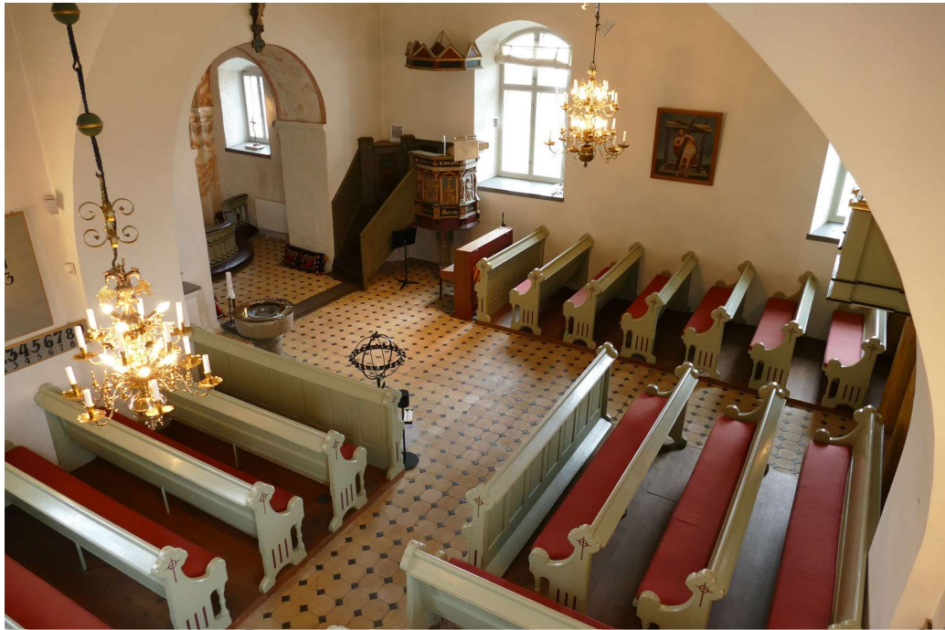
Utblick över kyrkorummet från nykyrkans läktare i norr.

bärs upp av fyra kraftiga kolonner med snidade kapitäl, målade i en varm brungul marmorering.