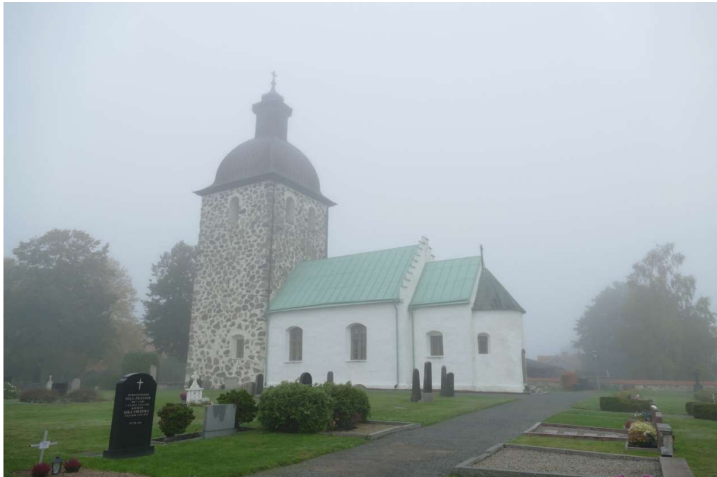
Kyrkan, vy från sydost.