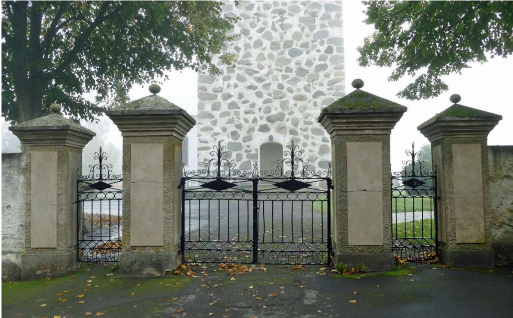
Entré till kyrkogården i väster.