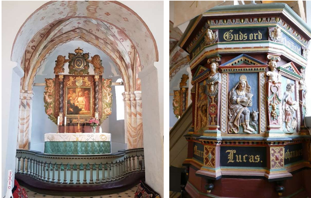
Till vänster koret med altaruspsats och kalkmålningar. Till höger en detalj av predikstolskorgen.

bemålad med bakstycke marmorert i rödbrunt, marmorerade kolonner och färger i grönt, ljust rött samt guld.