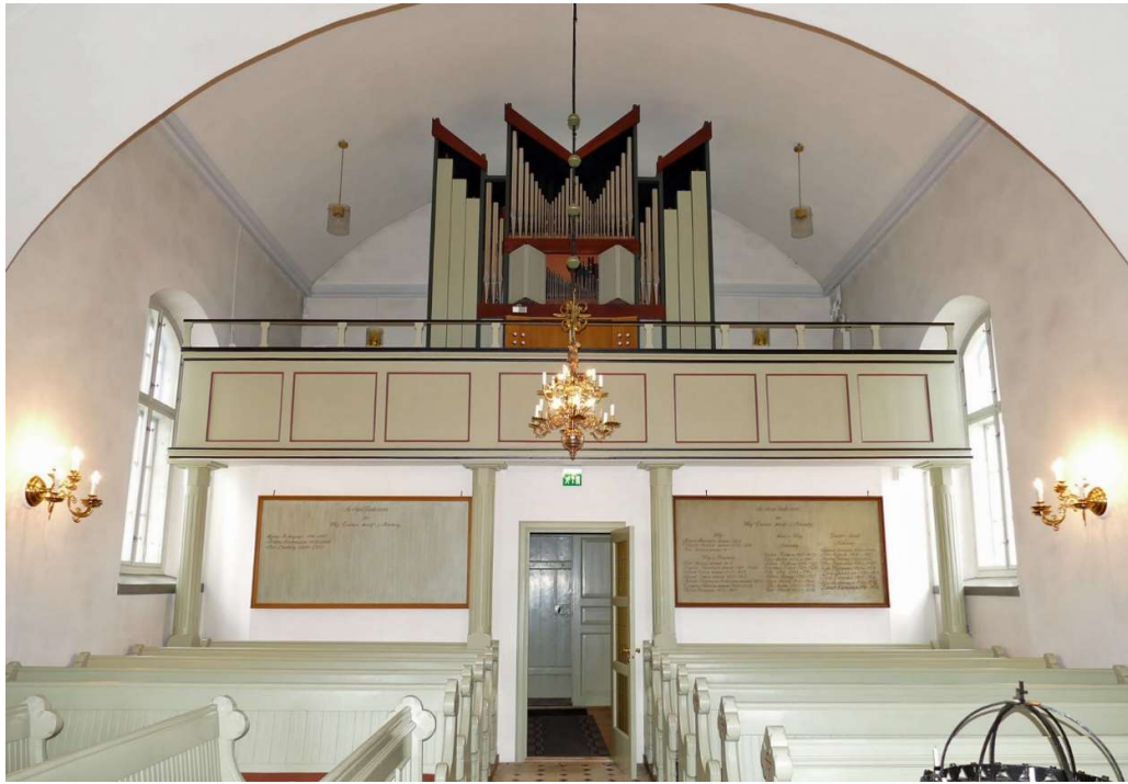
Norra orgelläktaren i nykyrkan, med orgel och fasad från 1974.

På läktaren i nykyrkan står en orgel från 1974, med tio stämmor byggd av Märtenssons Orgelfabrik AB i Lund. Orgelfasaden är ritad av Torsten Leon-Nilson i modernistisk stil. Orgelfasaden är symmetriskt uppbyggd kring spelbordet av ek så att kantorn har ryggen mot kyrkorummet. Färgsättningen går i ljust grönt, svart och rödbrunt – kulörer som återkommer i läktarbarriären.