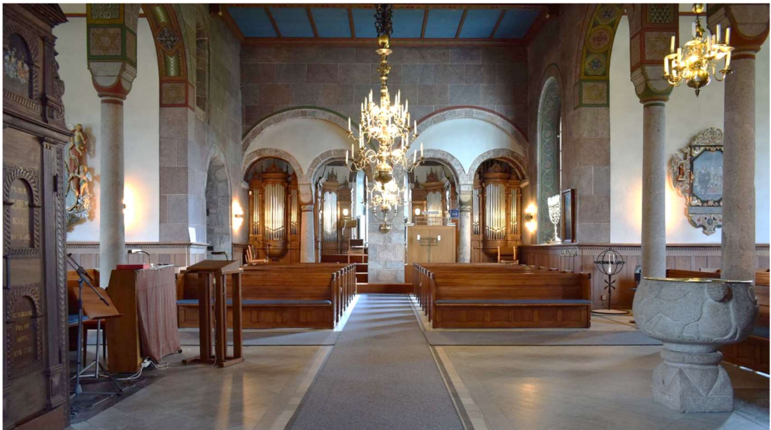
Kyrkan sett mot väster och förhallens arkadöppningar. Till höger i bild syns kyrkans medeltida dopfunt av granit.

Absiden är utförd med ett rakt väggparti i väster som ansluter mot koret vilket invändigt i kyrkorummet motsvarar tribunbågen, valvbågen mellan kor och absid. Möjligen är det här som arkeologen Claes Wahlö menar att det har funnits två hörntorn. Den nuvarande absiden har två fönster samt en prästingång däremellan. Dörren är rundbågig med en raksluten dörr och ett halvcirkelformat överljusfönster. Samtliga ytterdörrar till kyrkan är av trä och, med undantag av sydportalens medeltida dörr, täckta med liggande grågrönmålad träpanel.