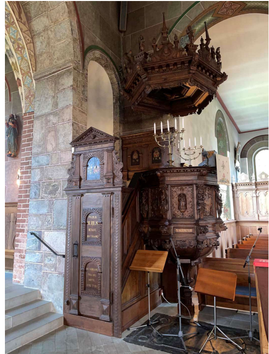
Kyrkans dopfbunt från 1100-talet och predikstolen från 1630-talet.

Både i gaveln mellan långhus och kor samt mellan kor och absid finns stora bågöppningar varav den senare gaveln tolkas som ommurad i sin helhet. Korets taklag är delvis intakt och har genom dendrokronologisk metod daterats till 1155-60 vilket tolkas som kyrkans byggnadstid. Korets östra takstol är bevarad i sin helhet och består av bindbjälke, sparrar med snedsträvor och ett hanband. Urtag mitt på bindbjälken tyder på att takstolarna varit sammanfogade med en tvärgående styrbjälke. Med undantag av östra och västra bindbjälkarna har dessa kapats vid valvslagningen för att göra plats åt valvkapporna. Delar av ett ursprungligt och från början utvändigt synligt remstycke med en repstavsornering finns bevarat över norra murkrönet. På en av de ursprungliga sparrarna i korets sjunde takstol har en runinskrift dokumenterats vilken tros ha ristats före taklagsresningen. Ristningen skulle kunna tolkas som ikiatr , möjligen rör det sig om ett namn. Absidens taklag är av fur och sentida troligen från 1800-talet.