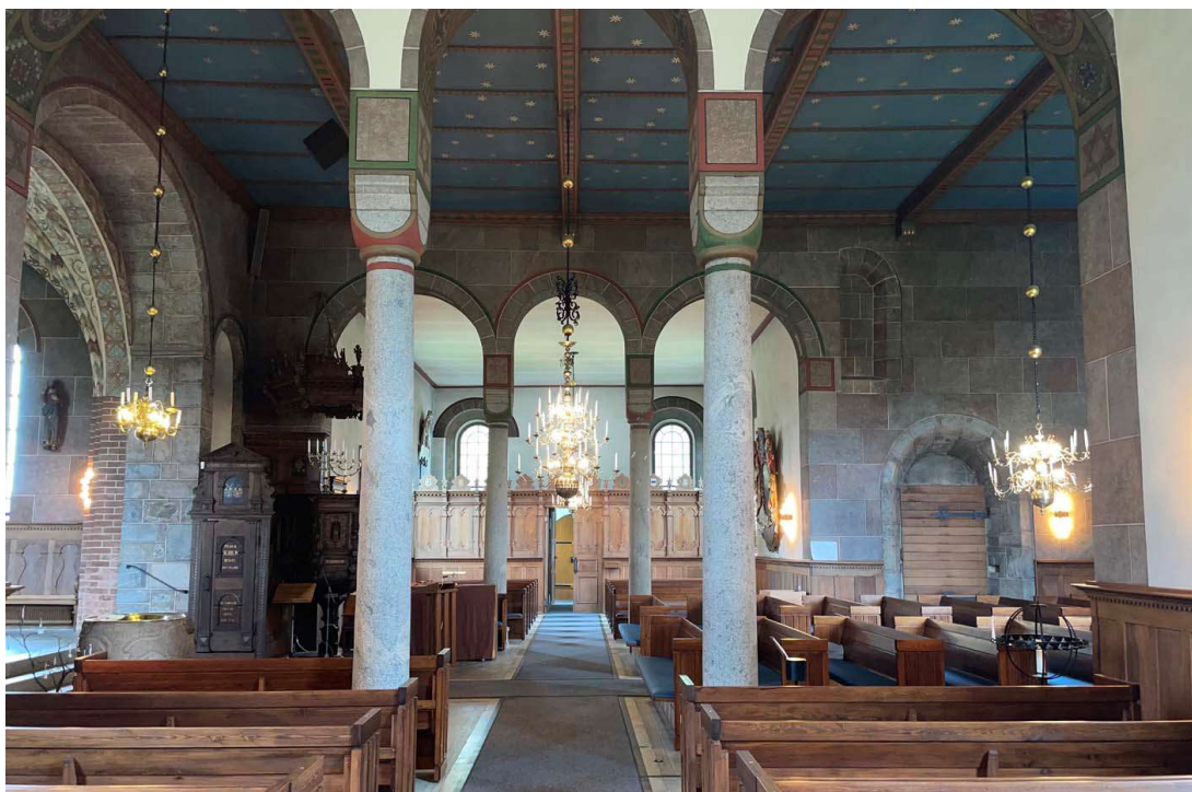
Kyrkorummet sett mot söder från norra korsarmen. Till höger i bild syns sydportalen och strax över denna en delvis bevarad romansk fönsteröppning. Innertaket över långhuset består av ett himmelsbemålat trätak med profilerade och dekormålade bjälkar.

mer geometrisk dekor av bandslingor och zickzackdekor. Målningar har även dokumenterats på långhusets väggar. Bland motiven fanns Sankt Kristoffer med Jesusbarnet och i förhallen framställdes scenerna Kristi förklaring samt Kristi intåg i Jerusalem. Långhusvalven som revs på 1700-talet har sannolikt också varit dekorerade med målningar. I korvalvets nordöstra och sydvästra valvkappor sitter ett par inmurade ansikten vars ursprung är okänt men möjligen kan de tillhöra en äldre eller ursprunglig utsmyckning, kanske från baldakinportalen där det enligt Brunius fanns ett stenhuvud vid 1800-talets mitt.