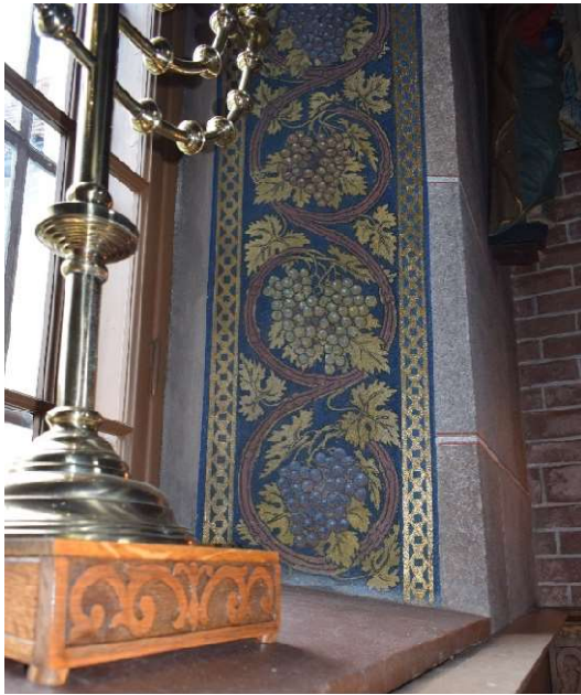
Dekormålning i korets fönsternisch.

vetter mot varandra. Samtliga tre valv är sannolikt av tegel varav det södra är genombrutet av en trappuppgång till tornets andra våning som döljs bakom det södra orgelhuset. Ingången till kyrkorummet från tornbottenvåningen består av en arkad uppbyggd av två kopplade bågar inom två större rundbågsvalv. De större valvbågarna har vederlag från sidomurarna i norr och söder samt en bred mittpelare som också bär de mindre rundbågarna i ytterkant. I mitten bärs de kopplade bågar av en rundhuggen granitkolonn med uppåt avsmalnande form. Kolonnen avslutas med en skaftring under ett tärningskapital som upptill vidgas till T-formade konsoler som bär upp muren. Kapitalen är bemålade