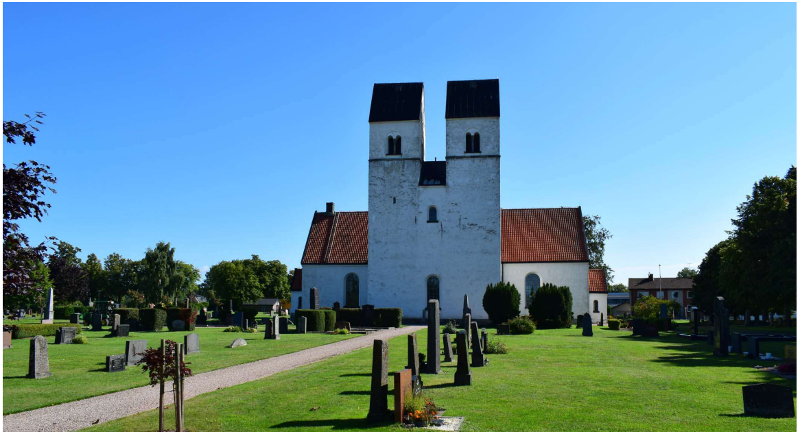
Färlövs kyrka sett från väster.

Araslövs församling, Villands och Gärds kontrakt, Lunds stift, Färlövs socken, fastighet Färlöv 48:1, Kristianstad kommun, Skåne län och landskap