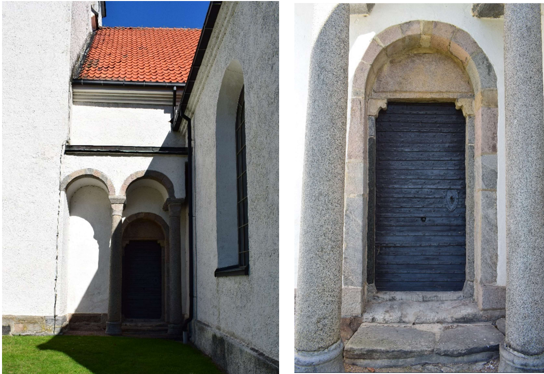
Baldakinportalen vid långhusets södra sida och portalöppning.