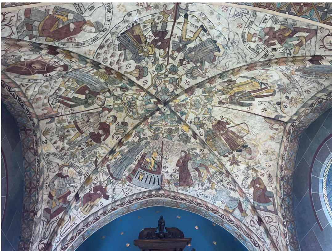
I koret bevaras medeltida kalkmålningar från omkring 1500.

År 1905 renoverades kyrkan återigen efter handlingar av arkitekten Gustaf Lindgren. Kyrkans medeltida kalkmålningar konserverades och ny målningsdekor utfördes av A. Persson. Äldre inventarier som varit undanstoppade återplacerades i kyrkan såsom kyrkans romanska dopfunt samt epitafier och vapensköldar. Altarväggen från Zettervalls renovering ersattes med ett trä- och mässingsskrank. En ny orgel med orgelfasad tillverkad av snickaren G. Lysell placerades i väster. I mittskeppet gjordes innertaket om och ny bröstningspanel vid ytterväggarna samt golv av viktoriaplattor tillkom i kyrkorummet. Nya innerfönster gjordes och en ny värmeanläggning installerades med pannrum i norra korsarmen varför den norra delen av korsarmen gjordes om med nytt förrum och värmekammare. Ett förrum gjordes också i södra korsarmen.