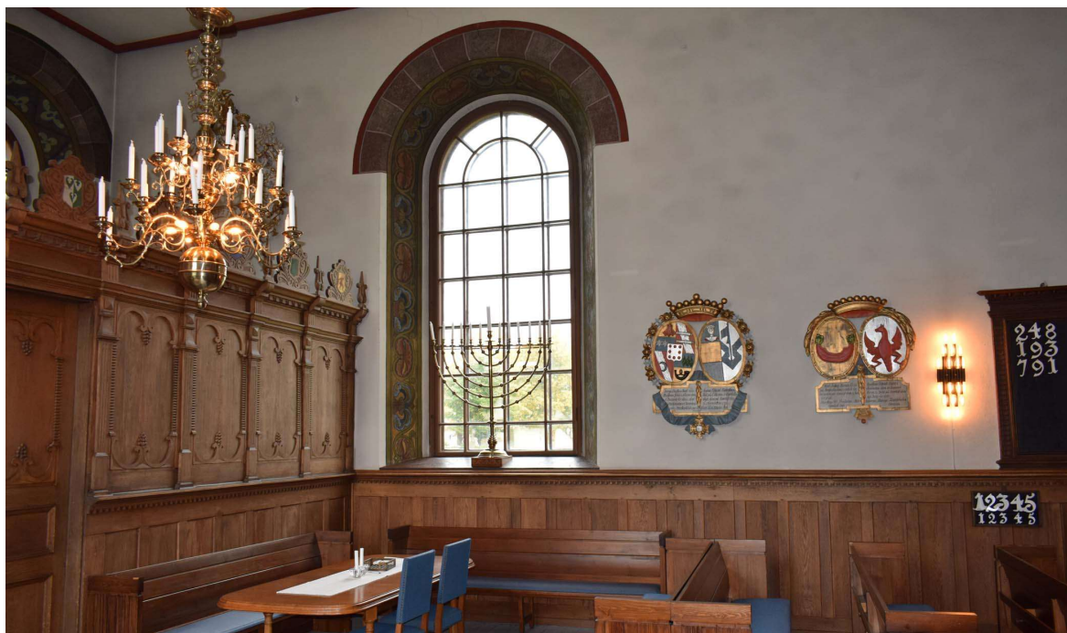
Vy mot öster i norra korsarmen.