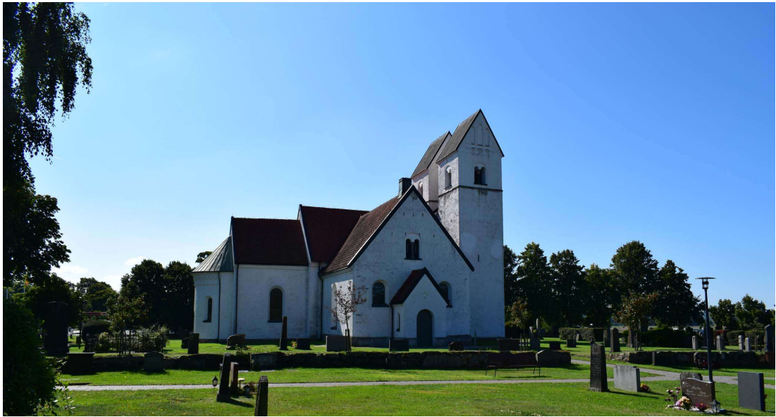
Kyrkan sedd från norr.