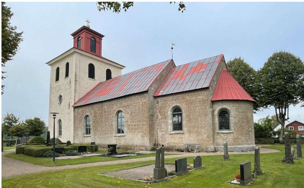
Norra Strö kyrka från sydost.