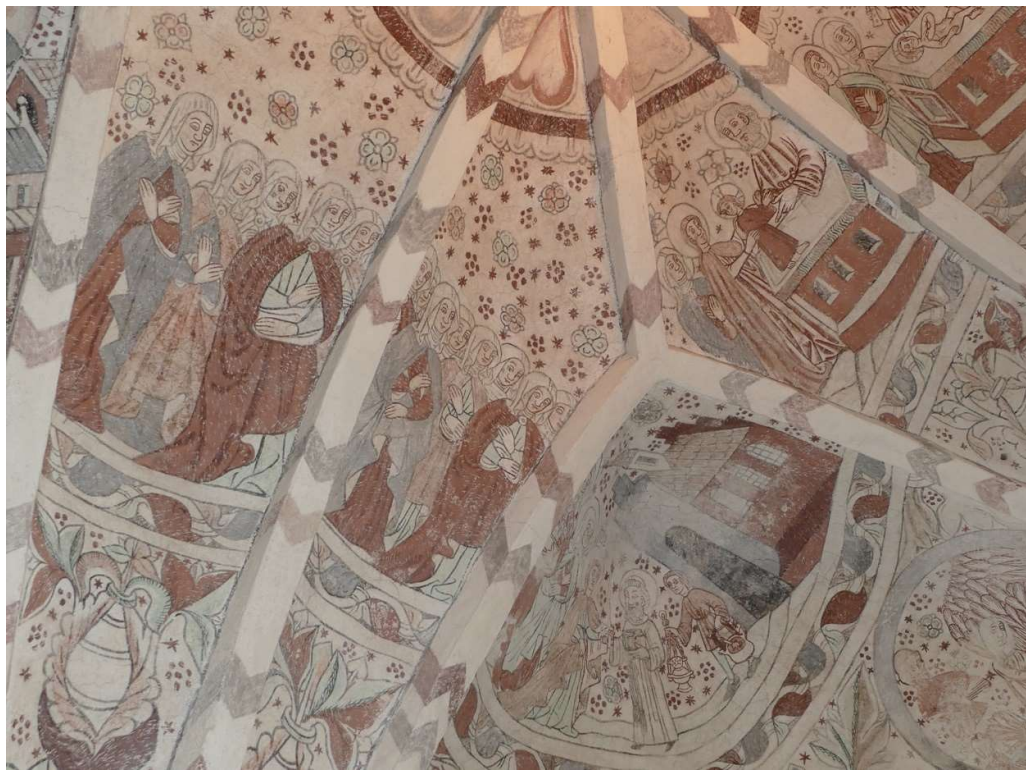
I långhusets östra valv skildras Jungfru Maria kyrktagning som har bedömts bära likheter med hur ritualen faktiskt utfördes i Skåne vid tiden; Maria har sällskap av en stor grupp kvinnor. Utanför kyrkan möter de prästen som bär på ett tånt ljus, och en korgosse som bär på vigvatten. Kalkmålningen tillskrivs Vitskövlegruppen och målades på 1470-talet.