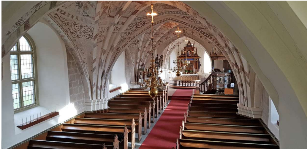
Utblick från orgelläktaren i väster över långhus och kor.

Gördel- och sköldbågar mellan valven och mot ytterväggarna är spetsbågiga. Valvribborna är kvadratiska och något avsmalnande nedtill. Valvkappornas senmedeltida bemålning återger bland annat skapelseberättelsen. Här finns även slingrande blomstermönster och ränder i rött och svart på ribbor, gördel- och sköldbågar. I det östra av långhusets valv skildras Jungfru Marias kyrktagning så som ceremonin kan ha gått till i en samtida skånsk sockenkyrka.