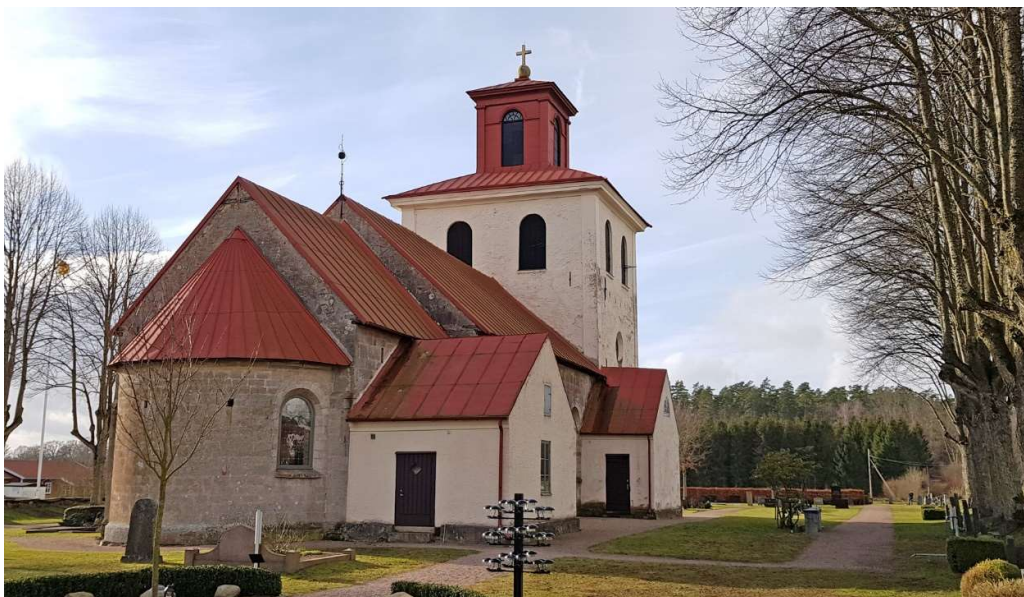
Norra Strö kyrka från nordost.

väster, med en uppgång till kyrkans vind på östra fasaden. Båda dörrarna är moderna med stående, brunmålade paneler. Ingången till sakristian finns på östra sidan, även denna dörr är sentida, med ett rombformat fönster i övre delen.