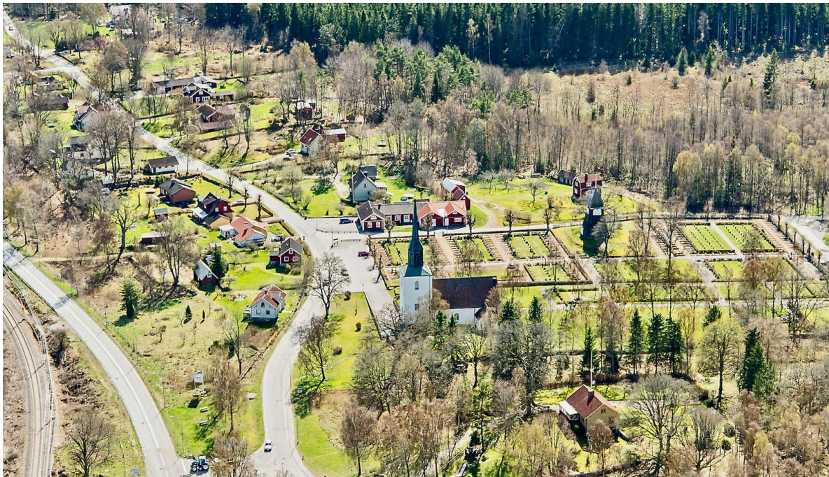
Flygbild över Sillhövda kyrkoanläggning 2014, tagen från norr.

Sillhövda har historiskt tillhört Fridlevstads socken men fick likt flera av de avlägset belägna orterna i landskapets norra del eget kapell under 1700-talet för att under 1800-talet bilda egna församlingar. Utvecklingen var en naturlig följd av befolkningsökningen under 1700- och 1800-talen.