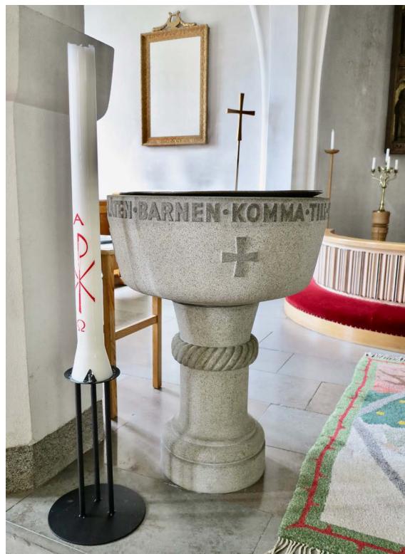
Dopfunten från 1945.

Kyrkan bevarar i stor utsträckning fast inredning och inventarier från tiden för uppförandet. Föremålen är som del av den välbevarade helhetsmiljön av högt kulturhistoriskt intresse. Detta gäller inte minst belysningsredskapen, där mässingslampetterna och merparten av ljuskro-