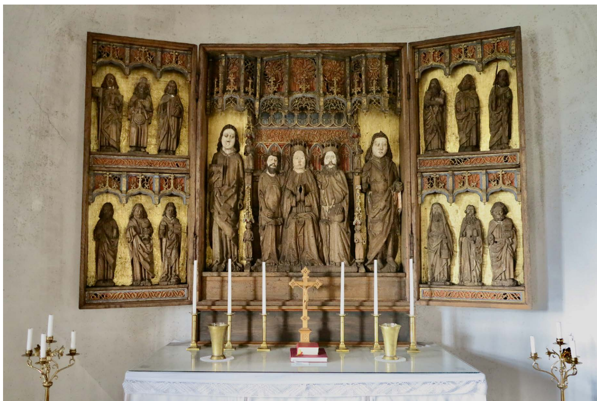
Altarskåpet är ett tyskt arbete från sent 1400-tal.