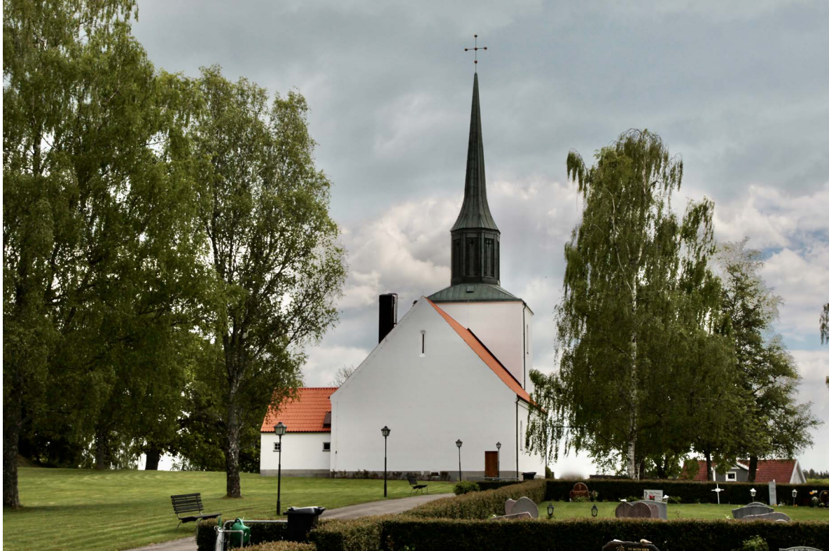
Kyrkan från väster.

granittrappa. Dörrbladet är klätt med samma typ av ekpanel som huvudentrén och är placerat indraget i en rakt avslutad nisch. Ovanför entrén finns en lykta lika de vid huvudentrén och högt i gavelröset en ventilationsglugg utformad som ett grekiskt kors. I korets västfasad långt till söder återfinns nedgången till källaren genom en dörr lika prästingångens men vänsterhängd. I sockeln strax norr om dörren sitter ett litet rektangulärt och ospröjsat fönster. Gavelröset har en smal och rundbågig nisch med en mycket smal ventilationsglugg.