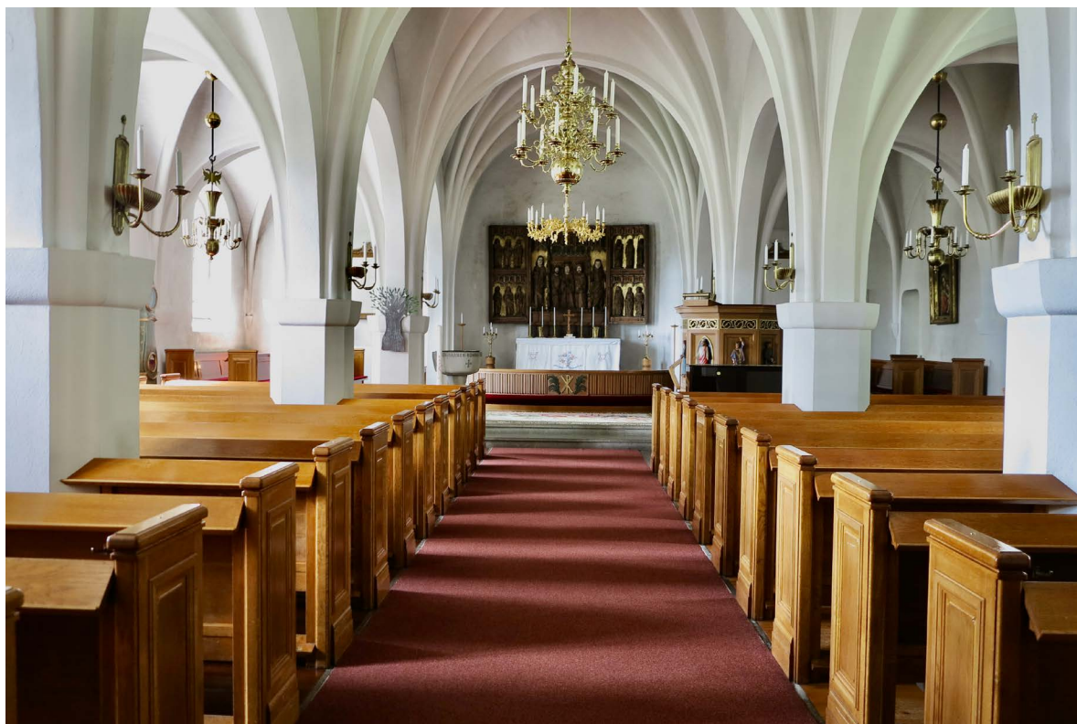
Kyrkorummet mot koret i väster.

Till sakristian norr om koret leder en rakt avslutad murverksöppning med rundade övre hörn in till en kammare där ett litet kvadratisk fönster i väster är försett med en blyspröjsad glasmålning med madonnan och barnet-motiv. Sakristian öster om kam-