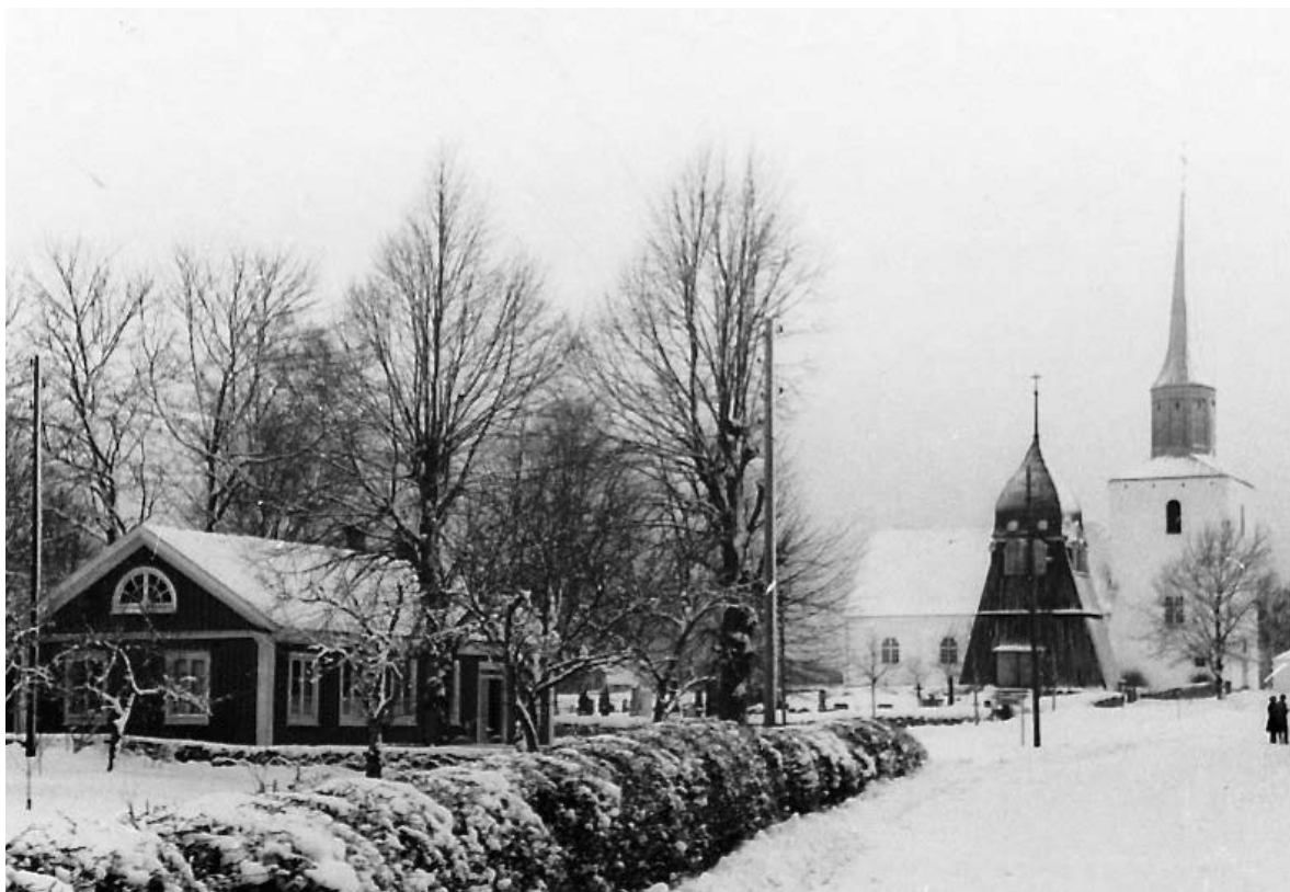
Sillhövda kyrka fotograferad någon gång innan klockstapelns flytt 1955, med sockenstugan till vänster i bild.

i Stockholm, är utöver ett antal bostadsprojekt främst känd för att ha ritat ett 50-tal bensinstationer för Svenska BP. Kockums ritningar för ny kyrka i Sillhövda godkändes 1942 men till följd av restriktioner för byggverksamhet under andra världskriget dröjde det till november 1943 innan arbetena kunde inledas. Drygt två år senare, andra söndagen i advent 1945, kunde biskop Rohde inviga den nya helgedomen som utgjordes av långhus med fullbrett kor och underliggande pannrum i väster, torn i öster samt sakristia norr om koret. Därtill hade ett bårhus uppförts nordost om kyrkan. Det treskeppiga kyrkorummet var slaget med kryssvalv och genom en stor valvbåge öppen mot orgelläktaren i tornets andra våning, det sistnämnda ett grepp som också återfinns i Kockums tidigare kyrkor.