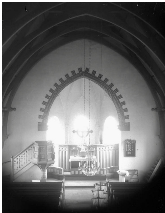
Interiören fotograferad 1915. I koret är sakristia inrymd bakom skranket och altarringen är betydligt lägre än dagens. Långhuset har betonggolv och något högre takhöjd.

Elektrisk klockringning installeras 1974 och året därpå inköps ny kyrkorgel. 1978 läggs yttertaken om, plåt och tegel byts ut i okänd omfattning. Två år senare byts äldre takhängda armaturer frånsett ljuskronorna ut mot nya armaturer och 1982 tillkommer ljudanläggning. Interiören målas om 1985. Väggar målas vita, invändiga dörrar och foder ljusgrå och taket får sin nuvarande trärena gestaltning när en grågrön färg, möjligen tillkommen vid 1960-talets restaurering, tas bort. Fast inredning omfattas inte av ommålningarna. Kring 1990 tillkommer tillgänglighetsramp vid huvudentrén och 2001 inbrotts- och brandlarm. Året därpå installeras bergvärme och wc inreds i det tidigare pannrummet. 2003 delas utrymmet under läktaren invid trappan av till ett separat rum med lättväggar. På senare år har bänkinredningens sittbänkar breddats och bemålningen bättrats.