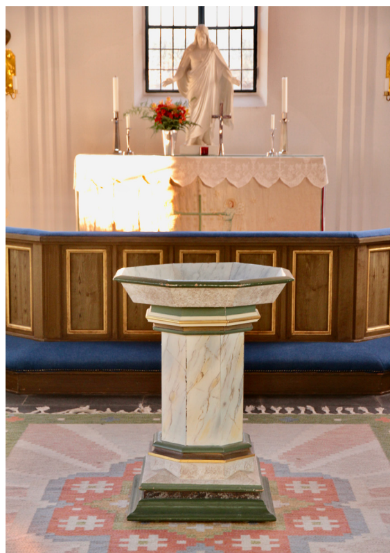
Dopfunten och altaret är samtida med kyrkan medan altarringen tillkom 1965.