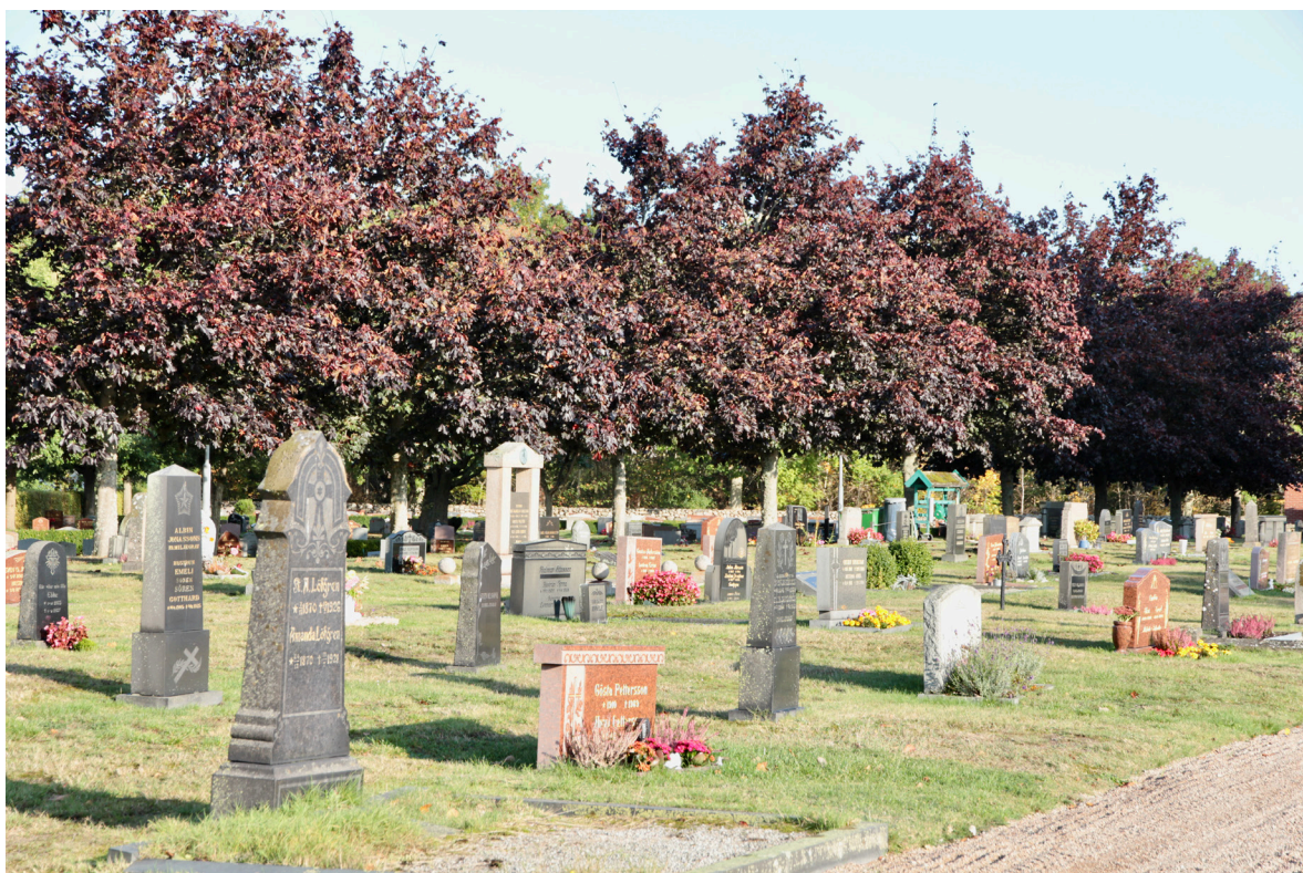
Gamla kyrkogården karaktäriseras av högre vårdar typiska för decennierna kring sekelskiftet 1900 varvade med lägre hållna stenar vanliga från 1930-talet och framåt.

På 1960-talets utvidgning dominerar lägre och bredare vårdar helt. Gravplatserna är delvis ordnade utmed låga rygghäckar av buxbom eller oxbär. Den senaste utvidgningen från 2000 har till större del inte tagits i bruk. Utmed sydvästra gränsen återfinns emellertid både askgravlund och minneslund. Vid den senare finns en högrest minnessten över församlingsbor som avlidit till sjöss. Stenen restes 1968 och har troligen flyttats hit när den nya kyrkogårdsdelen och minneslundan anlades. Kring minnes- och askgravlundan har vegetationen en friväxande karaktär med bland annat björk, ek, rönn och en. På kyrkogården i övrigt är växtligheten begränsad men lövträd förekommer både som solitärer och trädader, dels ek och björk, men även oxel och blodlönn.