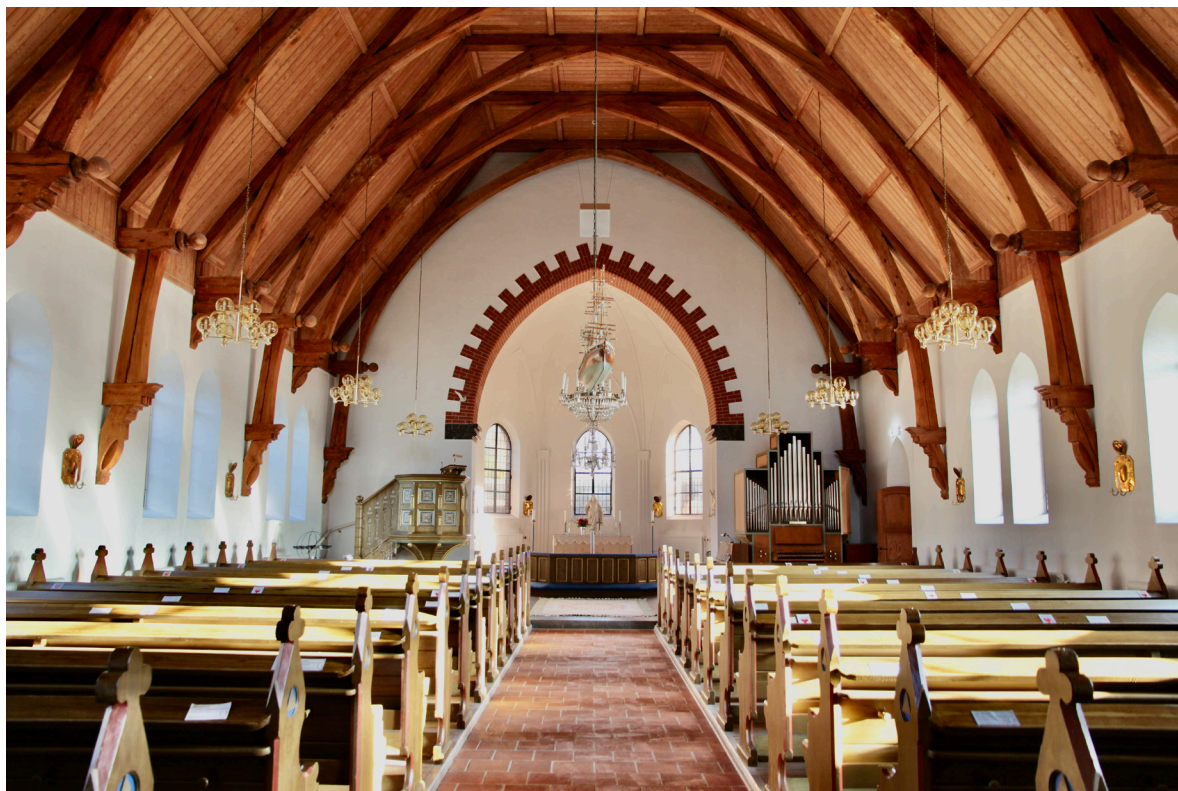
Kyrkorummet mot koret i norr.

Klockvåningen i tornet och kyrkvinden nås via en brant trappa i trä i orgelläktarens sydöstra hörn. Rummet har obehandlat furugolv, vitmenade väggar och taket utgörs av ett av de övre bjälklagen som har brädning av tryckimpregnerat virke. Via gångbryggor kring klockstolen i furu nås en liten lucka i norra väggen som leder in till vinden som endast utgörs av det lilla utrymmet mellan innertak ochnock. En steg leder ner till det mindre utrymme som tillskapades i och med innertakets sänkning och isolering, där en sannolikt ursprunglig bemålning med listverk i rött och blått kan beskådas.