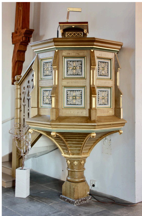
Predikstolen i långhusets nordvästra hörn.

Den öppna bänkinredningen i furu flankerar mittgången i två kvarter. Ryggstöden är uppbyggda av liggande fasspontpanel medan de utpräglade nygotiska figursågade gavlarna kröns av trepass. Bänkarna har sittdynor klädda med orange linneväv, psalmbokshyllor, klädhängare och fotstöd. Sittbänkarna har på senare år breddats. Frånsett denna förändring samt färgsättningen är bänkarna identiska med Aspö kyrkas bänkinredning.