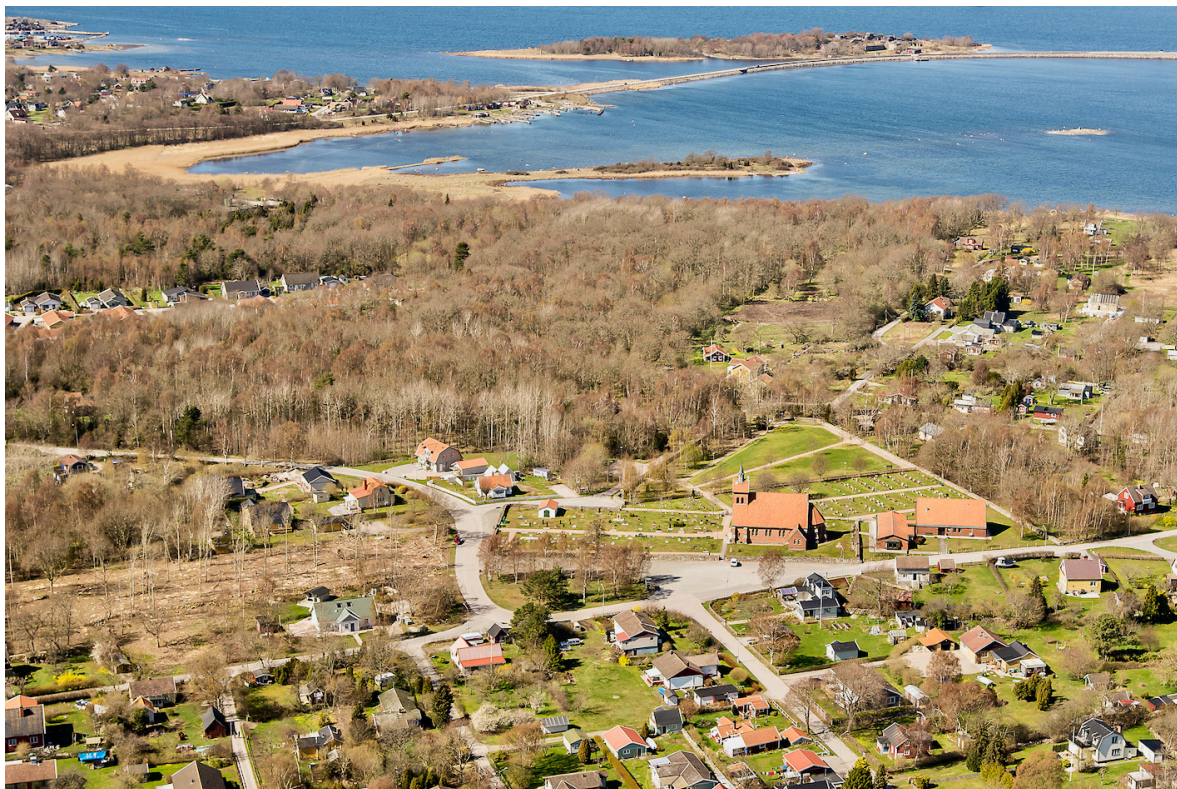
Flygbild över Hasslö 2014, tagen från öster. Norr om kyrkan ligger församlingshemmet och i bakgrunden syns bron mot fastlandet via Västra Hästholmen och Almö (utanför bild).

Hasslö i den blekingska skärgården är en av de så kallade storöarna som skapar det naturligt skyddade hamnläge där Karlskrona anlades under senare delen av 1600-talet. Hasslö kyrka är belägen centralt på Hasslös nordöstra spets, inbäddad mellan villakvarter och lövskogsdungar cirka 500 meter från havet. Kyrkan är uppförd i syd-nordlig riktning, eller mer exakt med koret i nord-nordöst. Orsaken till att den inte uppförts i för kyrkobyggnader traditionell väst-östlig riktning är okänd. Äldre fastighetsgränser kan vara en förklaring, men redan på häradsekonomska kartan 1915–1919 har kyrkans fastighet den diagonala och avvikande riktning den ännu har gentemot kringliggande bostadskvarter. Hasslö har historiskt tillhört Förkärla socken, men 1888 bröt sig Hasslö