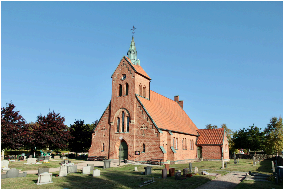
Kyrkan från sydost.

Södra långhusgaveln har två små spetsbågiga fönster som liksom kyrkans övriga träfönster är småspröjsade och vitmålade med mönstermurade flersprångiga omfattningar och kopparplåtsavtäckta solbänkar. Gavelfasaderna pryds, liksom långhusets trappstegsgavel i norr, av stora klöverbladskors och trappstegsformade