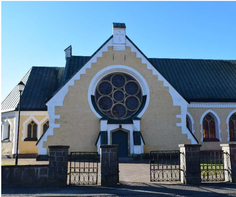
I norra korsarmens gavelsidor finns stora rosettfönster över sidoportalerna.

kontreforter finns i alla hörn samt intill portalöppningarna och är avtäckta med kopparplåt. Fasaderna är också uppbrutna av de många fönsteröppningarna, spetsbågiga på långhuset och trekantsavslutade på absiden. Samtliga är indelade i dubbla muröppningar med en mindre fönsterruta i spetsen och murade masverk av gult tegel. Fönsterbågarna är av gråmålat trä. Korsarmarnas gavelsidor upptas av stora rosettfönster uppbyggda av sju stora rundfönster murade av gult tegel. Hörnkedjorna, samt dörr- och fönsteromfattningarna och är slätputsade i en kvaderimitation och vitmålade. Överst på kyrkans lägre delar finns en slätputsad och vitmålad sågtandsfris eller en rombiskt mönsterfris och gavelspetsarna avslutas med en murad tinne med en liten blindering i form av ett kors eller en stjärna.