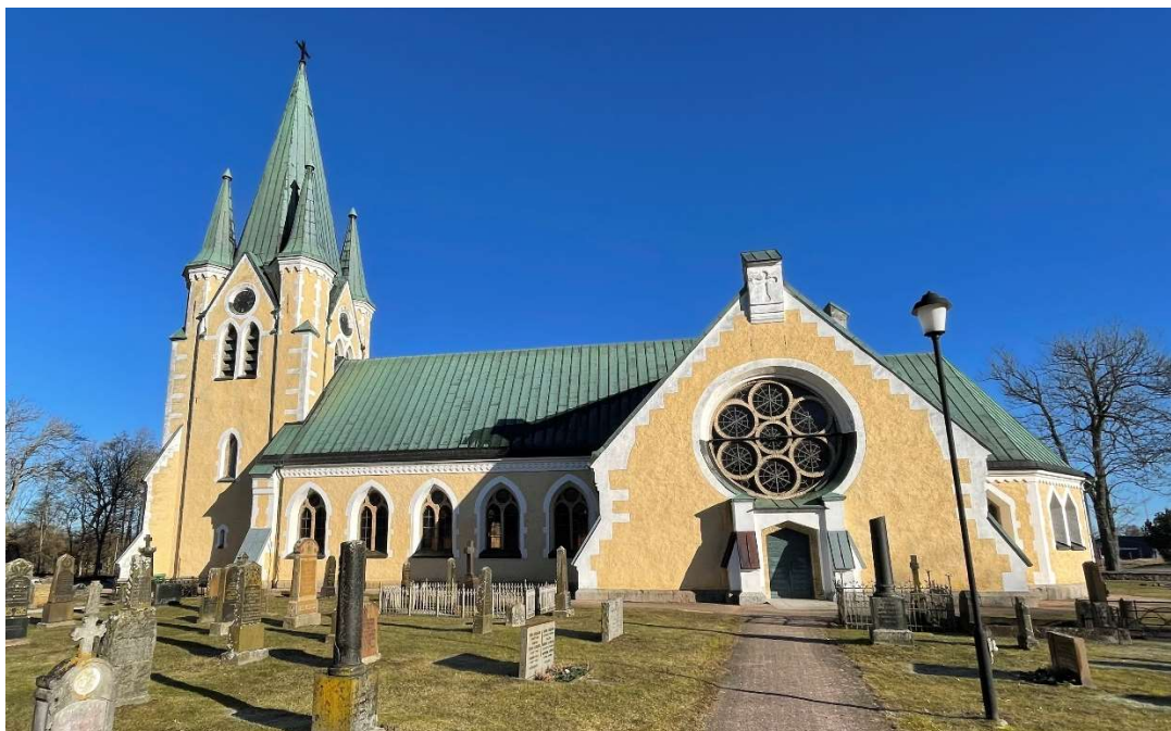
Västra Vrams kyrka från söder.