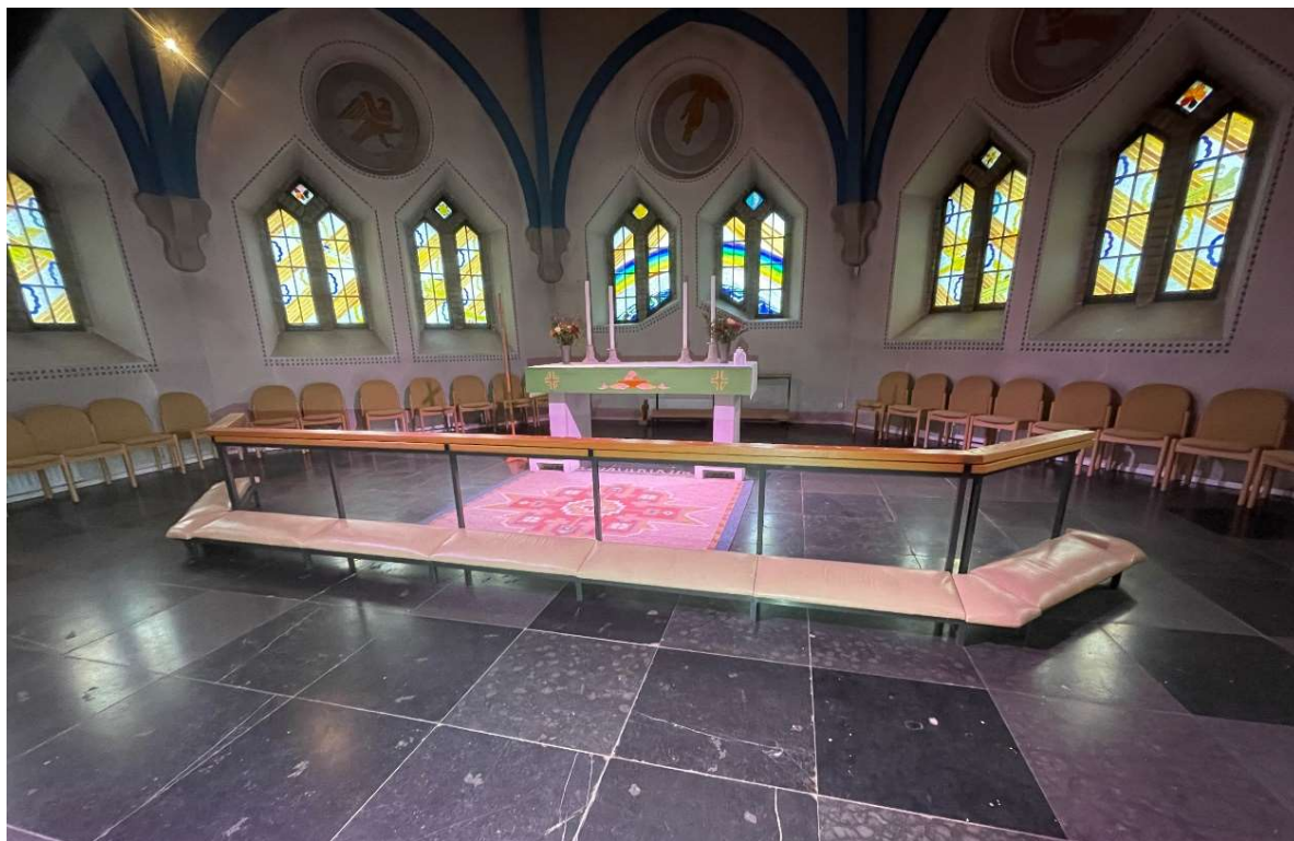
Korets altare formgivet av Acking samt glasmålningar av konstnären Olle Nyman

Bänkinredningen är från 1800-talets ombyggnad och består av öppna bänkar av trä. Gavlarna är utförda med två rektangulära fyllningar nedtill och en fyllning med spetsigt avslut upptill samt kröns av frontoner. Framskärmarna är utförda med omväxlande stående och kvadratiska fyllningar. Ramverket är målat i mörkt grönt med brunrödmålade fyllningar, inramade med en ljusgrön proffillist. Frontoner och psalmbokshyllor är målade i beigebrått.