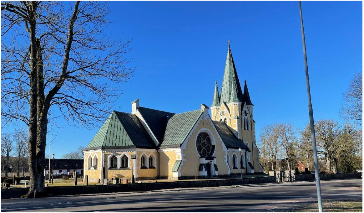
Kyrkan från nordost.

samt beigemålade väggar och tak. De ursprungliga schablonmålningarna bevarades endast i koret. Ljuskrönorna byttes ut till nya elektrifierade mässingskrönor. Utvändigt putsades kyrkan om och målades i gult och vitt likt tidigare.