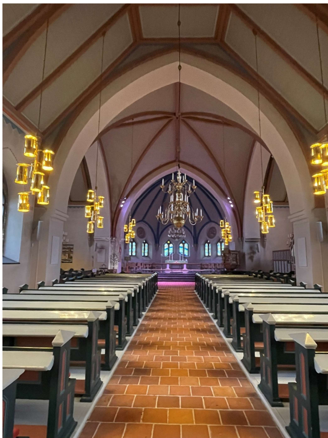
Långhusets sett mot koret i öster.

Innertaket över korsarmar och långhus består av ett högt tredingstak av omålad fur. Takets uppbyggnad liknar ett murat tegelvalv med ribbliknande stomme och valvfack av brädor mellan dessa. Trävalvet har en gotisk utformning med höga spetsbågiga valvbågar som bärs upp av konsoler i ytterväggarna. Valvribborna är målade i tegelrött och valvkapporna i beigegrått.