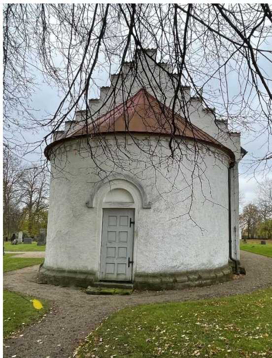
Tornet från väster och absiden från öster.