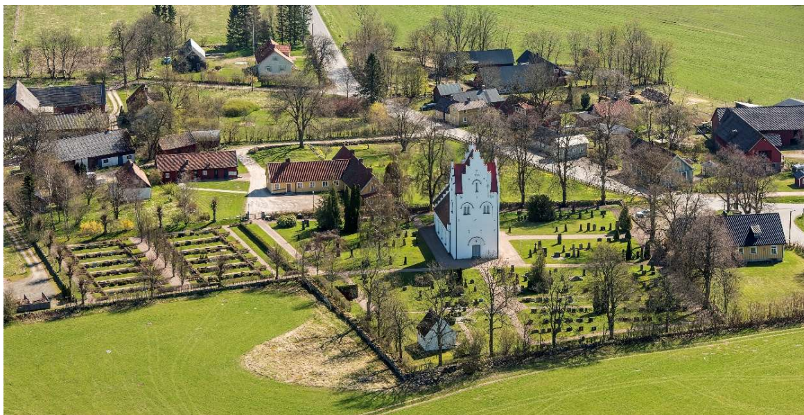
Flygbild över Äsphult med vy från väster, 2015.