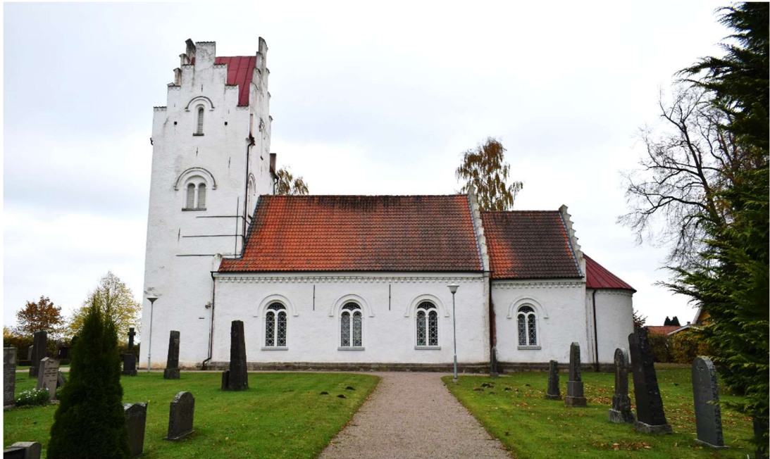
Kyrkan från söder.

flyttades altaret något. I samband med ombyggnaden påträffades både romanska och gotiska kalkmålningar invändigt i kyrkan. De ansågs dock inte värdefulla att bevara och dokumenterades heller inte.