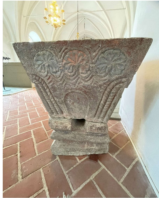
Kyrkorummet mot öster samt dopfunten.

med tandsnittsdekor och överst en druvformad knopp. På undersidan finns en sexpassformad himmel och en nedhängande duva. Predikstolen är målad i beigea nyanser och gråvitt med rosaröda och förgyllda detaljer samt en blåmålad himmel i ljudtaket. Trappan har en enkel form med fyllningsförsedda vangstycken och ett smidesrärke.