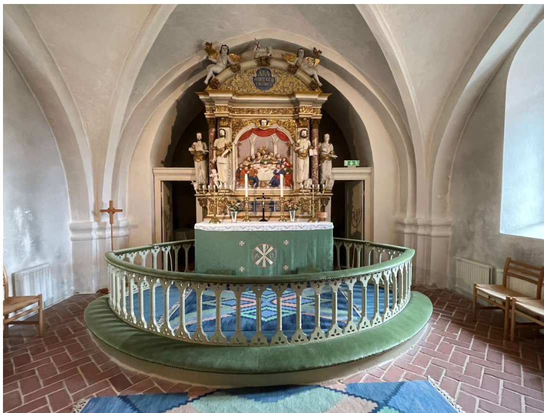
Altarpåställningen i koret.

Långhusvinden domineras av valvens oisolerade ovansida. Inget golvbjälklag eller landgångar finns ovan valven. Murarna har fläckvis bevarad medeltida puts men är i övrigt fogade med brett utstrukna fogar. Ett par romanska fönsteröppningar bevaras som invändiga murnischer med huggna sandstensomfattningar. Taklaget över långhuset är av furu och tillkom 1880 samt delar 1932. En del äldre taklagsvirke av ek finns också bevarat.