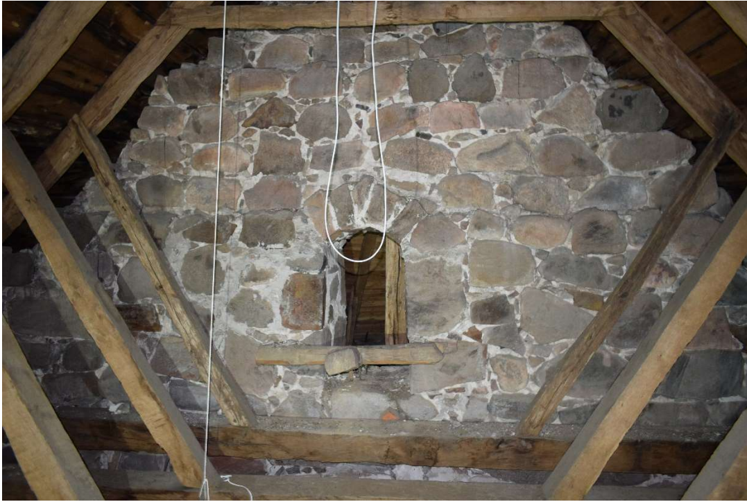
Korvinden sett mot öster och ingången till absiden.