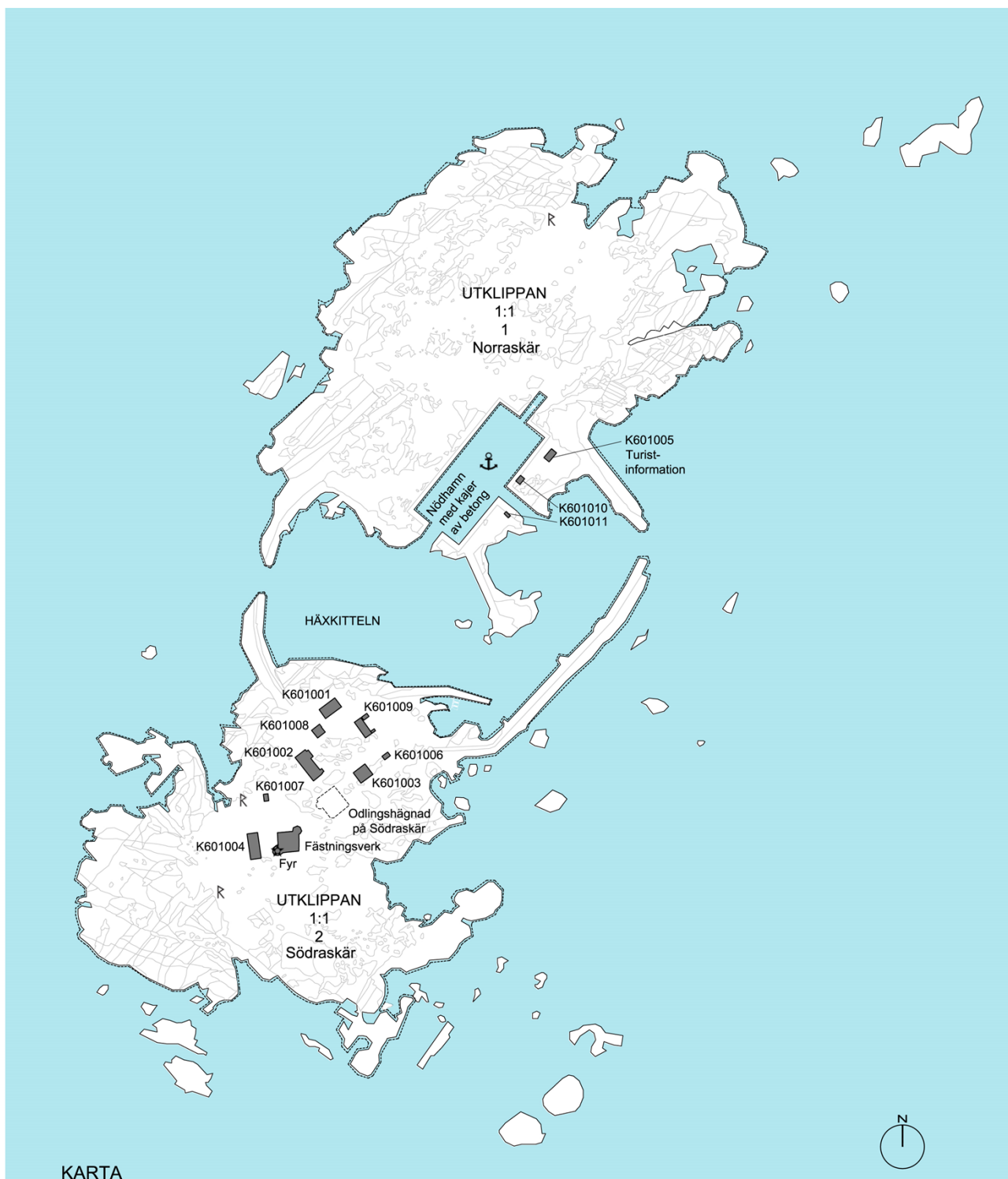
Karta över det statliga byggnadsminnet Utklippans fyrplats med öarna Södraskär och Norraskär. Byggnader och anläggningar är markerade.