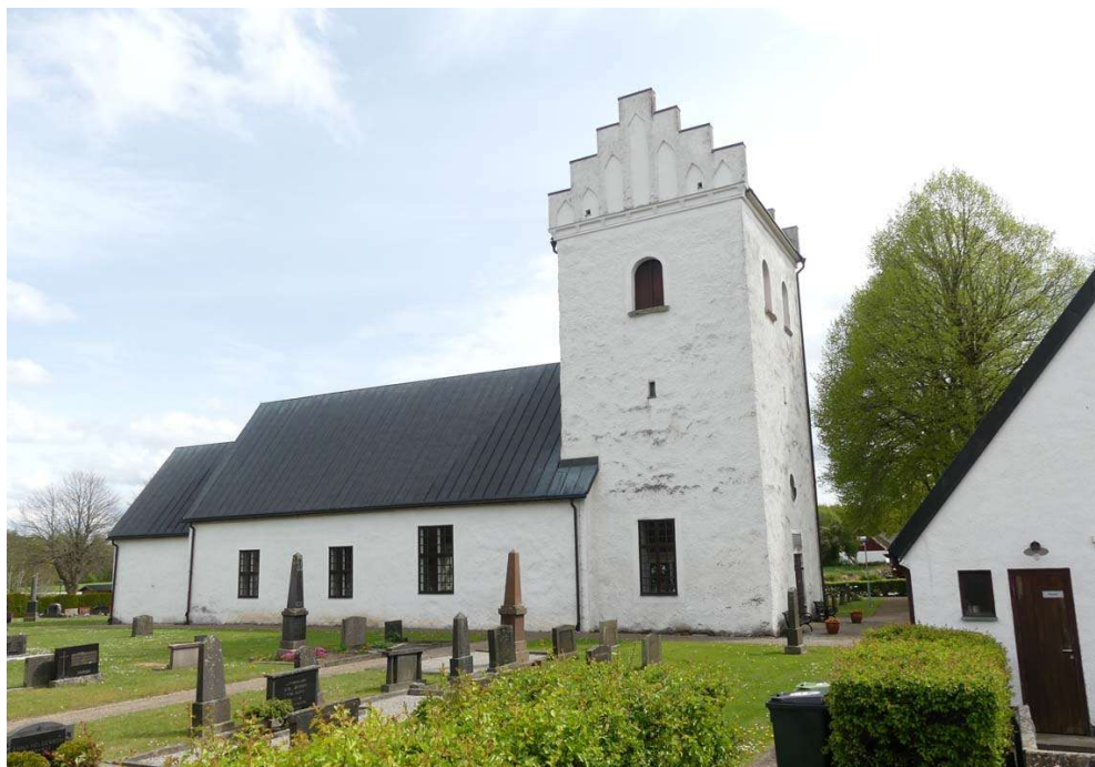
Kyrkan och kyrkogården från nordväst.

i gamla kyrkan. En valvöppning togs upp i murens nedre del vilket förenade långhuset med den nya delen. Vid västförlängningen revs sannolikt den gamla västgavelns övre del. Den nya delen fick innertak i form av ett trätunnvalv och året efter kompletterades med en läktare.