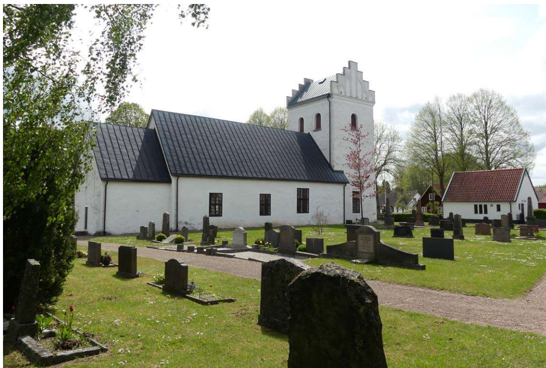
Kyrkan och kyrkogården från nordost.

Intill kyrkogårdens nordvästra hörn ligger ett bårhus invigt 1964 efter ritningar av Länsarkitektkontoret i Kristianstad. Bårhuset har putsade och kalkvittade fasader med sockel av svart skiffer och tak av rött tegel. Dörrarna är av teak och fönsteröppningarna är försedda med gultonat råglas. I södra gavelsidan finns en större port med två dörrblad och en rak omfattning av sten. Över porten finns ett i fasaden försänkt, latinskt kors. Ett fönster och en dörr till ett förråd finns i norr samt ytterligare en dörr till toalett på västra sidan. Fyra långsmala fönsteröppningar vetter mot öster.