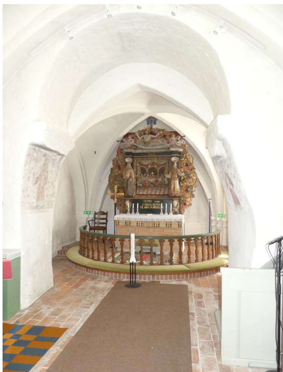
Koret sett från väster genom triumfbågen.

valvkrönet, ytterligare fyra ribbor som löper fram till gördel- och sköldbågarnas mitt och delar in valvet i åtta valvkappor. Både ytterväggarna och tegelvalven är putsade och vitkalkade utan synliga dekormålningar