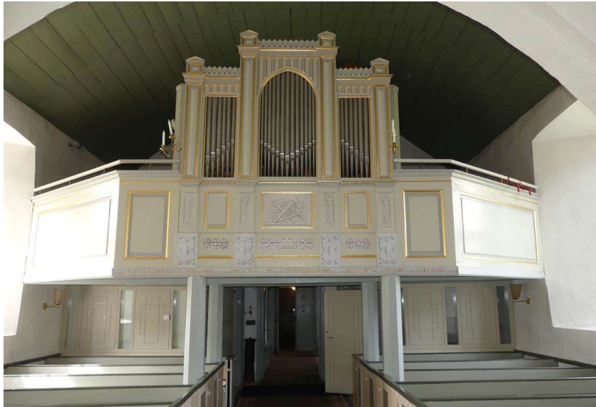
Långhusets västförlängda del är tunnvalvd och upptas av en läktare med underbyggnader för sakristia och barnrum.

Porten är sannolikt från 1852 och består av två dörrblad av plankor täckta av lig-gande, brunmålade pärlspontspanel utvändigt. Insidan av dörrbladen är brunmålade. Ingången till koret från öster består av en liten rakavslutad dörröppning med en modern ytterdörr utvändigt klädd med brunmålade panel. Innanför denna dörr finns en äldre träport som kan vara ursprunglig, dvs, från 1852 då dörröppningen togs upp. Liksom västra ytterporten är den panelklädd och brunmålade.