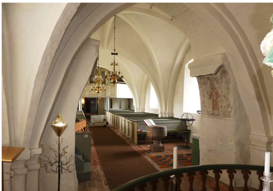
Kyrkorummet sett från koret i öster genom triumfbågen.