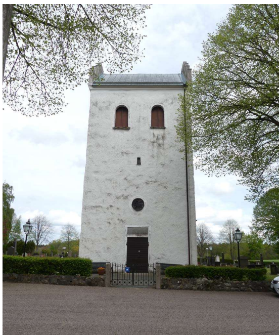
Tornet byggdes 1852 och är försedd med trappgavlar i norr och söder. Huvudingång är från väster.

utgöra någon form av förstärkning av kormuren som tillkommit i samband med grävning för gravvalv i koret. I murhyllan finns några sekundärt inmurade gravhällar.