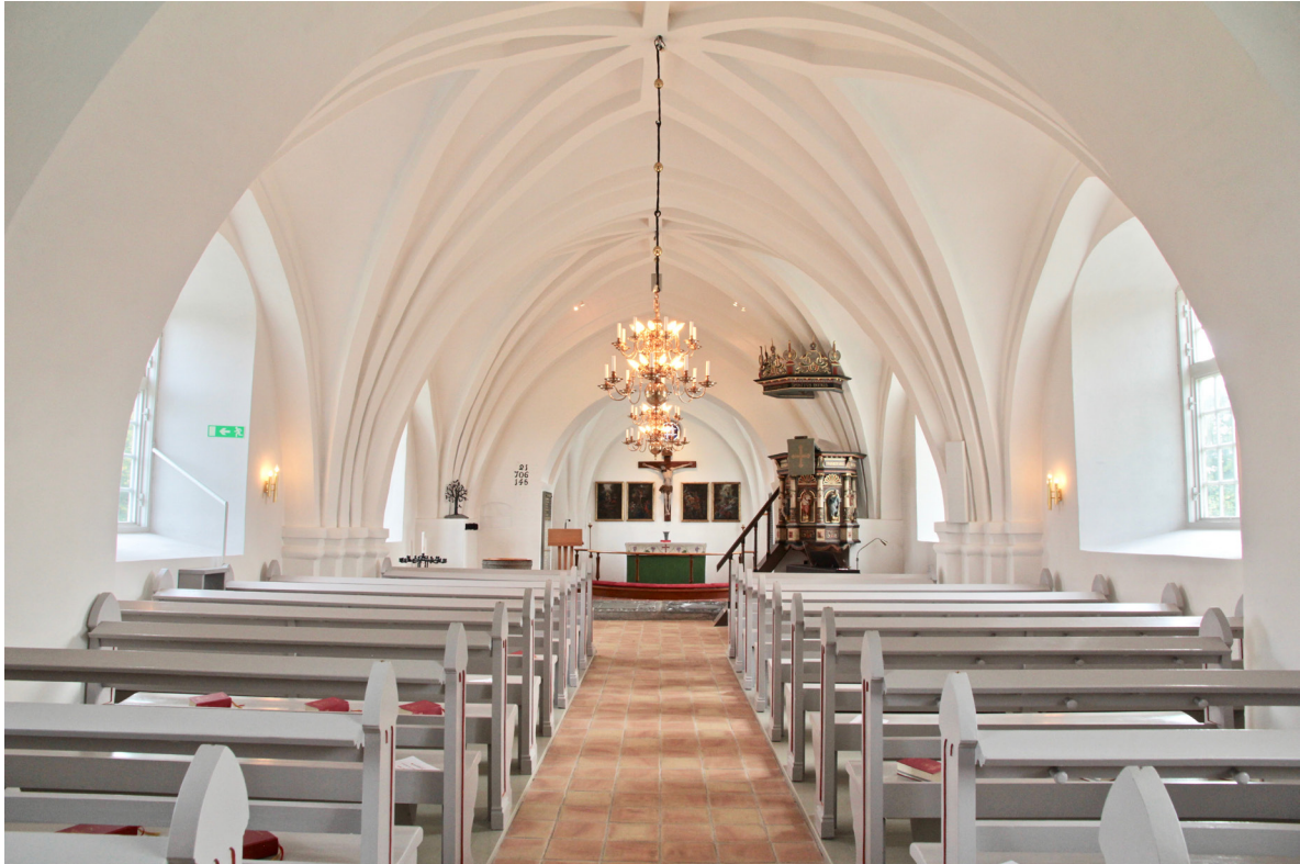
Kyrkorummet mot koret i öster.

våning bärs upp av en träkolonn vars nedre del har oktagonalt tvärsnitt. Träkolonnen ingick i absidens takkonstruktion från 1834 och flyttades till vapenhuset vid restaureringen 1956–58 då absiden revs. Kyrkportens insida är liksom den rakt avslutade pardörren mot kyrkorummet i öster klädd med vitmålad stående panel.