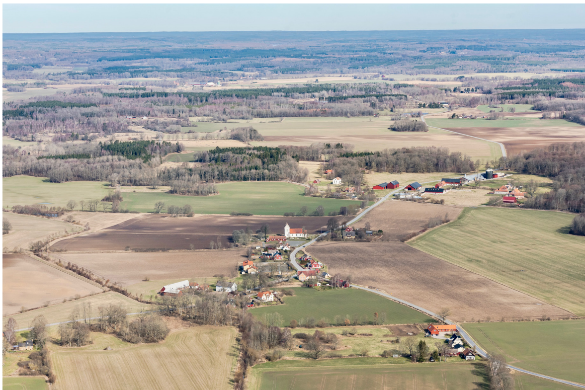
Flygbild över Sörby 2017, tagen från söder.

Säterierna Sörbytorp, beläget strax norr om kyrkan, och Sinclairsholm vid Gumlösa kyrka var länge helt dominerande jordägare i socknarna och 1800-talets skiften fick