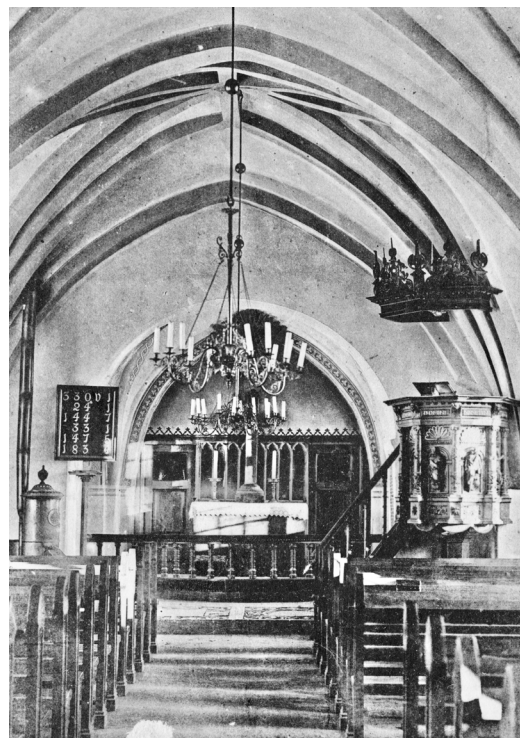
Kyrkorummet fotograferat vid okänd tidpunkt, troligen sent 1800-tal. Två dörrar i korets östvägg leder till sakristian i den bakomliggande absiden.

arkitekt Torsten Leon-Nilson. Exteriört rivs absiden och ett rundfönster i korets östgavel som tillkommit 1798 tas åter upp. Vid underhållsarbeten på fasaderna lokaliserar lägena för de ursprungliga nord- och sydportalerna. Vissa fönster byts ut och samtliga fönster förses med innerbågar. Invändigt påträffas såväl gravkammaren under koret som resterna efter ett medeltida altare, på vars plats ett nytt altare muras upp. Korgolvet beläggs med nytt tegel, ny altarring och nya innerdörrar tillkommer, elektriskt uppvärmningssystem installeras och de gamla rökkanalerna i kyrkorummet rivs. Eventuellt är det också vid denna tidpunkt som bänkinredningen får sin ljusare färgsättning. Ny sakristia samt teknik- och förrådsrum inrättas i vapenhusets södra del. Ny orgel med fasad och ryggpositiv integrerad i ny läktarbarriär ritad av Torsten Leon-Nilson installeras. 1960 förses rundfönstret i öster med glasmosaik utförd av konstnären Karl-Einar Andersson. Leon-Nilson ritar ny pardörr till västentrén som tillkommer 1963 och projekterar 1968 utbyte av dåvarande taktäckning av rödmålad plåt till falsat tegel. Vid exteriöra underhållsarbeten 1972 markeras nord- och sydportalernas läge i fasadputsen.