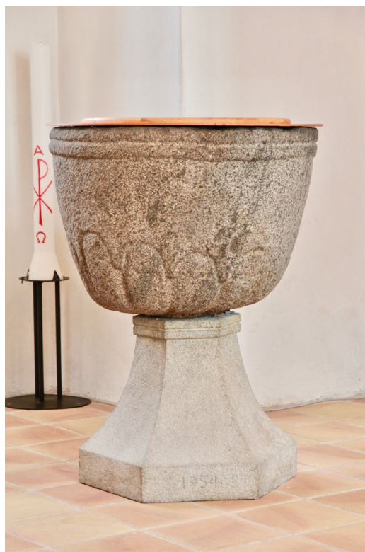
Dopfunten med cuppa som daterats till 1100-talet.

Kyrkans dopfun t har en cuppa i rödgrå granit eller möjligen gnejs som uppges vara från 1100-talet, och i så fall skulle vara äldre än kyrkan. Den runda cuppan pryds nertill av en rundbågefris med godronering och upptill av en enkel bandstav. Cuppan vilar på en klockformad fot i grå granit tillkommen 1954. Ett fotografi från 1926 visar cuppan som blomkruka på Sörbytorp, sannolikt har den återkommit till kyrkan i samband med tillverkningen av den nya foten.