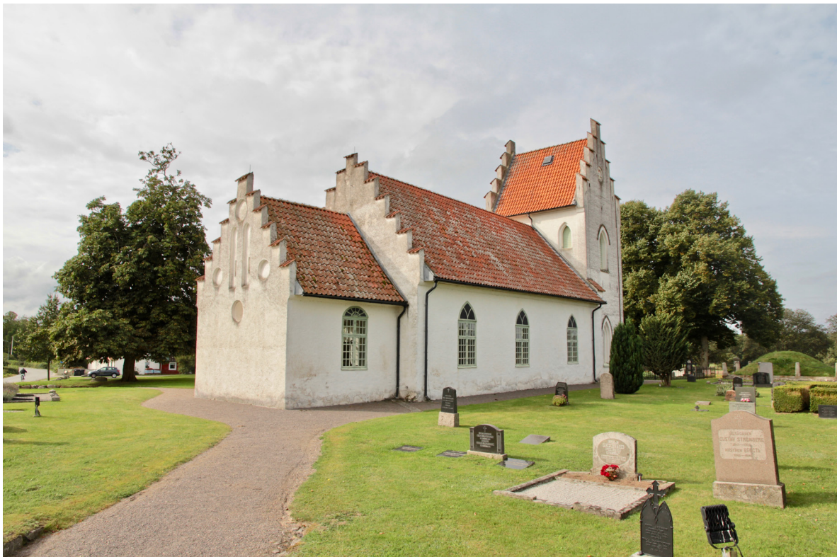
Kyrkan från nordost.

Kyrkans planform utgörs av långhus, lägre och smalare rakavslutat kor i öster samt rektangulärt västtorn. Under koret finns en tunnvalvd gravkammare. I långhusets möte med tornet finns ett förhöjt väggparti, troligen rester från det medeltida västtornet. De ursprungliga byggnadsdelarna, koret och långhusets två östliga travéer, är uppförda i rött tegel i munkförband och skalmurskonstruktion. Murverken i den västra delen av långhuset, som utgörs av det senmedeltida tornets nedre del, är utförda i gråsten med inslag av tegel, sannolikt återanvänt från den ursprungliga västgaveln. Tornet från 1870-talet är murat i tegel. Fasaderna är spritputsade och avfärgade i vitt,