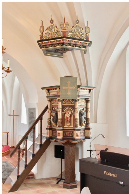
Predikstolen i renässans från 1593 med senare tillkommen baldakin.

Predikstolen av snidat polykromt bemålat trä är tillverkad 1593. Snarlika predikstolar från samma tid finns i bland annat Farstorps, Finjas och Hörjas kyrkor. Korgens sidor pryds av rundbågemotiv med snidade skulpturer föreställande evangelisterna med respektive attribut. Hörnen markeras av kolonnetter med korintiska kapitäl och änglahuvuden som vilar på postament med maskaroner. Mellan dessa finns dels inskriftsfält med latinsk text på svart botten, dels blomsterdekor. Inskriftsfält finns även i det förkroppade överstycket. Nedtill avslutar en skuren lambrekäng och korgen vilar på en sekundär fot med hexagonalt tvärsnitt. Färgsättningen går främst i rött, grönt, blått, grått samt förgyllning. Baldakinen är senare tillkommen och är uppbyggd av ett förkroppat listverk med inskriptioner som kröns av skurna sköldar och tureller. I innertaket hänger en duva.