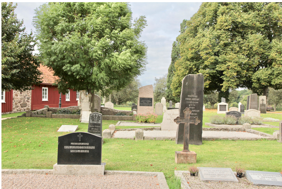
På gamla kyrkogården dominerar äldre högresta och påkostade gravvårdar från 1800-talets första hälft fram till 1920-talet.

Gamla kyrkogården omgärdas av en kallmurad stödmur av gråsten av varierande höjd med ingångar i söder, sydost och nordost. De två senare har pargrindar i smide medan nuvarande huvudingången från parkeringen endast utgörs av en öppning i muren.