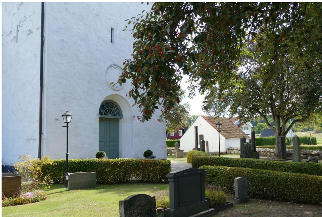
Västporten i Skepparslöv kyrkas medeltida torn.

utsida. Ett fåtal grustäckta gångar finns kvar. De flesta gravplatserna är placerade direkt i gräsmattan. Norr om kyrkan finns flera solitära träd planterade. I nordvästra hörnet gränsar kyrkogården mot den före detta folkskolan och där finns en inkörsväg till kyrkogården. I nordöstra hörnet finns en muröppning med en enkelgrind.