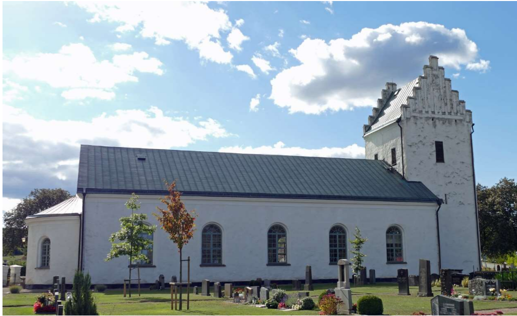
Kyrkan från norr.

Fotografier från sent 1800-tal visar att kyrkorummet var målat i ljusa kulörer, med altarkors, altarring och bänkar i kontrasterande mörk kulör. Uppgifter finns att bänkinredningen år 1865 målades i ”ekefärg” vilket sannolikt var en brun ekådring.