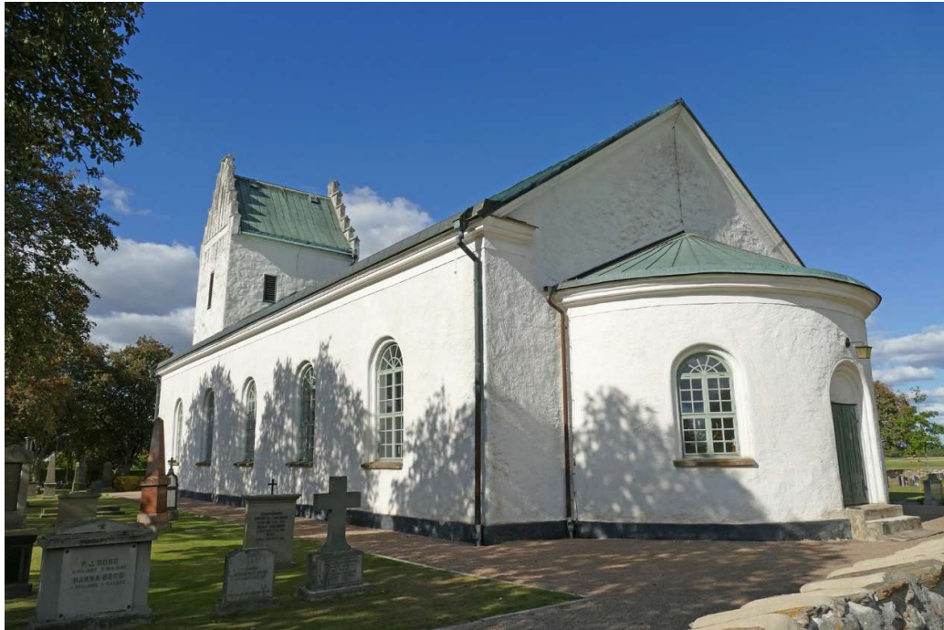
Skepparslövs kyrka från sydväst.