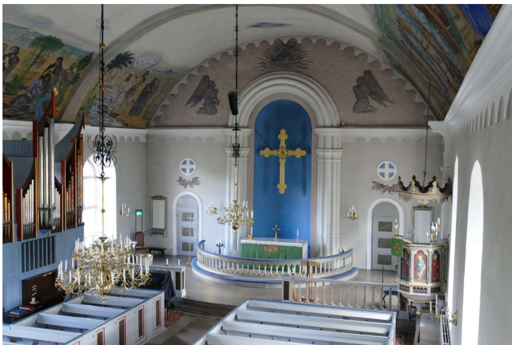
Utblick över kyrkorummet och koret i öster från orgelläktaren.

I tornets andra våning finns långsmala muröppningar för ljusinsläpp. I klockvåningen finns rakavslutade ljudöppningar i samtliga väderstreck, försedda med brunmålade jalousiluckor av trä. I höjd med takfoten finns mindre, rektangulära hål i muren. På västra fasaden sitter en rektangulär, svartmålade urtavla med förgyllda visare och romerska siffror.