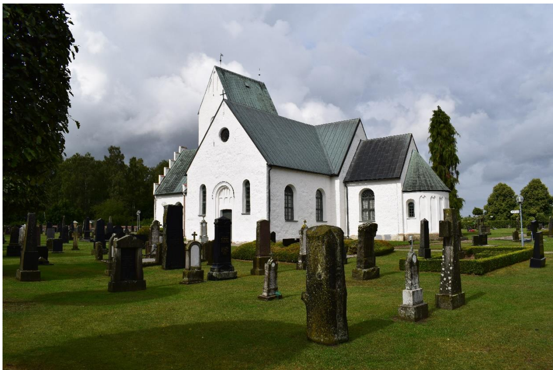
Kyrkan i Gärd's Köpinge från sydost.