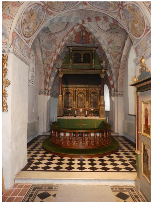
Tornet är mycket smalt och täcks av ett spetsbågigt tunnvalv mellan tornbågarna. I södra muren syns en igensatt öppning. Koret upptas av altaruppsatsen på altaret och altarringen.