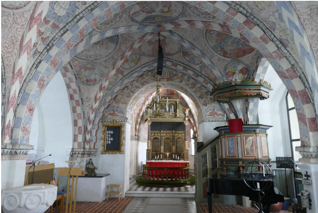
I långhusets korsmitt finns sidoaltare, dopfunt och predikstol