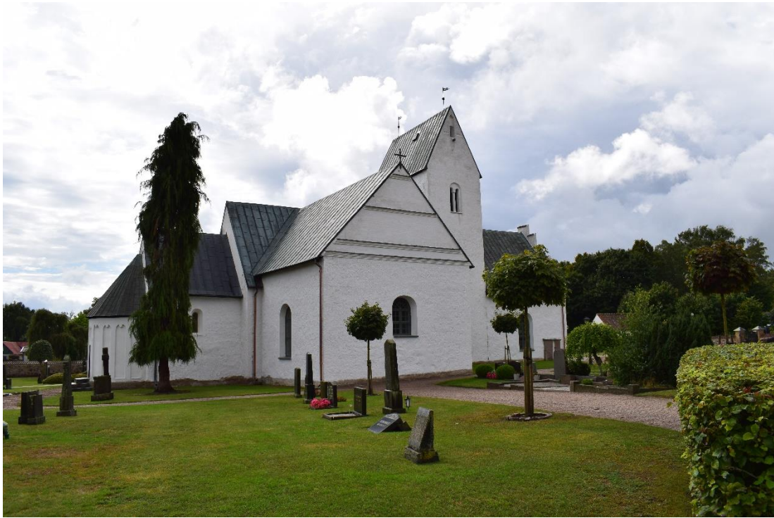
Kyrkan från norr. Vid långhusets norra sida ligger norra korsarmen, byggt som gravkor till Ugerups slott. Gravkoret har tidigare haft en ingång från norr vilken sattes igen när korsarmen inkorporerades med kyrkorummet på 1800-talet.