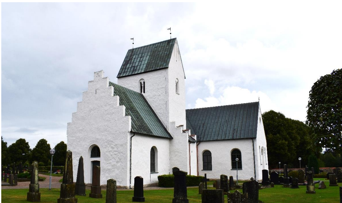
Kyrkan sedd från väster. Närmast i väster är vapenhuset sedan tornet med trapptillbyggnad och södra korsarmen.

Bremers förtrogne och litteräre rådgivare. 1859 renoverades kyrkan och en utrensning av äldre föremål från kyrkorummet gjordes, bland annat i form av en pietàgrupp från 1400-talet och ett triumfkrucifix. Under Böklins tid murade även Ugerups gravkammare igen. Enligt beskrivning från tiden var gravkoret utfört i barockstil och bestod av ett tunnvälvat gravvalv med ett högt korsvälvat utrymme ovanför. Öppningen till gravvalvet och en ingång till gravkoret från norr murades igen och en del av kistorna begravdes på kyrkogården. Korsarmen inreddes därefter till en del av kyrkorummet med bänkkvarter. I södra korsarmen gjordes en läktare och ytterdörren försågs utvändigt med en portalomfattning. Möjligen flyttades även ingången till södra korsarmen då en äldre öppning verkar ha funnits mot väster. Kyrkans fönsteröppningar gjordes också om. Yttertaken lades om med kopparplåt och gavelröstet till norra korsarmen gjordes om.