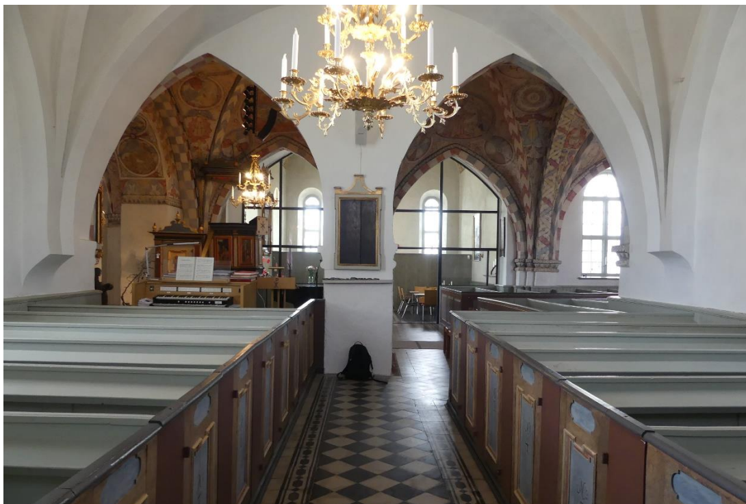
Vy av norra korsarmen sett mot långhuset och södra korsarmen.

mödrar Margareta Axeldotter Brahe och Birgitta Turessdotter Bielke. Epitafiet har tidigare hängt på södra korväggen men flyttades möjligen redan på 1800-talet till södra korsarmen.