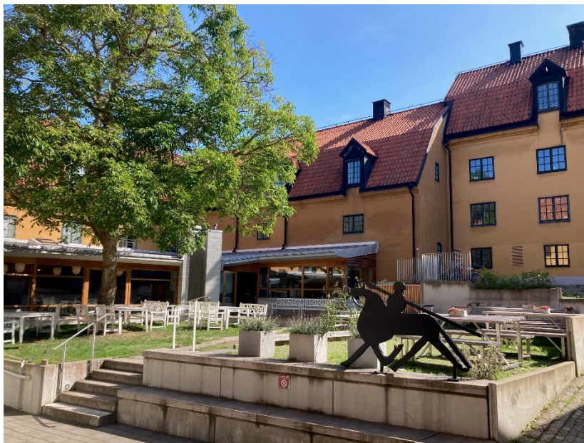
Museet 1 & 2, innergården med byggnad E (bokhållarens bostad) till höger, den lägre byggnad D (kvarnhuset) i bildens mitt och byggnad C (mälthuset) skymtande bakom valnötsträdet och entrétillbyggnaden ET till vänster. Foto: Länsstyrelsen 2023.

Innergården är belagd med smågatsten i den genomgående medeltida grändens sträckning. Andra partier är belagda med betongarmerat gräs och gånglinjer i markbetong. Höjdskillnader tas upp med stödmurar, gradänger och trappsteg i betong från tillbyggnaden i början av 2000-talet. Nära entré- och kafétillbyggnaden (ET) är marken gräsbevuxen med ett valnötsträd.