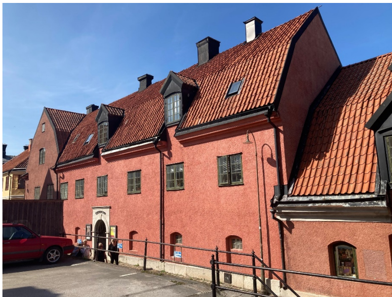
Museet 1 & 2, byggnad E (bokhållarens bostad), med den lägre byggnad D (kvarnhuset) skymtande till höger.

Mot Dubbens gränd i norr är Mälthusets (C) slätputsade gula fasader slutna, med ett fåtal gluggar med järnluckor. Även här finns en rikt artikulerad gesims under det brutna tegeltaket. Takfoten bryts av en äldre takkupa.