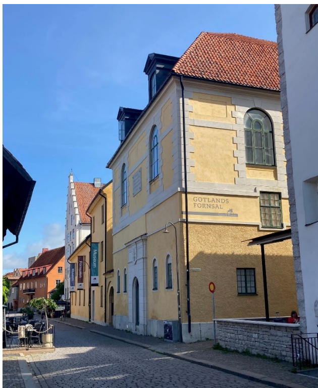
Museet 1 & 2, byggnad G (närmast), A och B (längst bort). Foto: Länsstyrelsen 2023.