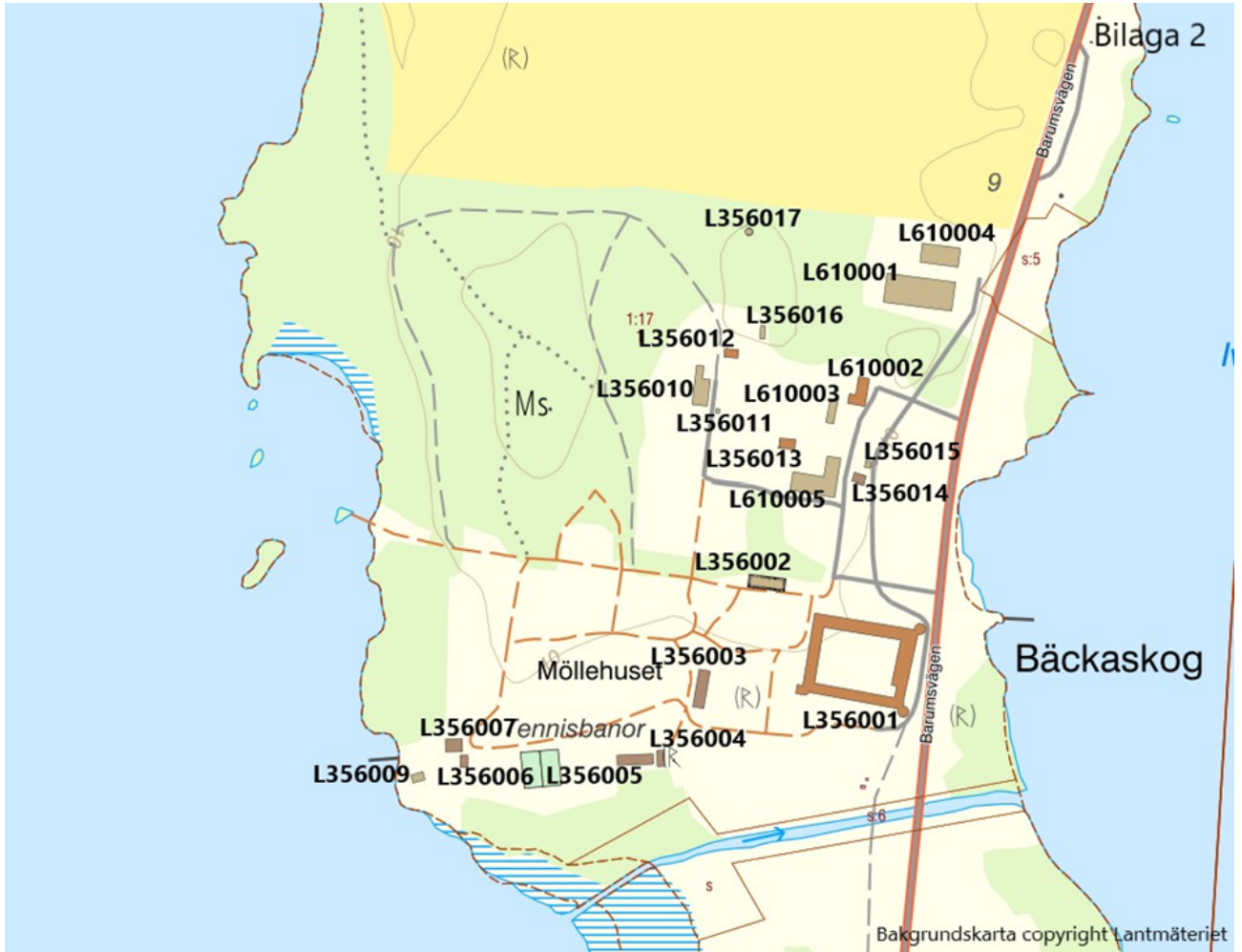
Bilaga 2. Karta med de byggnader som ingår i byggnadsminnet markerade.