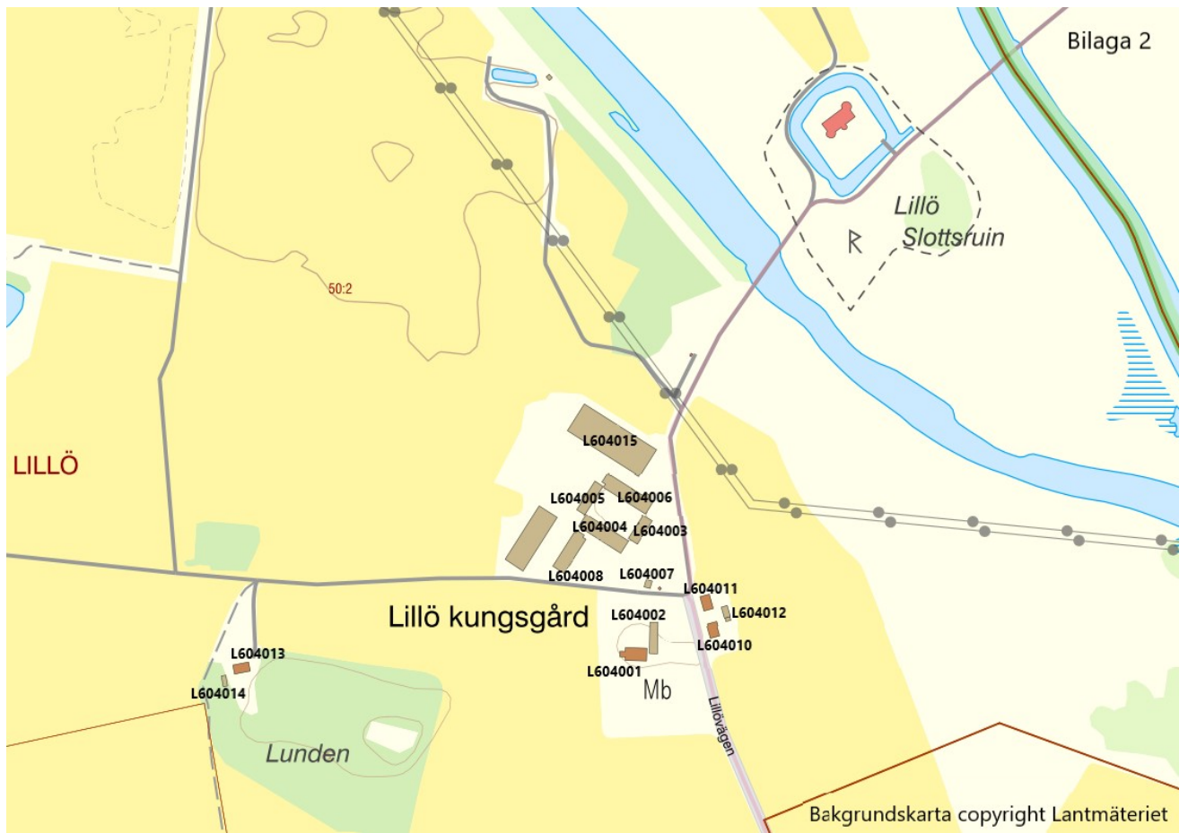
Bilaga 2. Byggnaderna inom det statliga byggnadsminnet.