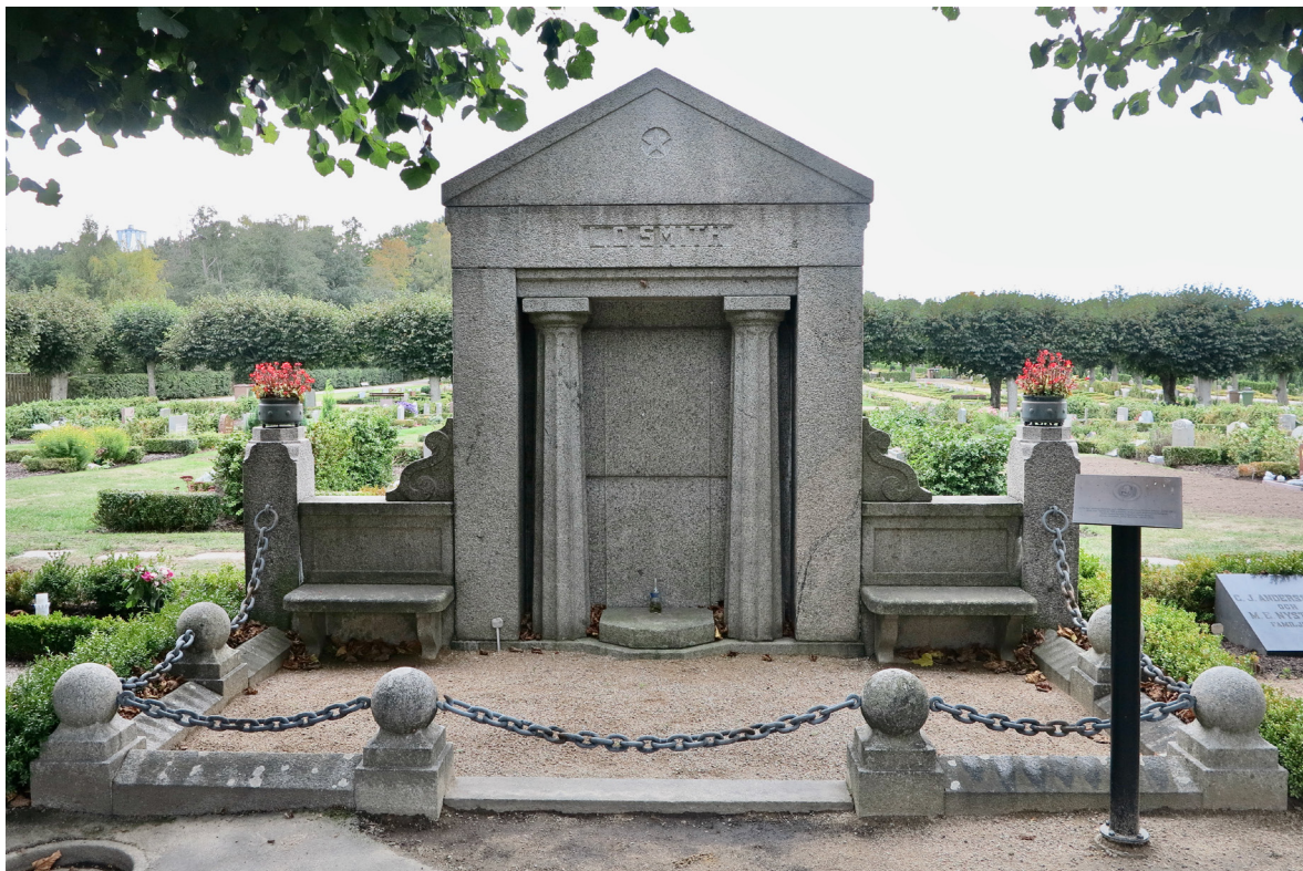
Brännvinskungen L.O. Smiths grav tillhör kyrkogårdens mest monumentala och påkostade.

De äldsta delarna av kyrkogården utgörs av de sex nordöstra kvarteren, som ursprungligen omgärdades av stenvägg och trädkrans och genomlöptes av en allé. Trädkransar fanns även runt varje kvarter. Kyrkogården anlades i sydost-nordvästlig riktning med huvudingång placerad i sydost. Direkt nordväst om kyrkogården uppfördes en bostad för familjen Langwagen som i flera generationer ända fram till 1950-talet ansvarade för skötseln av kyrkogården.