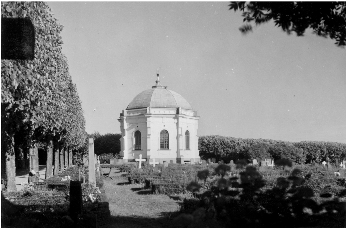
Begravningskapellet 1939.