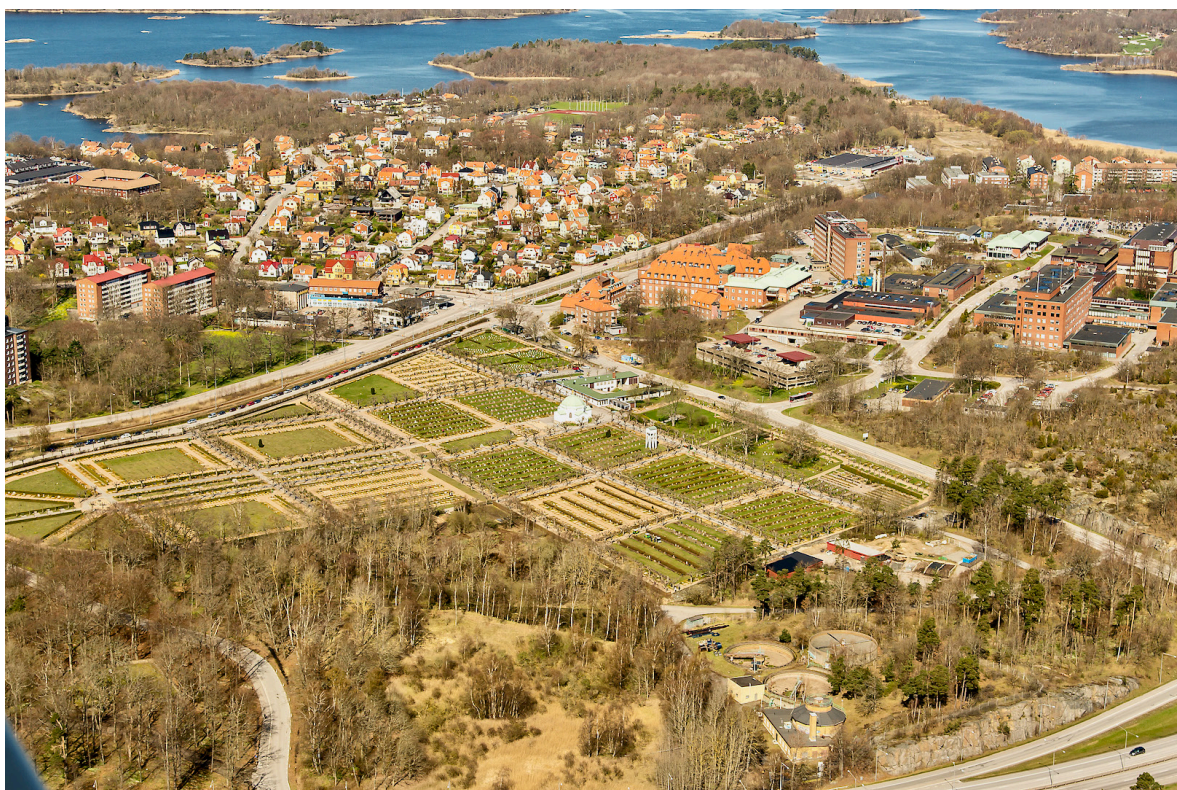
Flygfoto över Vämö begravningsplats 2014, tagen från söder. Den en gång lantliga närmiljön har med tiden ersatts av bebyggelse av varierande karaktär. Nordost om kyrkogården syns Blekingesjukhuset.

När örlogsstaden Karlskrona anlades på 1680-talet behövdes mark för jordbruk och djurhållning tas i anspråk norr om stadskärnan på Trossö. På den större Vämön närmast fastlandet utvecklades med tiden ett system med så kallade stadsfarmar – arrendegårdar på stadens mark. En kort period under stadens uppförande fanns provisorisk hamn för örlogsflottan på Hästös södra del och varv på motsatta Vämöstranden. Verksamheterna flyttades efter fem år till Trossö, men i anslutning till varvet lär ha funnits en kyrkogård och på Vämö fanns under de kommande århundradena begravningsplats för Amiralitetsförsamlingen, en så kallad fattigkyrkogård samt epidemikyrkogård.