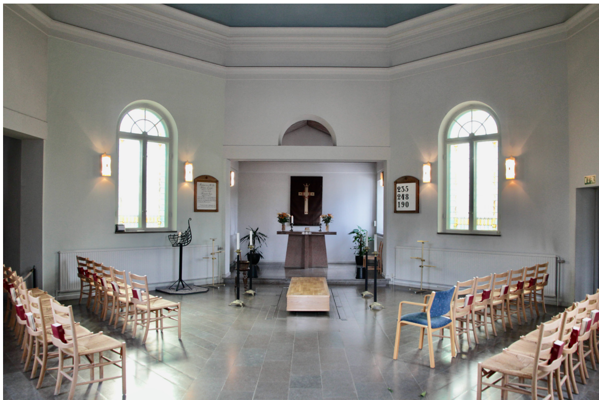
Kyrkorummet mot koret i sydvästra korsarmen.

Genom pardörrarna i nordöstra korsarmen nås en förhall där den bevarade ursprungliga entrén leder vidare in i kapellet. Entrén utgörs av en ljusgrå pardörr i ramverkskonstruktion med lunettformat och radiellt spröjsat överljus. Även delar av den tidigare putsdekoren kring porten i form av lisener och palmettblad är bevarad. Såväl det ursprungliga kapellet som korsarmarna har golvbeläggning av rektangulär