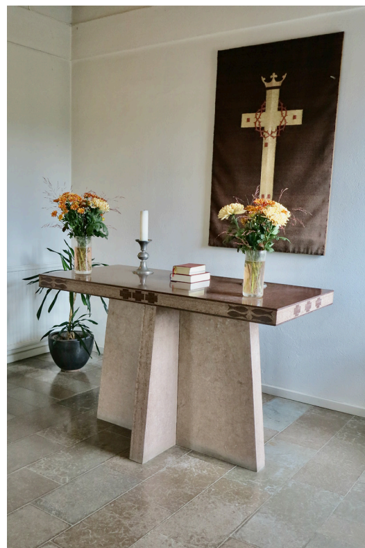
Altaranordningen med altare i kalksten.