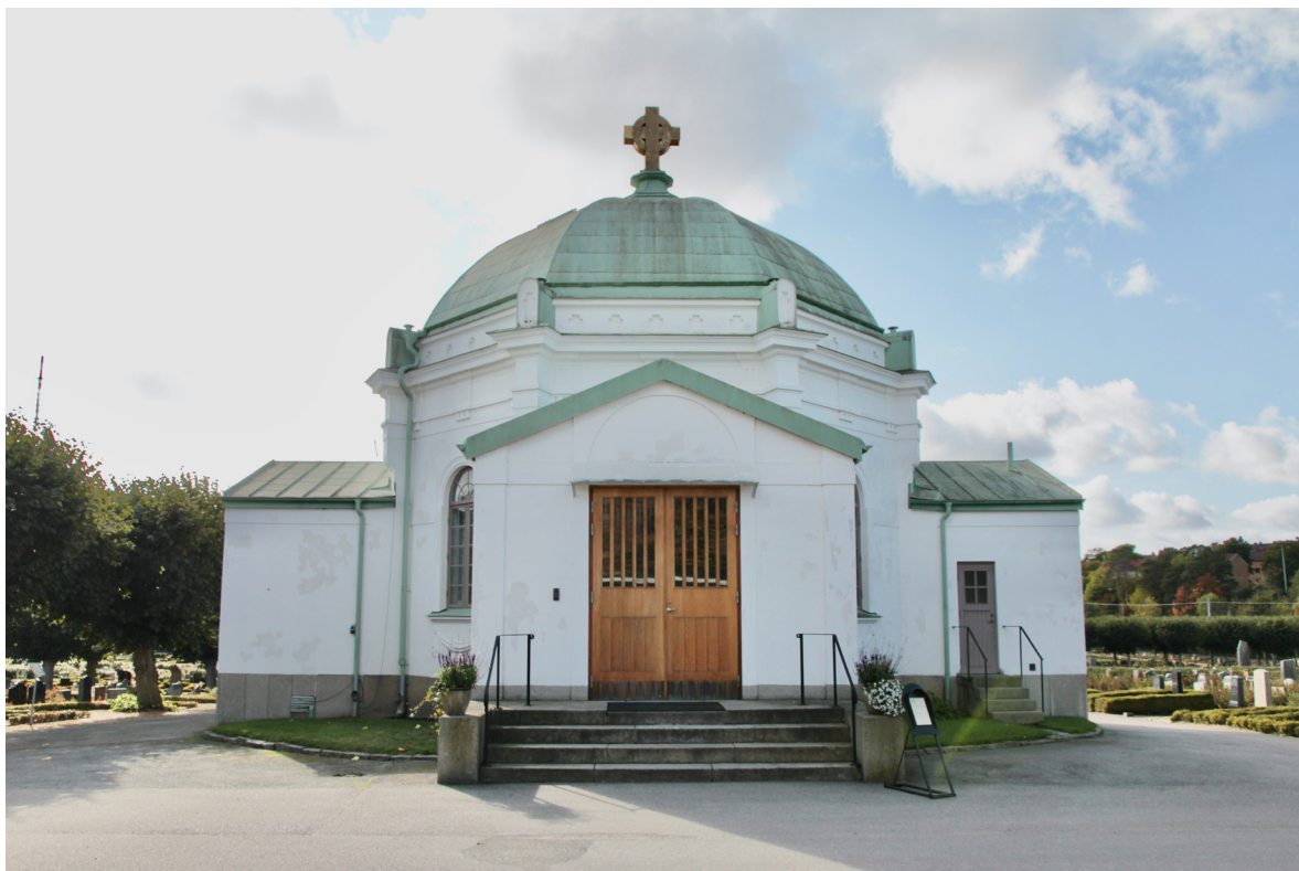
Huvudentrén i nordöstra korsarmen.

Kapellet har planformen av en oktagon med senare adderade korsarmar. Den ursprungliga byggnadskroppen vilar på en drygt halvmeter hög sockel i finhuggen röd granit och har vitmenade fasader gestaltade i utpräglad klassicistisk putsarkitektur. Hörnen markeras av pilastrar, vars nedre delar numera är inbyggda i korsarmarna. Upptill avslutar konsoler som bär upp ett kraftigt profilerat entablement med triglyffris samt en överliggande takfotslist med kors i lågreliéf. Kapellet täcks av en kupol klädd med kopparplåt i skivtäckning och kröns av ett förgyllt ringkors. De fasader som inte upptas av korsarmar bevarar sina rundbågiga fönsteröppningar med profilerade omfattningar och underliggande festonger. Fönstren har bågar av trä i två stående lufter med upptill avslutande lunettbåge. De två norra fönstren är småspröjsade medan de två södra är blyspröjsade med glasmålningar.