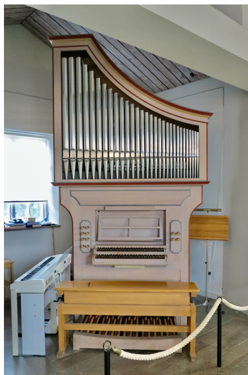
Orgeln tillverkades ursprungligen för Heliga Kors kyrka i Ronneby.

Trossös bergrika markförhållanden begränsade möjligheterna för kyrkogårdar vid stadskyrkorna. För den mer bemedlade delen av innevånarna var det redan från stadens anläggande vanligt att begravas i Ronneby eller andra kringliggande landsortskyrkor. För denna grupp tillkom i och med Trefaldighetskyrkans och Fredrikskyrkans uppförande gravkammare under kyrkobyggnaderna, men i Trefaldighetskyrkans fall kom dess antal kraftigt att begränsas efter stadsbranden 1790. Menigheten begravdes istället i stor utsträckning på den så kallade Gamla kyrkogården på Aspö eller på Fattigkyrkogården på Vämö, där även Amiralitetsförsamlingen hade begravningsplats vid den gamla varvsplatsen. Diskussioner om en ny begravningsplats för stadens alla församlingar hade förts sedan 1790-talet och 1821 beslutades att en sådan skulle anläggas på Vämö. Begravningar i svenska kyrkor hade förbjudits 1810 och utflyttning av begravningsplatser från stadskärnorna var ett vanligt grepp i den förbättring av folkhälsan som skedde i Europa under 1800-talet. Trots detta motsatte sig den allmänna opinionen i Karlskrona länge att deras sista viloplats skulle förläggas utanför staden. Först efter att Tyska församlingen i Trefaldighetskyrkan 1846 uppgått i stadsförsamlingen kunde planerna börja konkretiseras. 1854 inleddes anläggningsarbetena och 31 augusti 1856 kunde Vämö begravningsplats slutligen invigas.