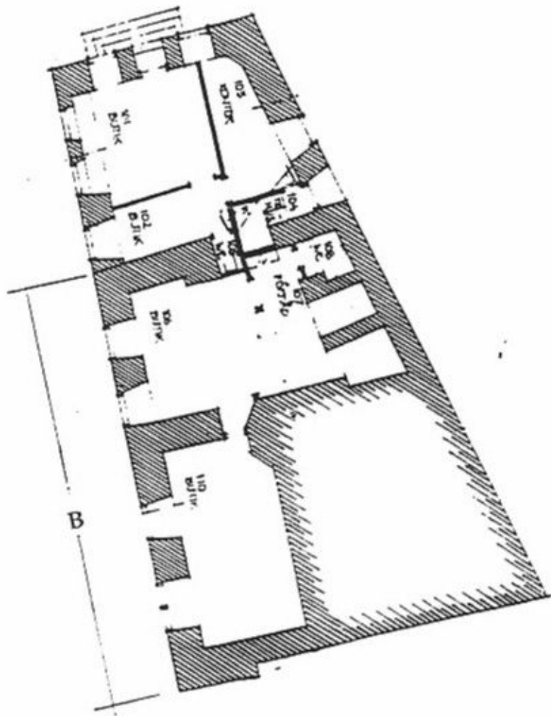
Medeltida murar B (och A) bottenvåningen