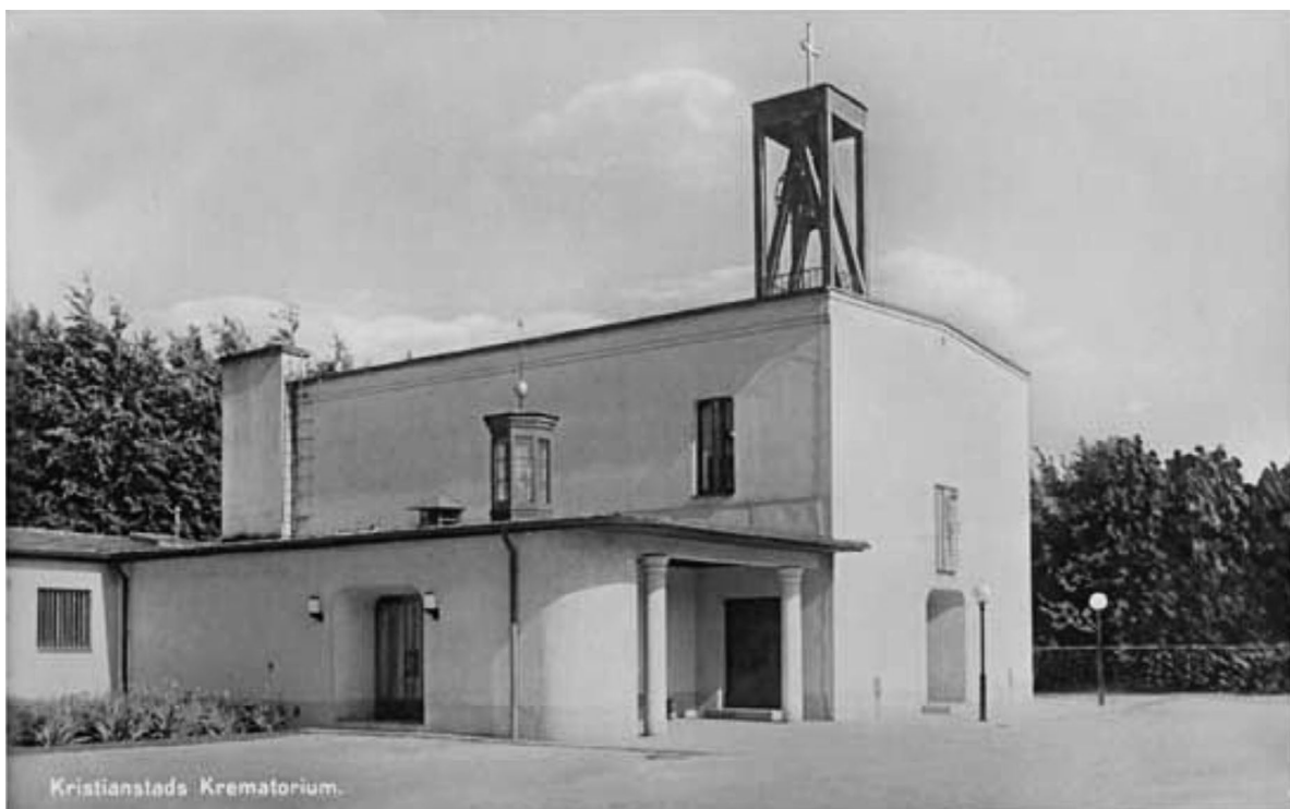
Vykort, sannolikt 1940-tal. Notera den öppna klockstolen samt lågdelen öppna kolonnburna förhall och spirförsedda lanternin. Högdelen fönster delas av en smal kolonn.

1985 genomfördes en större om- och tillbyggnad av lågdelen efter förslag av Owe Rubin Arkitekt och Ingenjörbyrå AB. Omorganisering av rumsindelningen skedde samtidigt som tillbyggnader eller fasadförändringar gjordes åt samtliga väderstreck. Östra fasaden förändrades helt genom att sakristian revs till förmån för en tillbyggnad för kylrum, kremeringsugn, kistintag och lastkaj. I väster revs den pelarförsedda vänthallen, entrén till bisättningsrummet på norra fasaden sattes igen och lanterninen