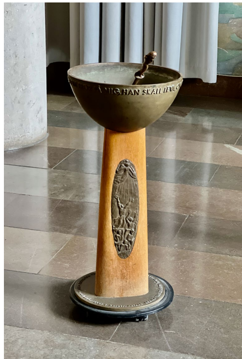
Mullfatet från 1956.