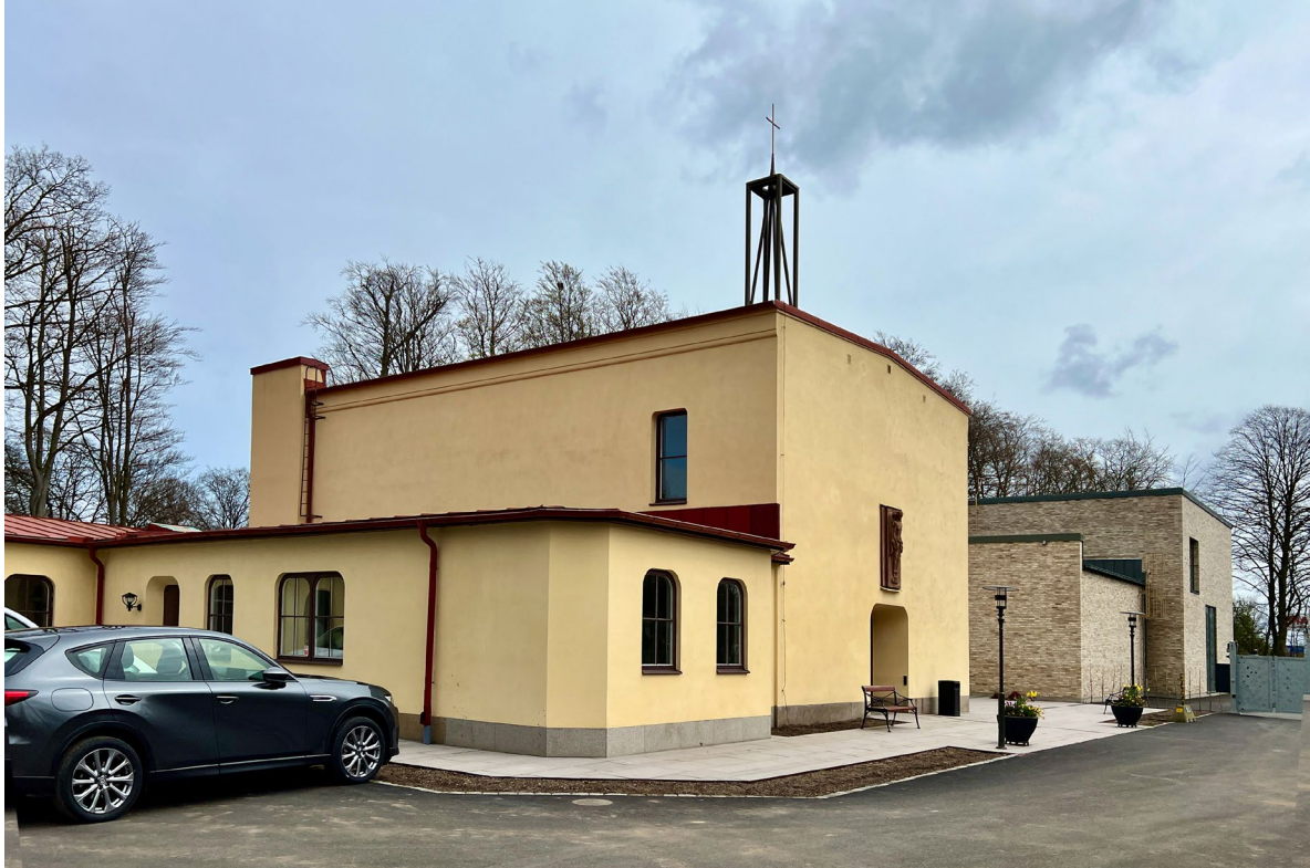
Kapellet med den nya krematoriebyggnaden fotograferade från nordväst.

entréparti finns ett högt placerat ljusinsläpp bakom en framskjuten loggia med två kolonner med akantuskapitel. Högdelen nordfasad har ljusinsläpp till läktarvåningen lika sydfasaden. Östfasaden har inga fönster eller utsmyckningar. Byggnadskroppen avtäcks av ett flackt, närmast plant sadeltak klätt med falsad rödmålad plåt. På nocken över västentrén står en korskrönt spira i lackat stål och hamrat aluminium vars enkla utformning kan ses som en stilistisk replik av det ursprungliga klocktornet, där den lätt uppskjutande "klockbocken" fått en ny funktion som korsbärare.