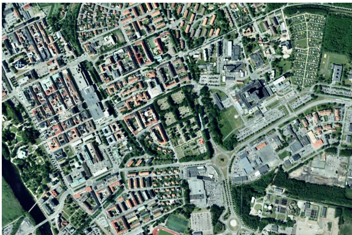
Flygfoto från Eniro.se visar Östra begravningsplatsens nuvarande plats i stadsbilden.

Kristianstadsslätten kring den historiskt viktiga farleden Helge å har med sina lättbrukade jordar och goda tillgång på betesmark varit en jordbruksbygd sedan stenåldern. Från åtminstone senare delen av medeltiden påverkades området av läget nära riksgränsen mellan Danmark och Sverige, med återkommande konflikter. På halvön Allön vid Helge å, som var omgiven av sank våtmark, grundlade Kristian IV 1614 Nordens första renässansstad med vallar, bastioner och rutnätig stadsplan. Kristianstad är idag utpekad som riksintresse för kulturmiljövården, vilket bland annat motiveras av att staden är ett av de främsta exemplen på Kristian IV:s stadsbyggnadskonst.