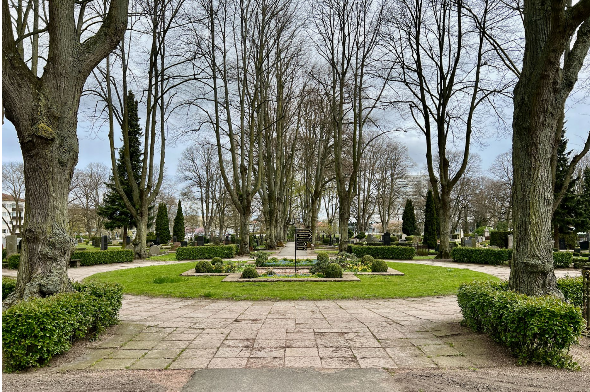
Platsen för det ursprungliga kapellet på begravningsplatsens äldsta del markeras idag av en brunn.

med pyramidklippta hörn och gravplatserna är placerade mot rygghäckar av idegran eller spirea. I vissa kvarter är gravplatserna grusade med lågt klippta infattningshäckar medan gravvårdarna i andra kvarter är placerade rakt i gräset utan omgärdning. Såväl stående som liggande vårdar förekommer. I närheten av klockstapeln som uppfördes 1961 anlades 2018 en askgravlund.