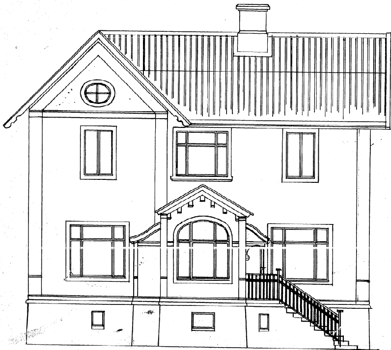
FAÇAD MOT NORR.