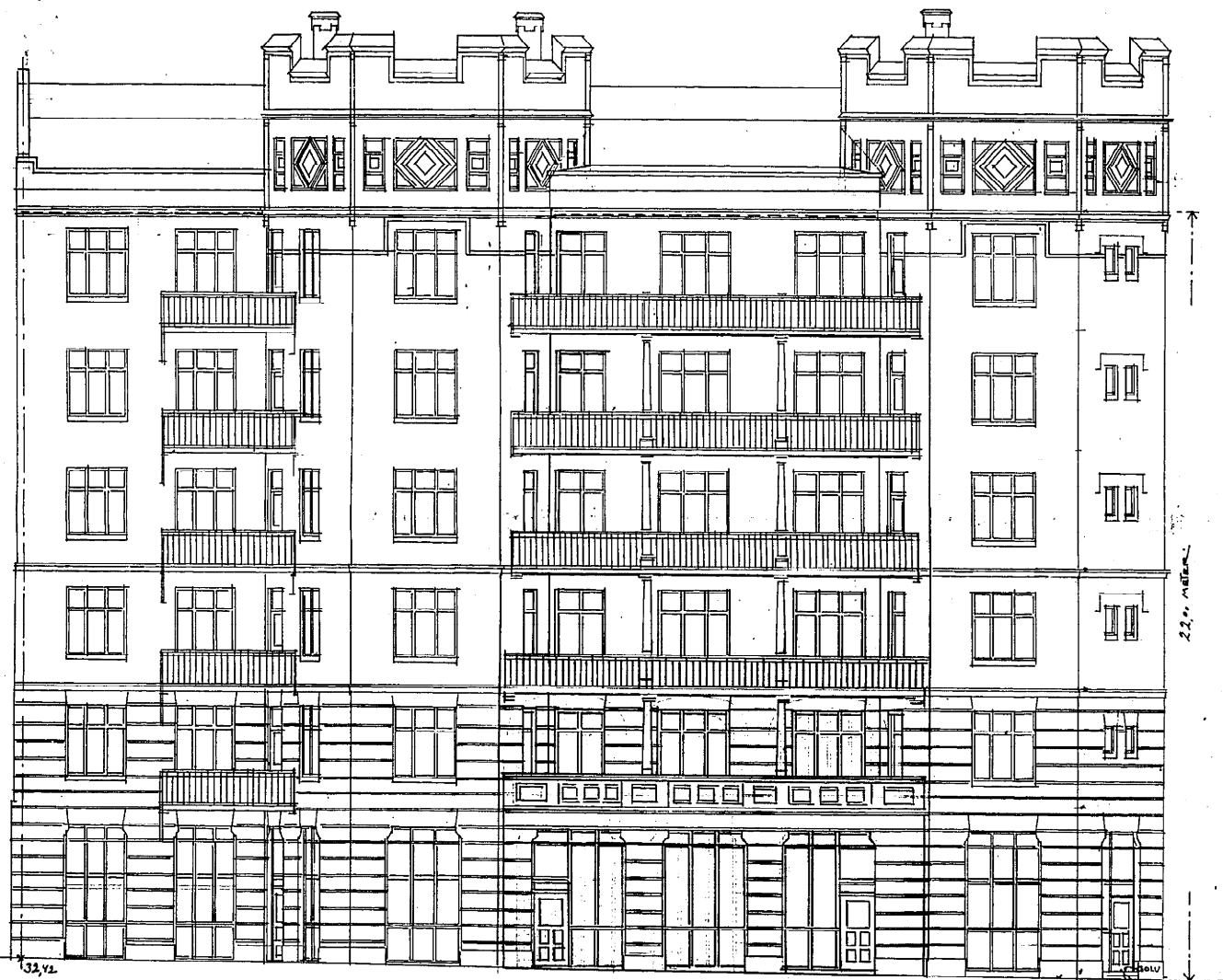
FASAD ÅT ARSENALSGATAN